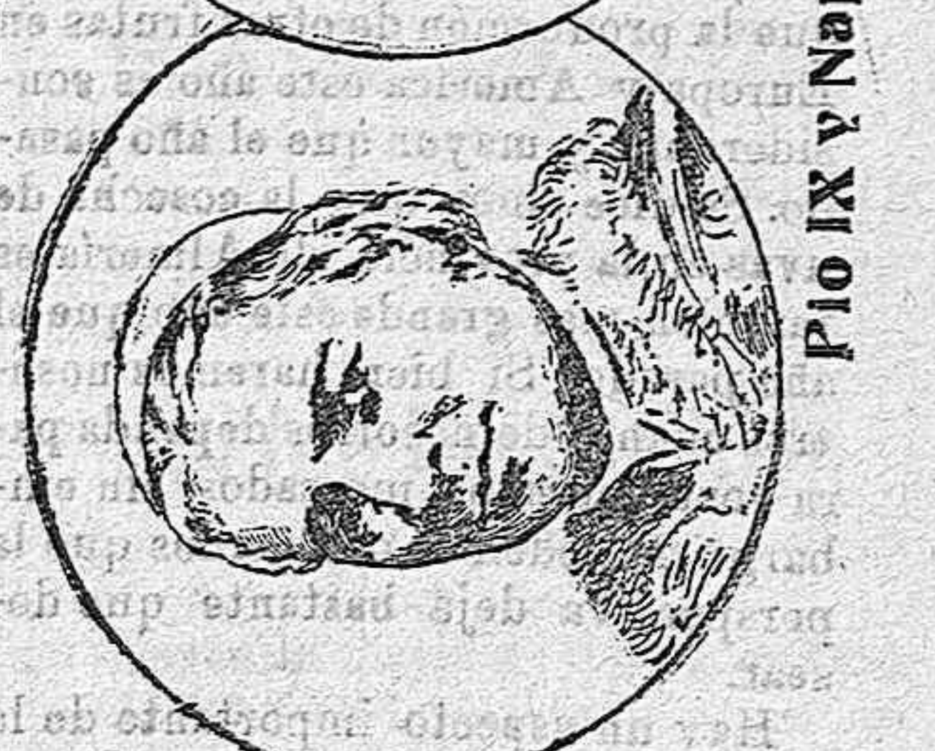
Pio IX y Napoleón III.

accedió, porque Francia no podía abandonar al Papa para hacer política italiana.