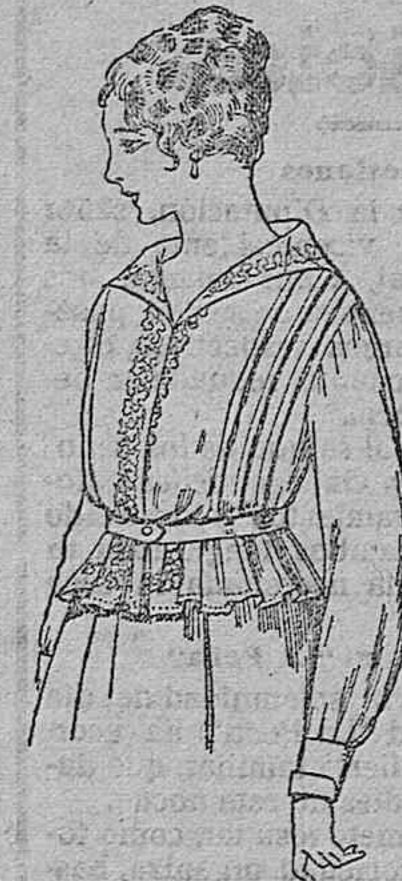
Blusa de voile blanco, bordados blancos, rosa o azul. A ptas. 9.