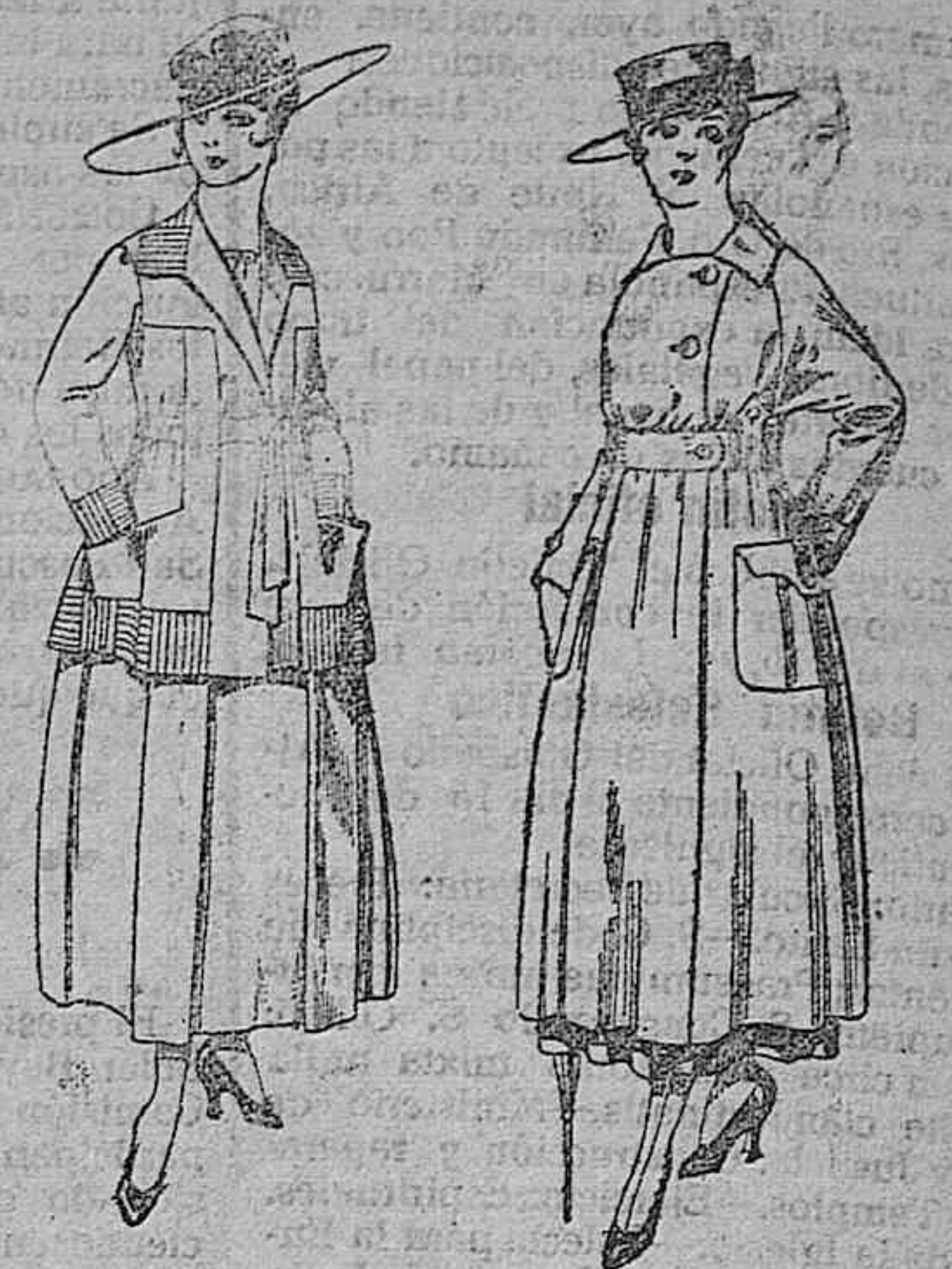
Traje de lanilla negro, azul, y color, bordado, a pesetas 90