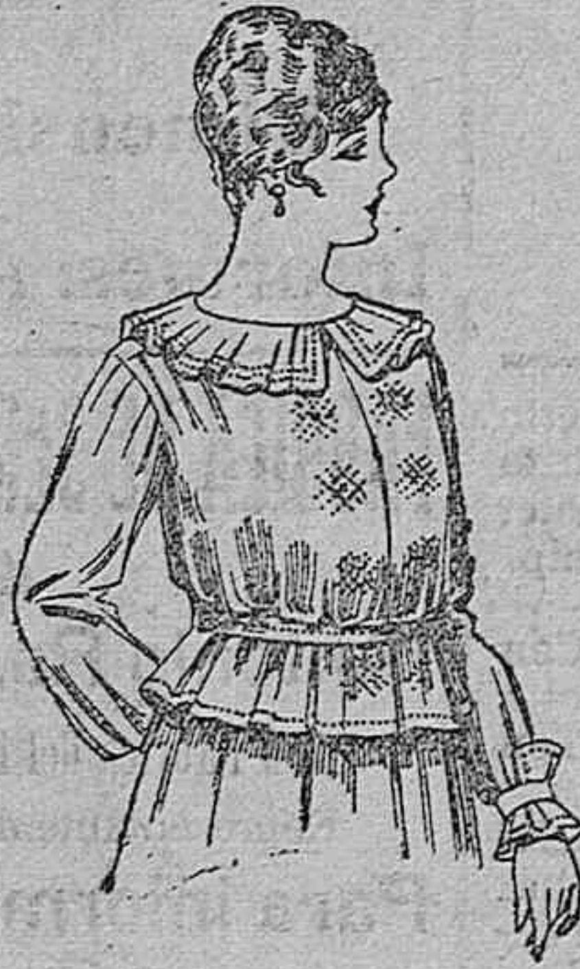
Blusa de crepón o negro, azul y color. A ptas. 33.