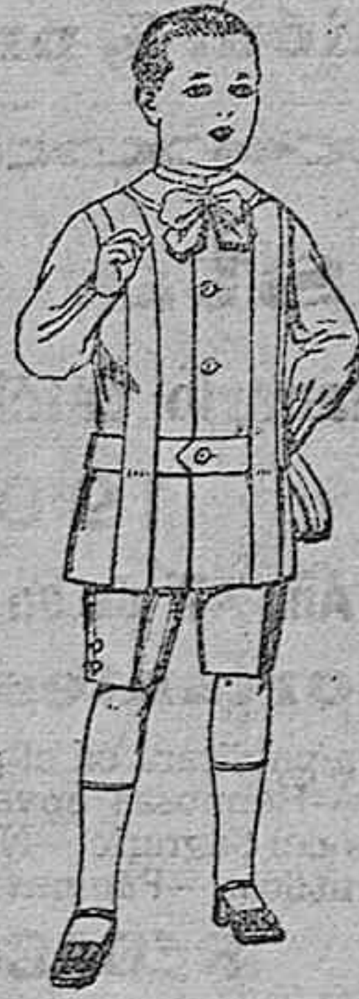
Trajes de lanilla, melton, etc., para niños de 4 a 9 años. De ptas. 16 a 33.