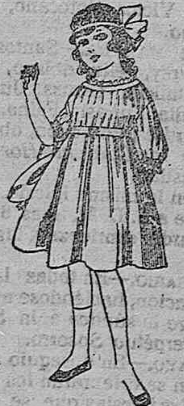
Vestidos de lanilla azul, para niñas de 4 a 9 años. De ptas. 22 a 25. Los mismos en voile. De ptas. 10 a 17.

Servicio directo, sin escalas, para pasajero carga entre Barcelona, Almería y Melilla, por el vapor