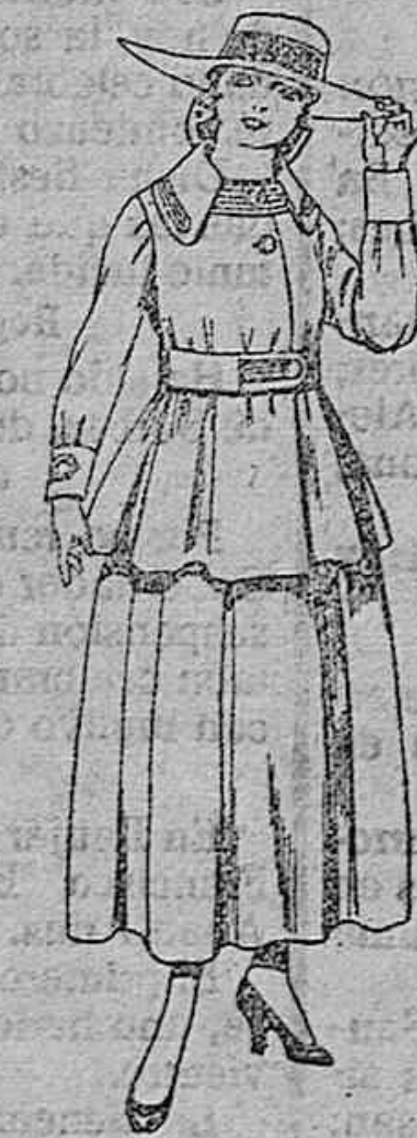
Trajes de lanilla negra, azul y color, para jovencitas de 13 a 16 años. De ptas. 50 a 55.