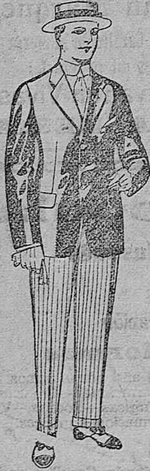
Trajes de lanilla, vicuña, etc., para jovencitos de 10 a 16 años. De ptas. 19 a 53.