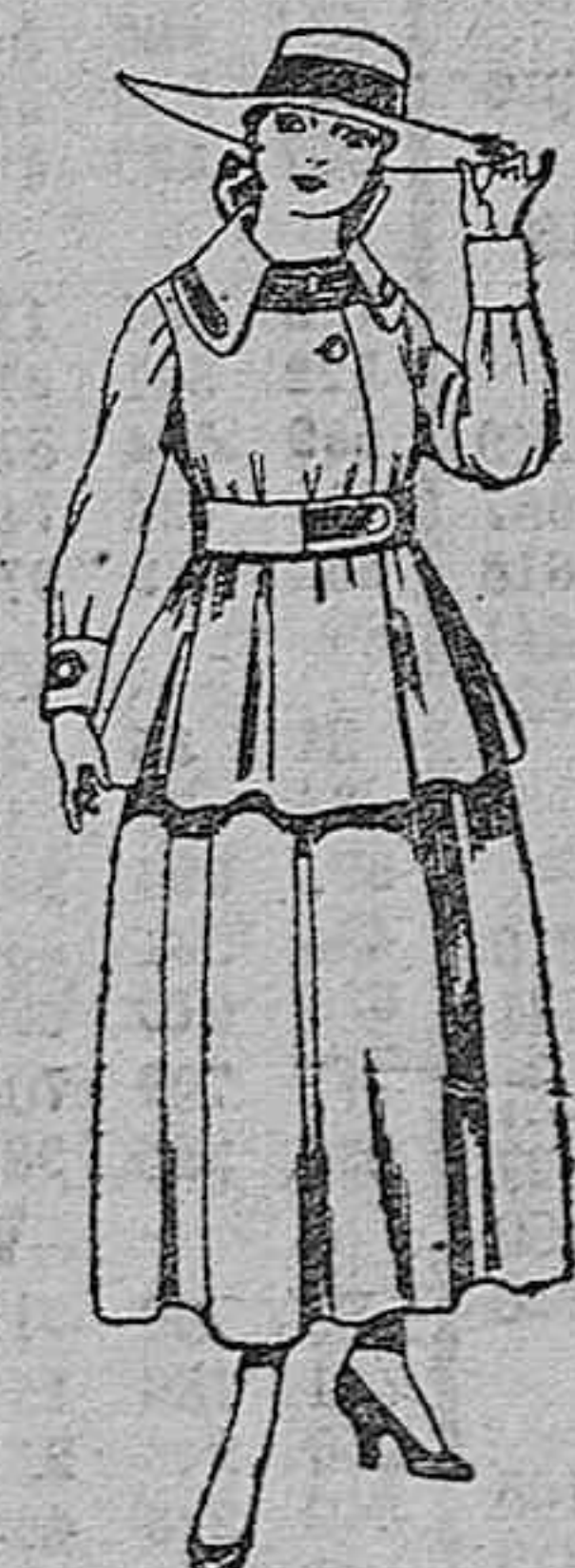
Trajes de lanilla negra, azul y color, para jovencitas de 13 a 16 años. De ptas. 50 a 55.