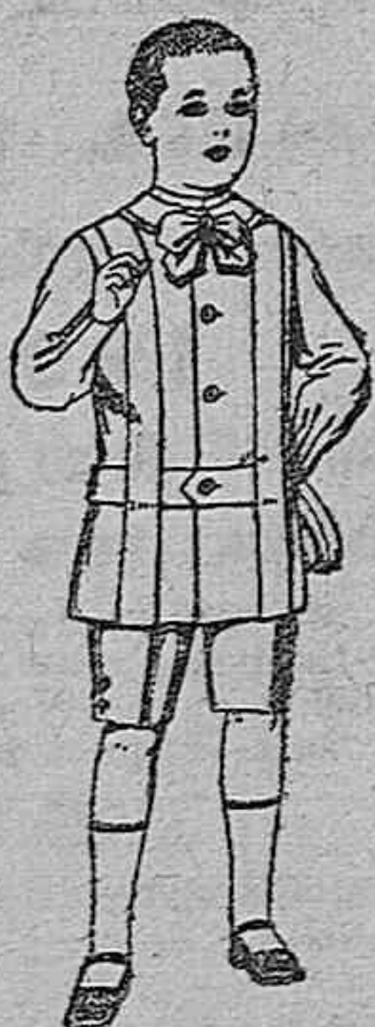
Trajes de lanilla, melton, etc., para niños de 4 a 9 años. De ptas. 16 a 32.