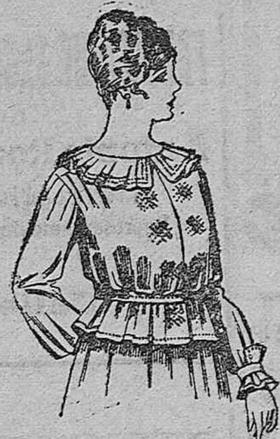
Blusa de crepón o seda, en negro, azul y color. A ptas. 23.