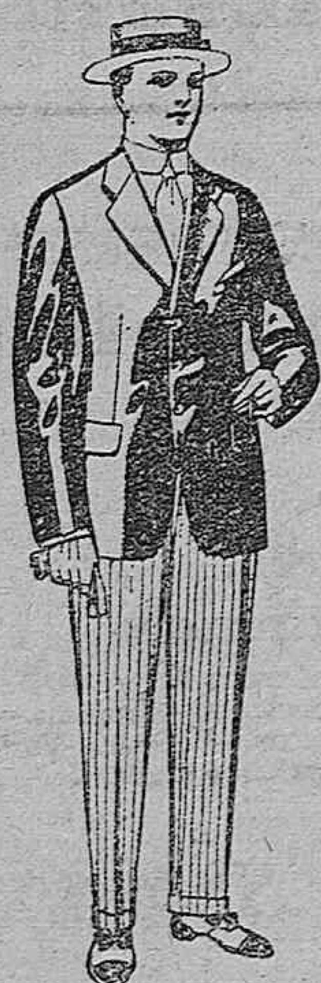
Trajes de lanilla, vicuña, etc., para juveniles de 10 a 16 años. De ptas. 13 a 15.