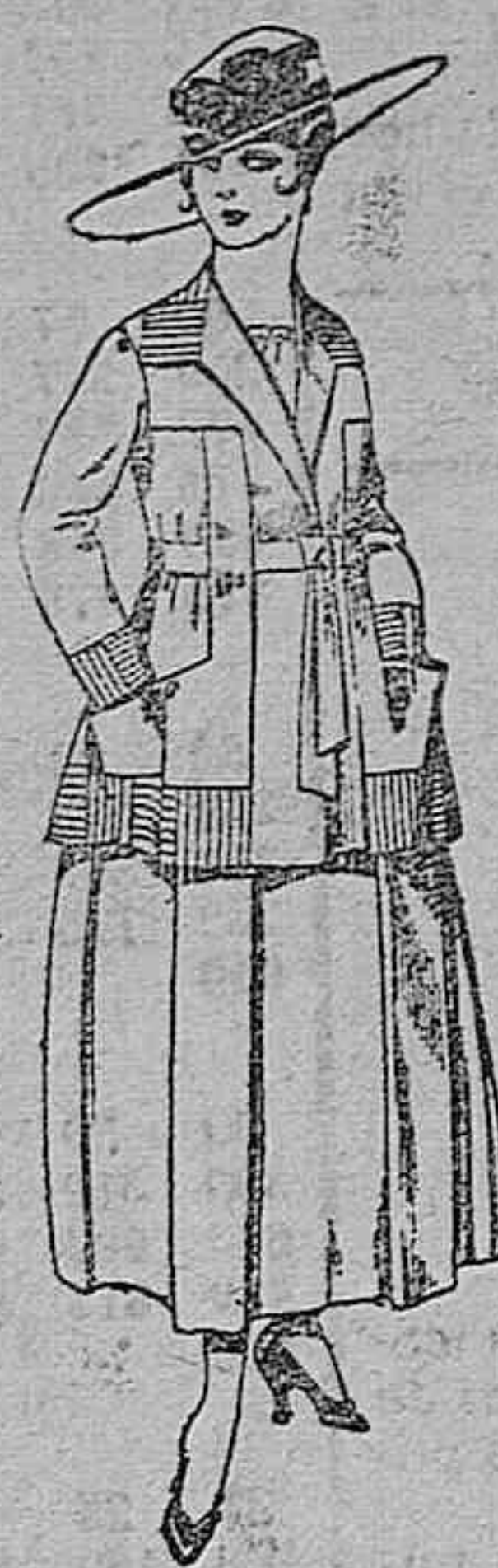
Traje de lanilla negro, azul, y color, bordado, a pesetas 90