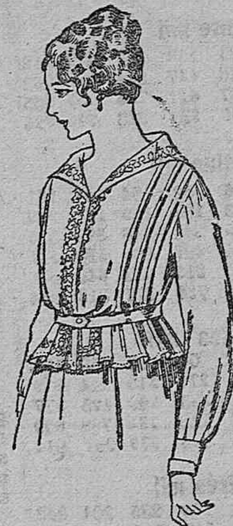
Blusa de voile blanco, bordados blancos, rosa o azul. A ptas. 9.