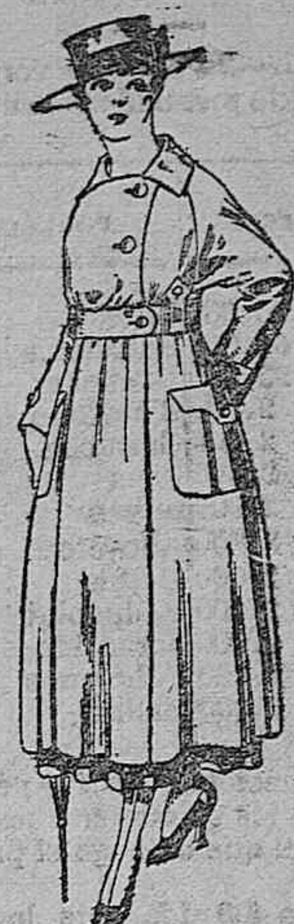
Vestido de estambre negro, azul y color, bordado. De pesetas 64 a 73.