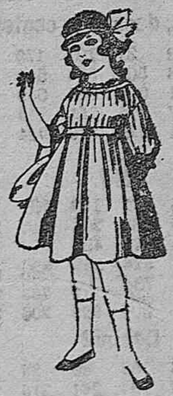
Vestidos de lanilla azul, para niñas de 4 a 9 años. De ptas. 22 a 25. Los mismos en voile. De ptas. 10 a 17.

Servicio fijo y regular para Almería y Melilla, por el vapor