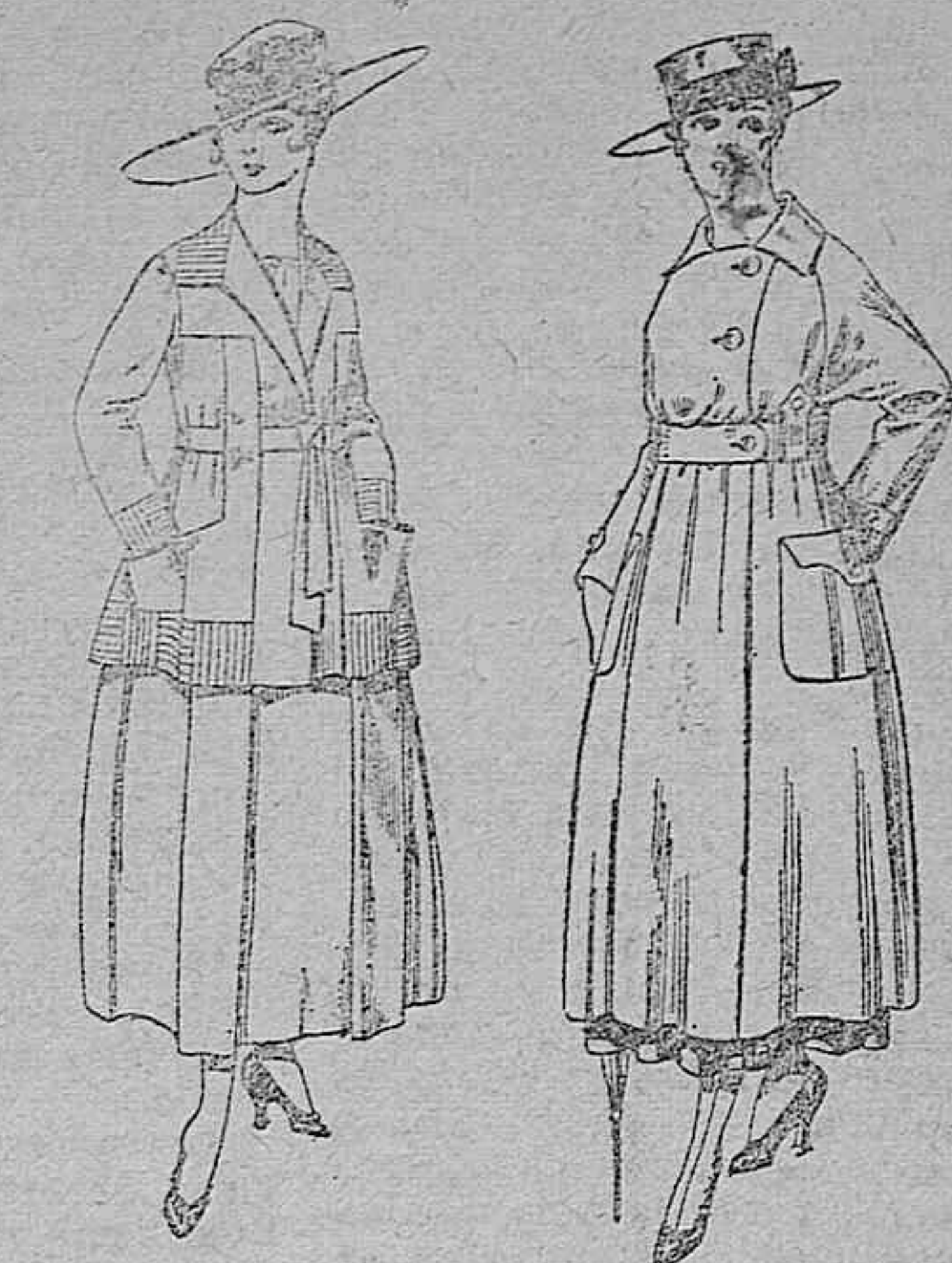
Traje de lanilla negro, azul, y color, bordado, a pesetas 90