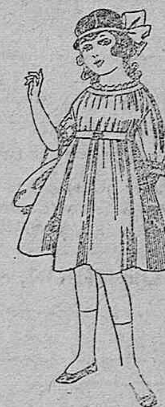
Vestidos de lanilla azul, para niñas de 4 a 9 años. De ptas. 22 a 25. Los mismos en voile. De ptas. 10 a 17.