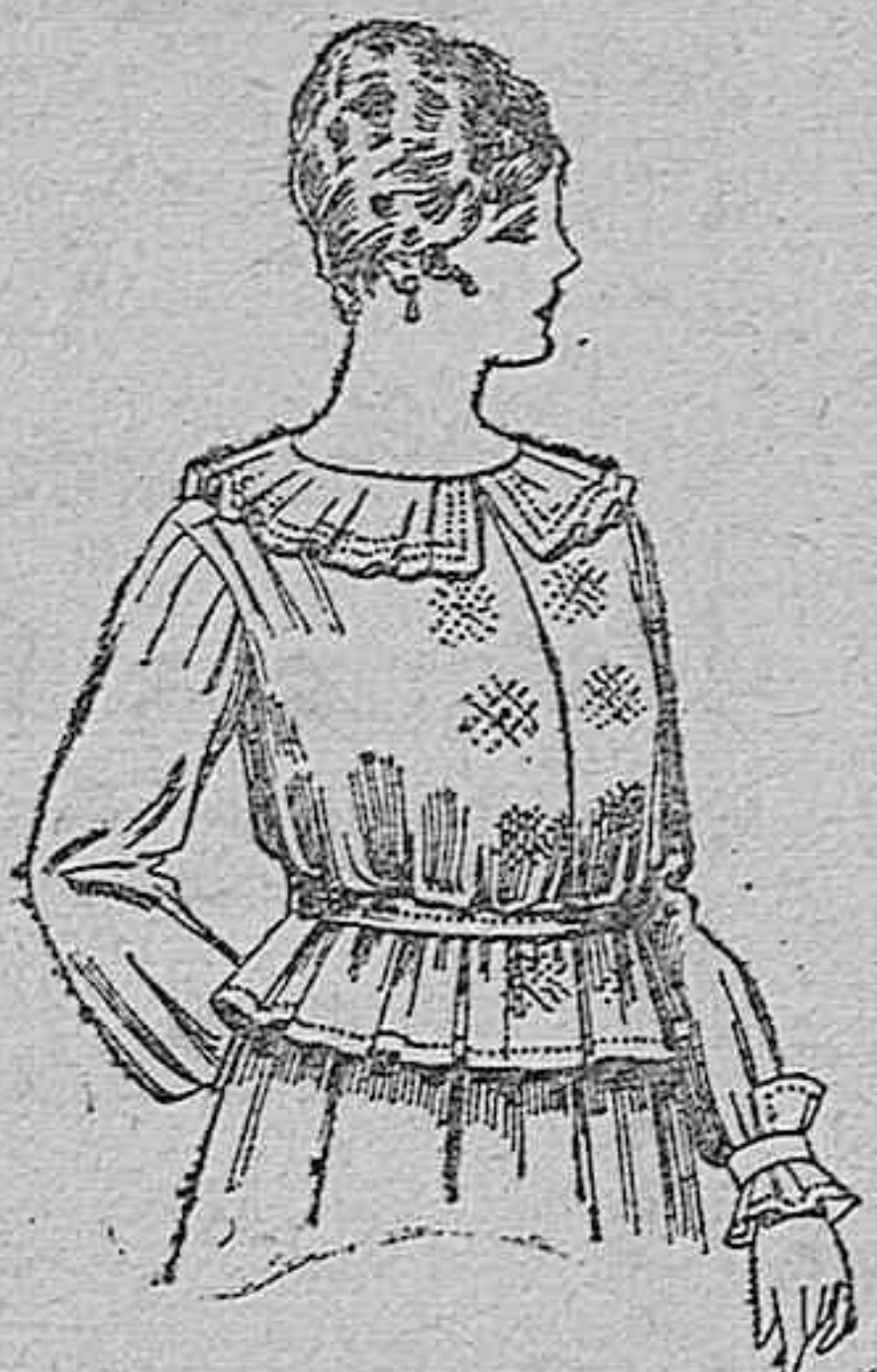
Blusa de crepón o seda, en negro, azul y color. A ptas. 33.