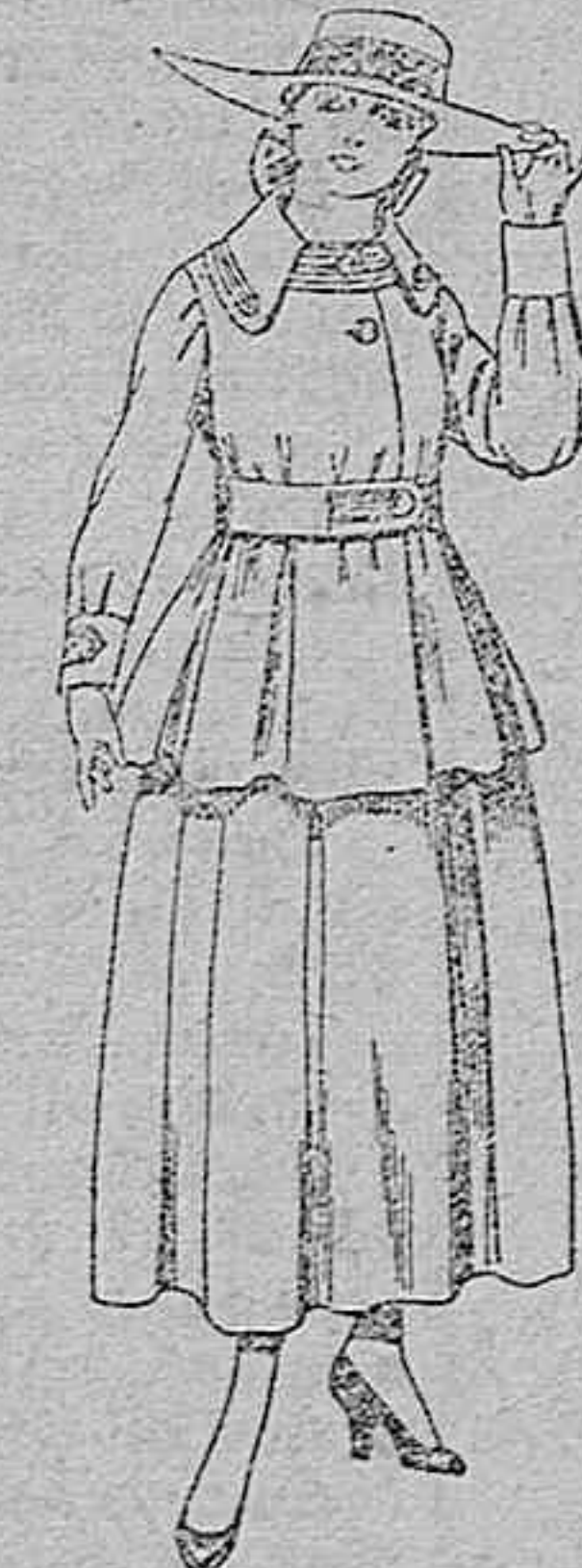
Trajes de lanilla negra, azul y color, para jovencitas de 13 a 16 años. De ptas. 50 a 55.