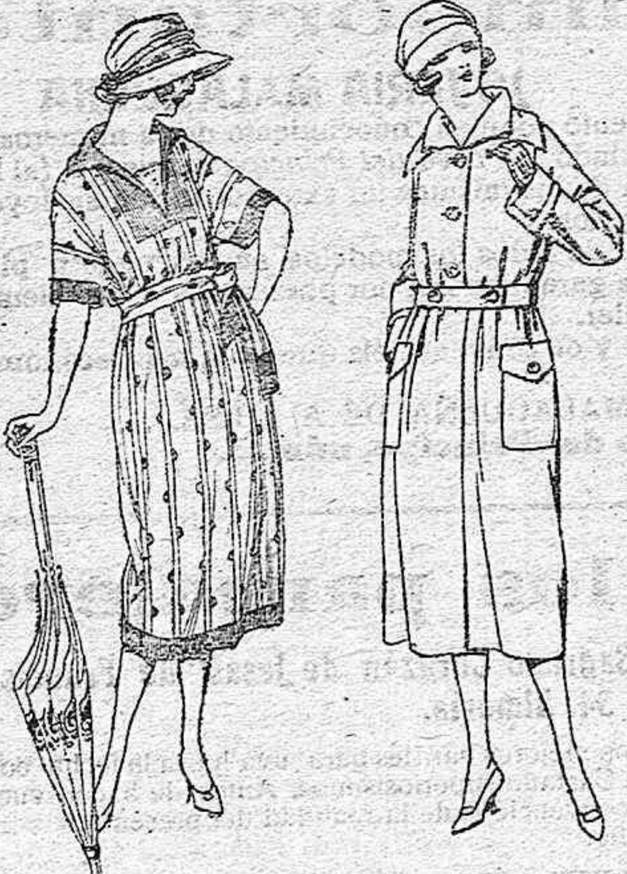
Vestidos de voile labrado, diferentes combinaciones de color. de ptas. 58 a 75

SUCURSALES: Madrid, Barcelona, Alicante, Bilbao, Málaga, Cartagena, Gijón, Granada, Palma de Mallorca, Santander, Sevilla, Cádiz, Valencia, Valladolid, Zaragoza.