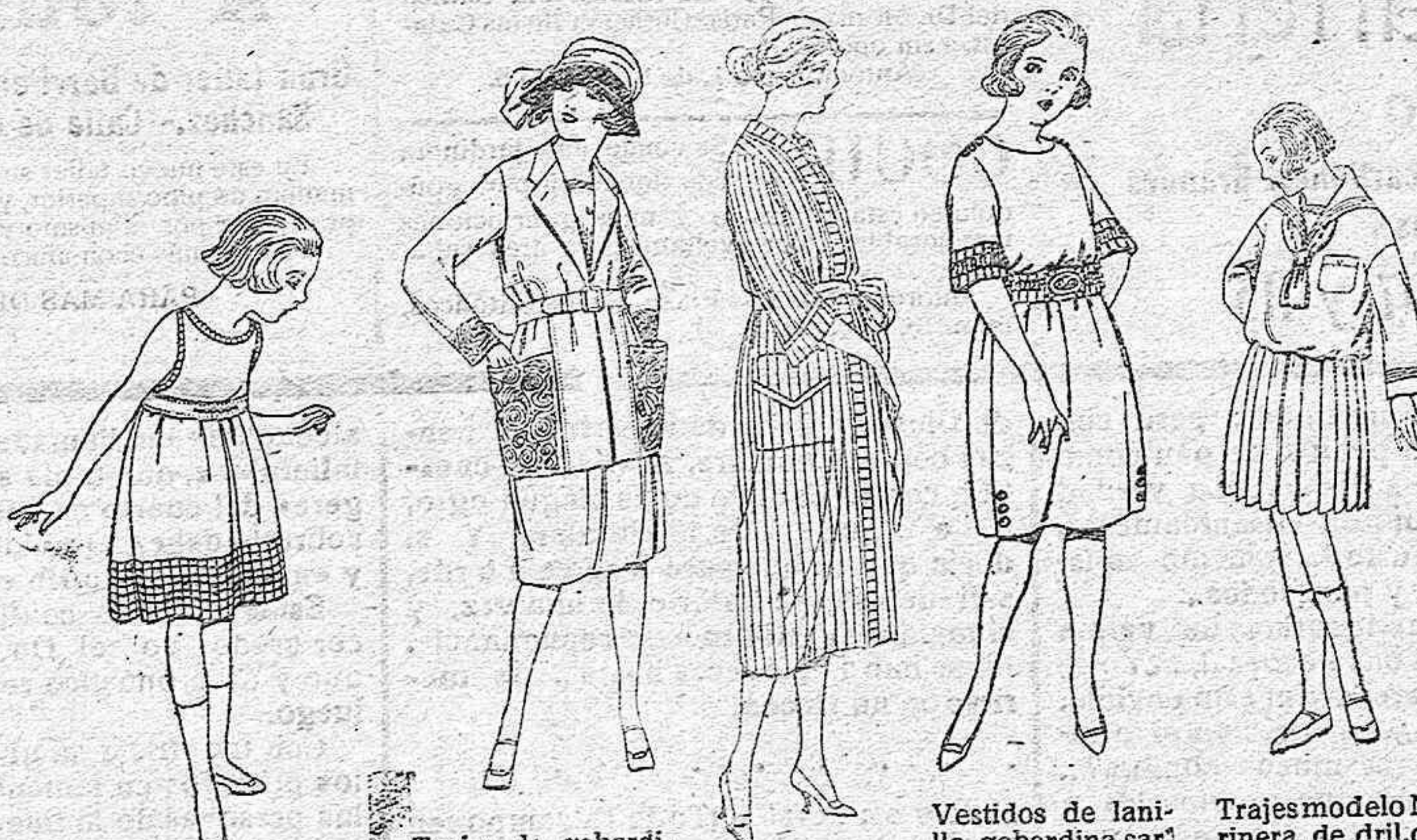
Delantales de voile blanco-combinado con voile o tampedo, para niñas de 4 a 6 años. de ptas. 8 a 10