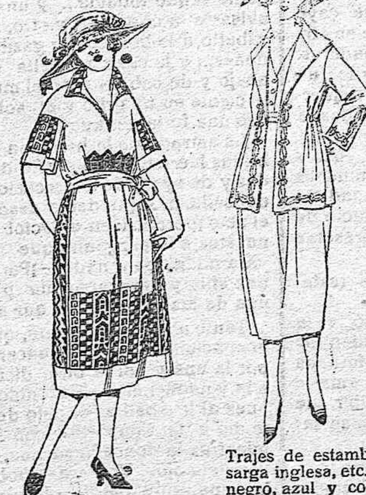
Vestidos de crespón blanco y color, adornos bordados. de ptas. 70 a 90