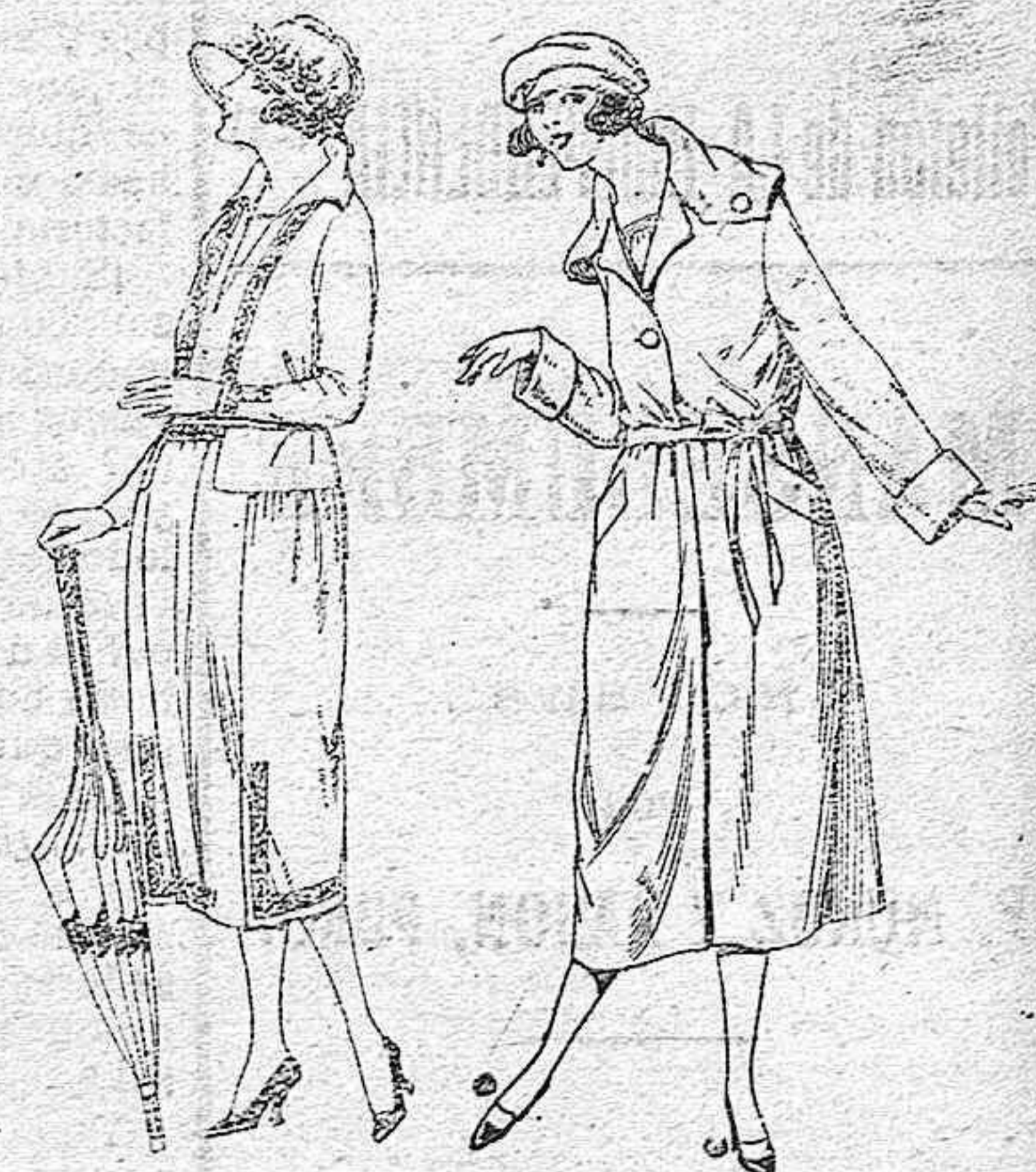
Vestidos de sarga inglesa, estambre, etc., en negro, azul y color, adornos bordados de pesetas 110 a 135