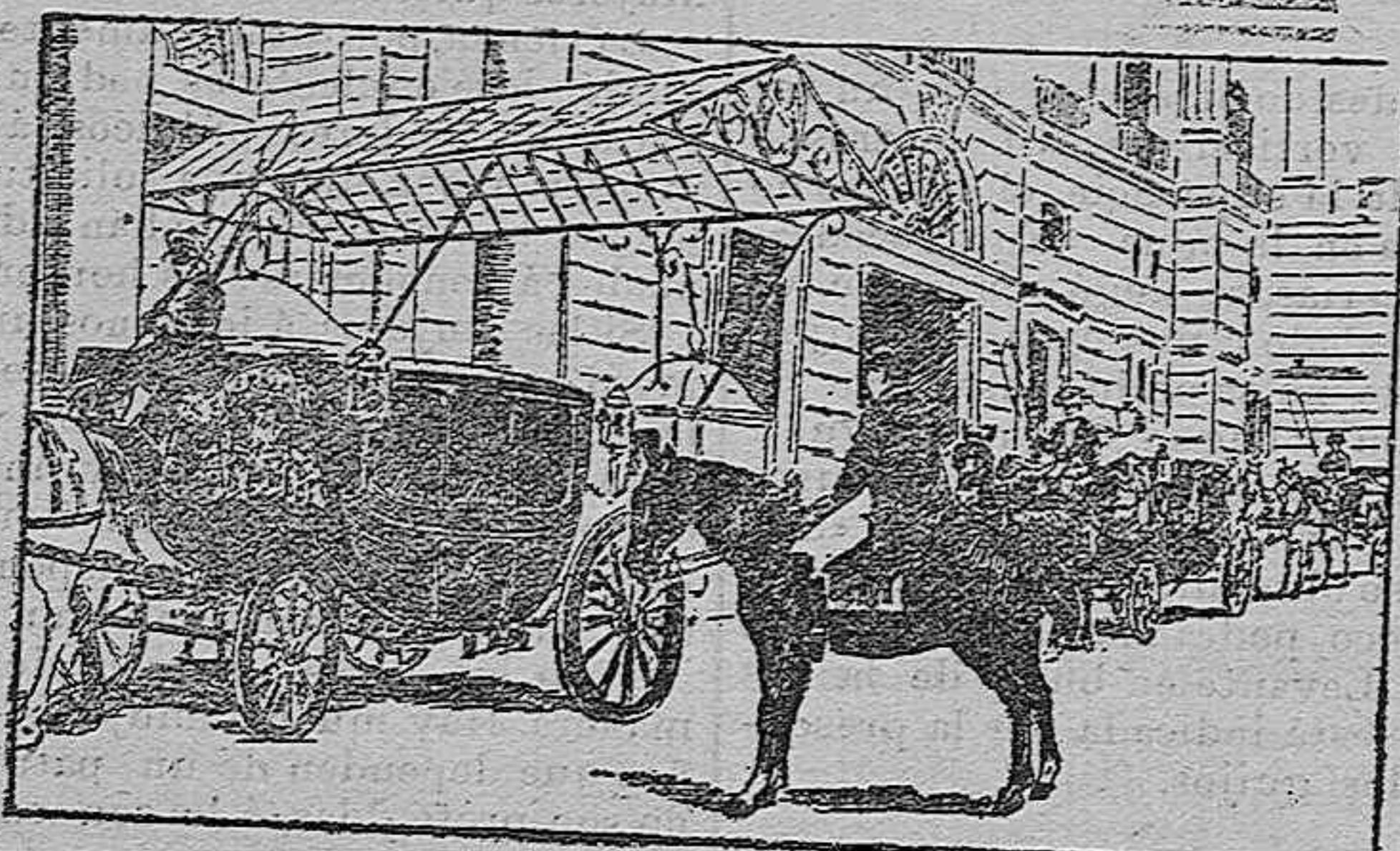
Las carrozas de gala al partir de la Plaza de Armas la régla comitiva.