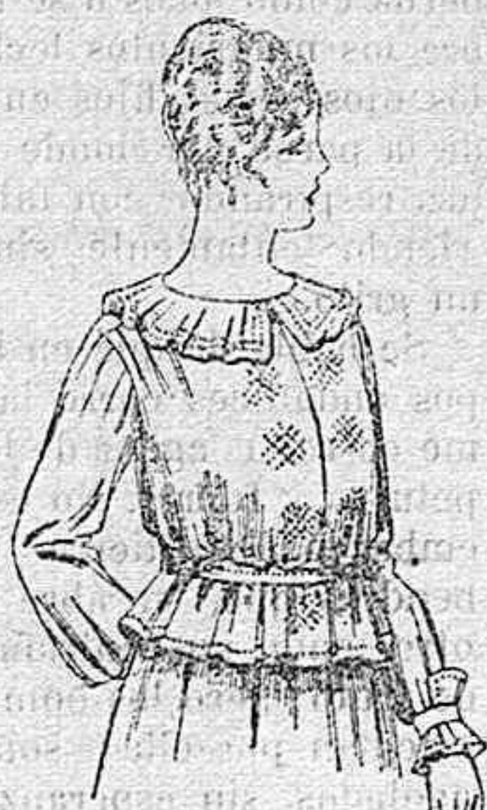
Blusa de crepón ó seda, en negro, azul y color. A ptas. 33.

Los mismos de melton ó estambre novedad, de pesetas 33 á 90.