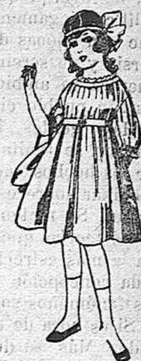
Vestidos de lana, azul, para niñas de 4 á 9 años. De pesetas 22 á 25. Los mismos en voile. De pesetas 10 á 17

GENEROS DEL PAIS Y EXTRANJEROS PARA LA SECCION DE MEDIDA