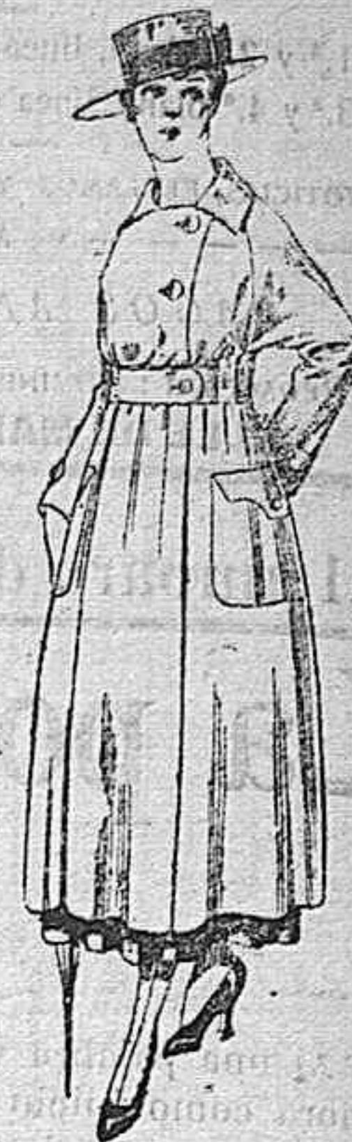
Vestido de estambre negro, azul y colores bordado. De peseta 64 á 75