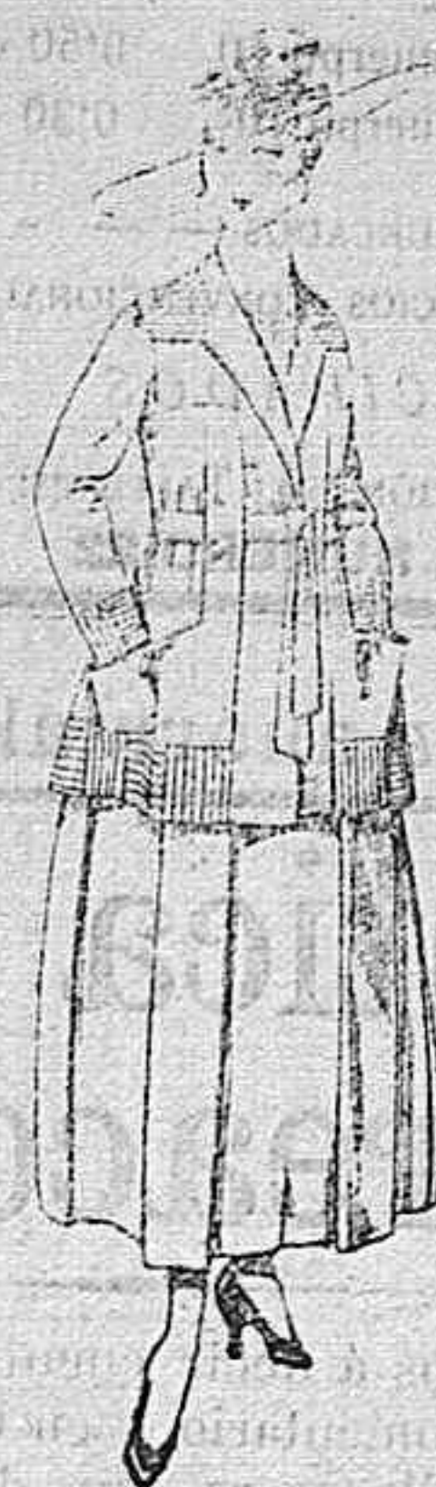
Trajes de lanilla negro, azul, y color, bordado, á pesetas 90.