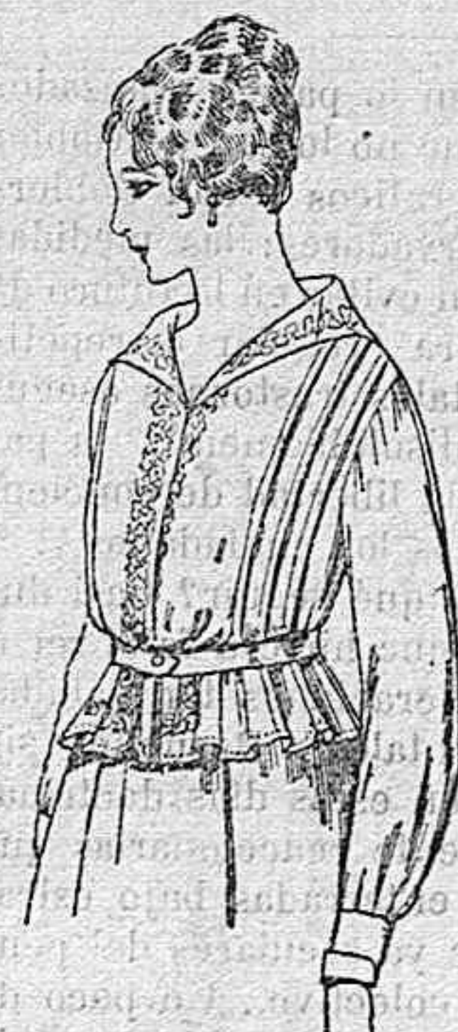
Blusa de voile blanco, bordados blancos, rosa ó azul. A ptas. 9