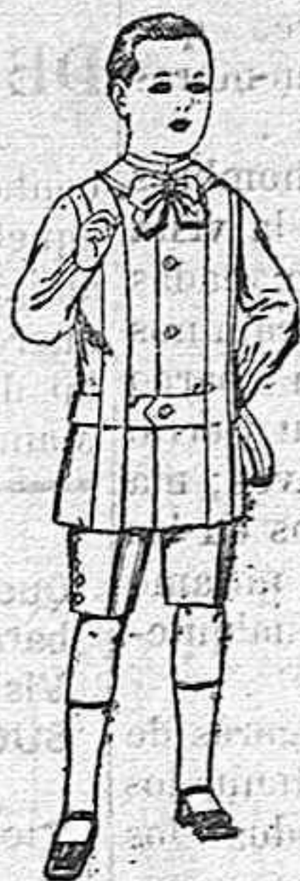
Trajes de lanilla, melton, etc. para niños de 4 á 7 años. De ptas. 16 á 33.