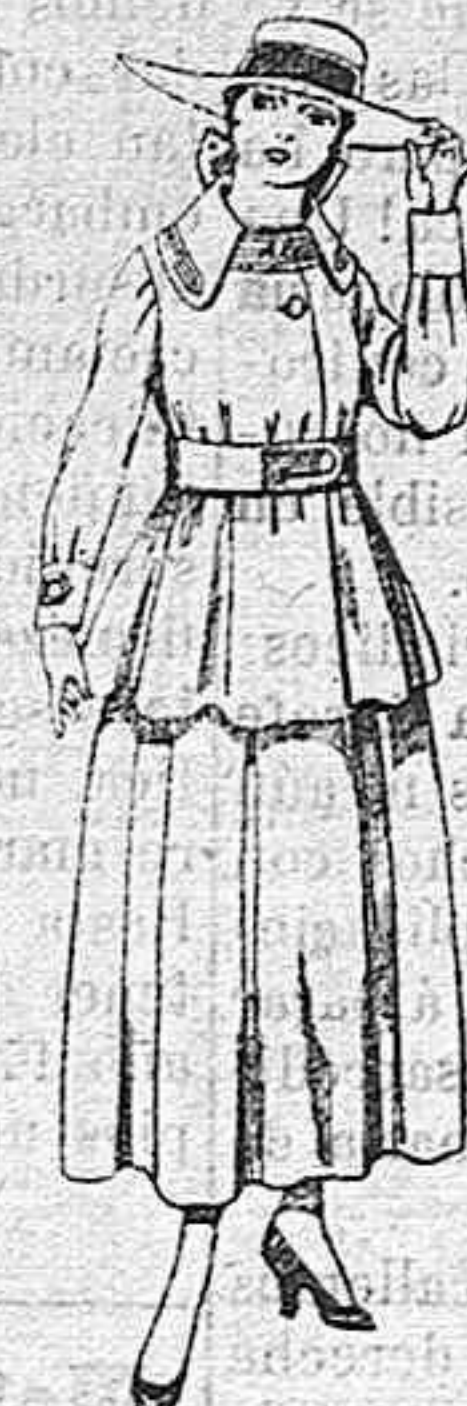
Trajes de lanilla negra, azul y color, para jovencitas de 13 á 16 años.