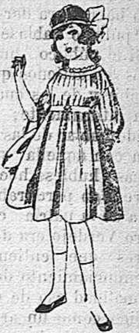
Vestidos de lana, azul, para niñas de 4 á 9 años De pesetas 22 á 25 Los mismos en voile. De pesetas 10 á 17