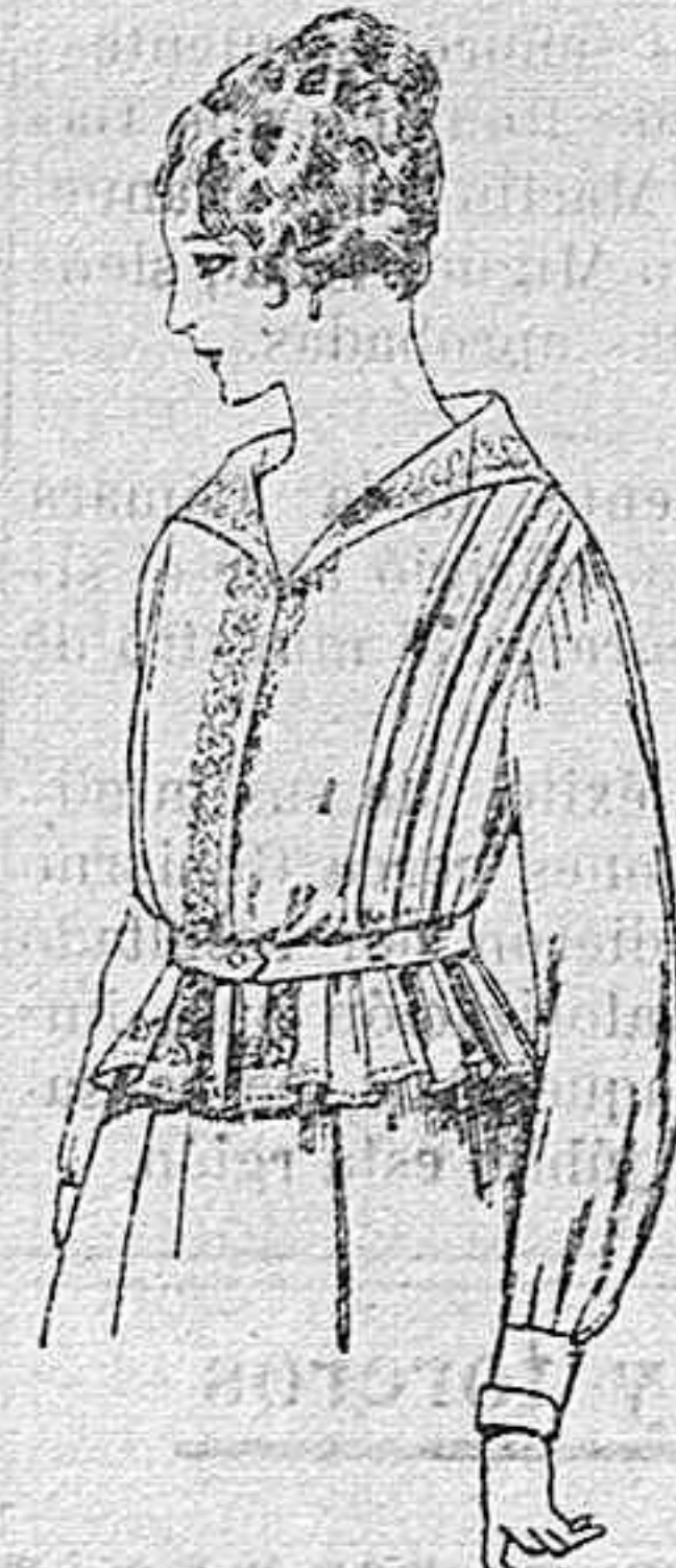
Blusa de voile blanco, bordados blancos, rosa ó azul A ptas. 9