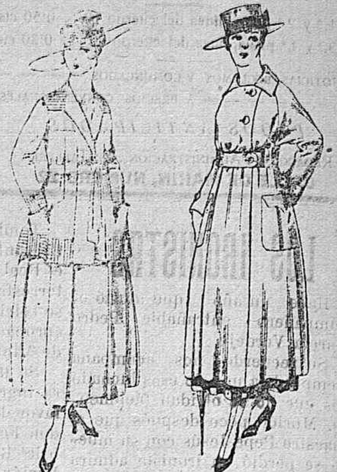
Trajes de lanilla negro, azul, y color, bordado, á pesetas 90. Vestido de estambre negro, azul y colores bordado De peseta 64 á 75