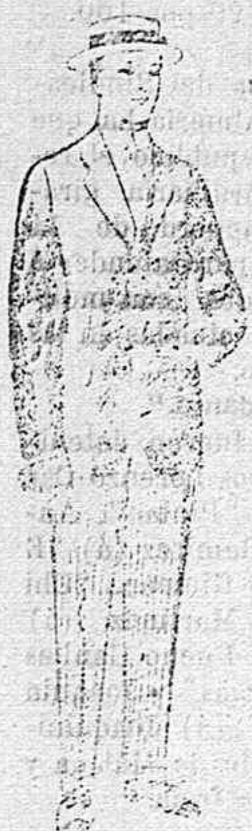
Trajes de lanilla, vicuña, etc., para jovencitas de 10 á 16 años. De pesetas 10 á 56