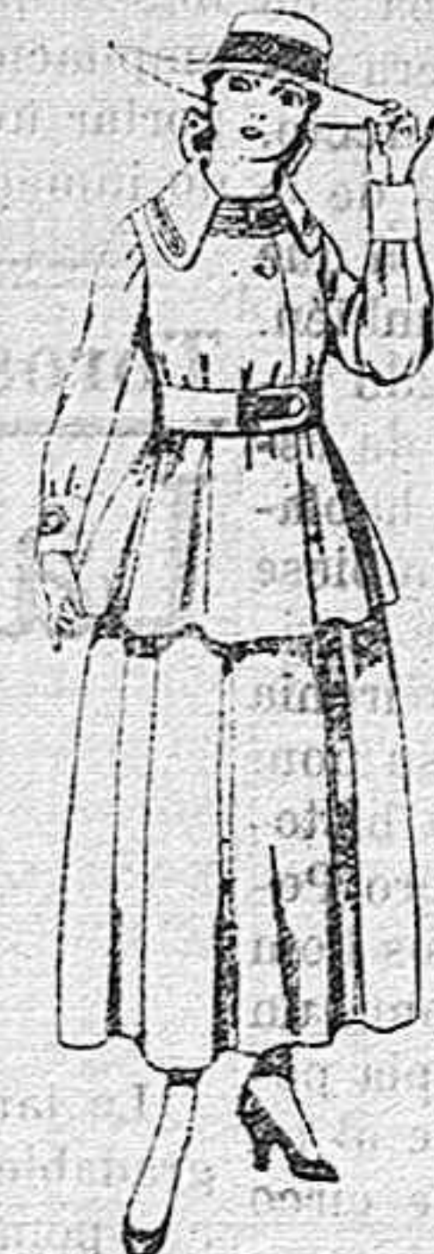
Trajes de lanilla negra, azul y color, para jovencitas de 13 á 16 años.