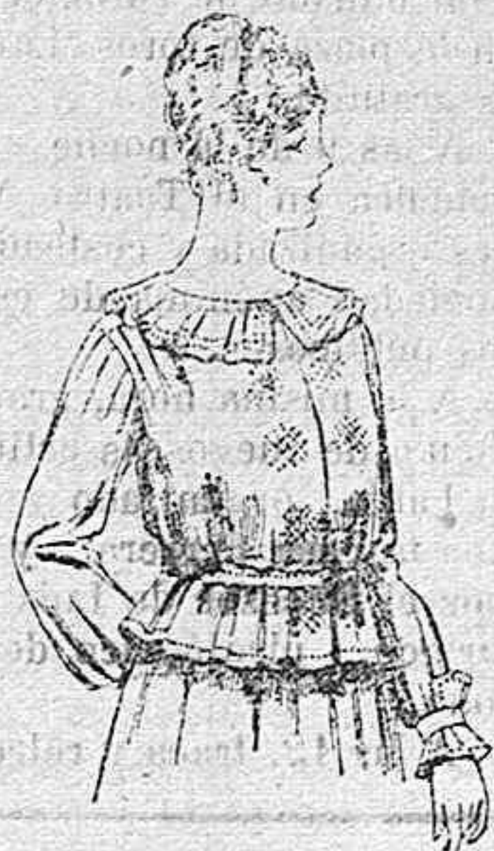
Blusa de crespón ó seda, en negro, azul y color. A ptas. 33.