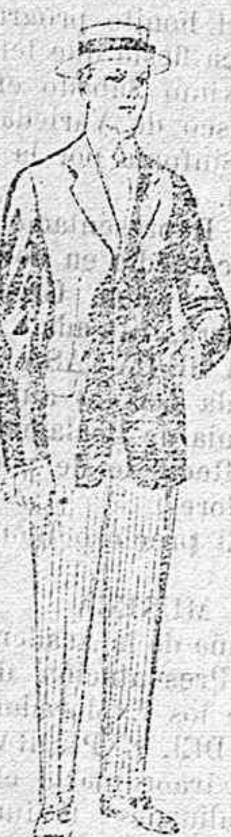
Trajes de lanilla, vicuña, etc., para jovencitos de 10 á 16 años. De pesetas 10 á 56