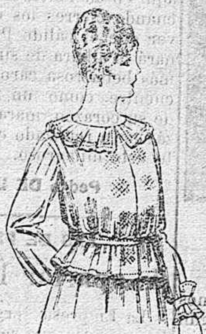
Blusa de crespón ó seda, en negro, azul y color. A ptas. 33.