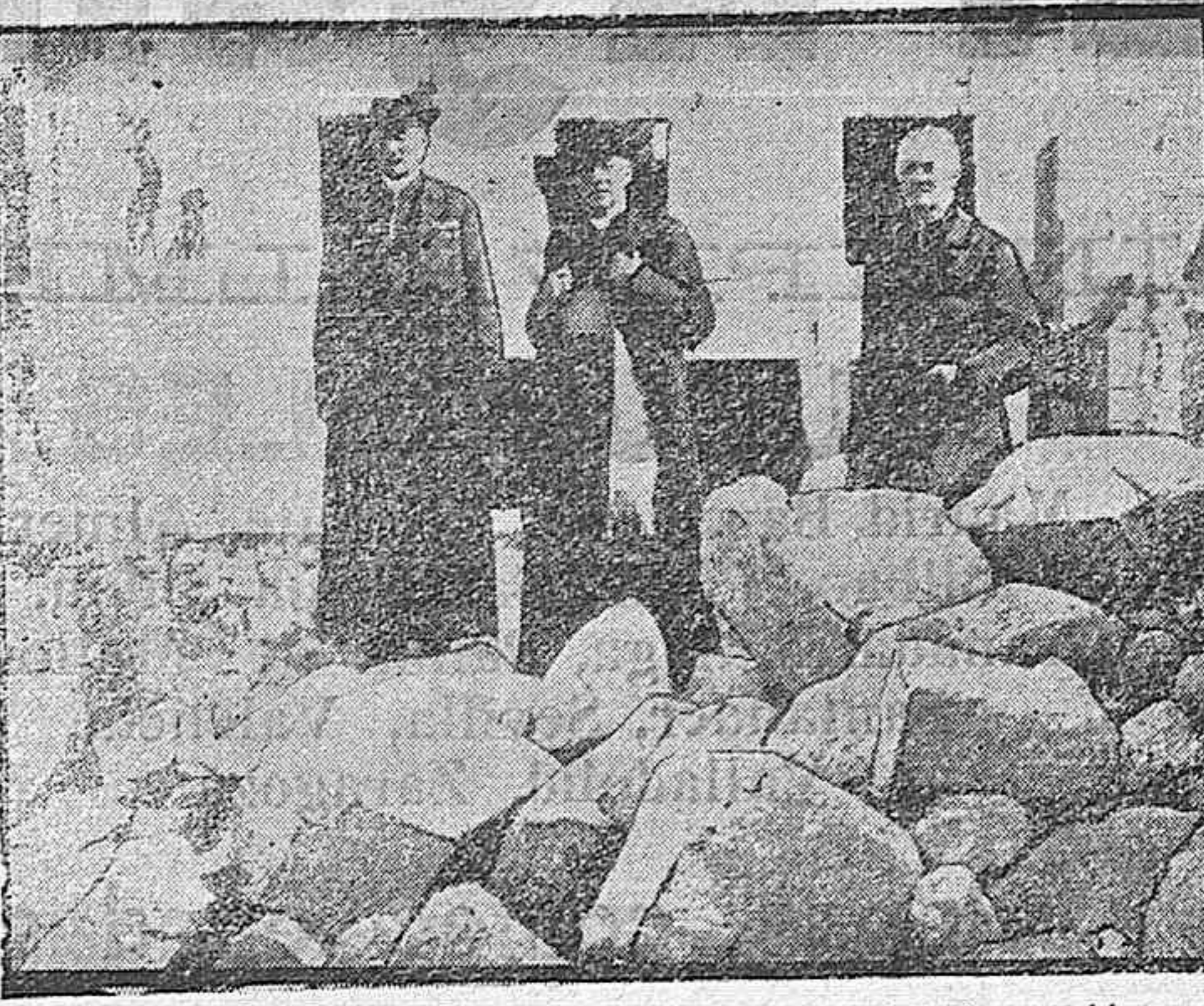
El Obispo de Beauvais visitando las ruinas de una Iglesia