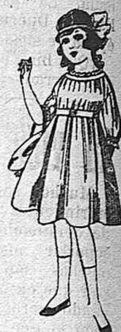
Vestidos de lana, azul, para niñas de 4 á 9 años De pesetas 22 á 25 Los mismos en voi- le. De pesetas 10 á 17