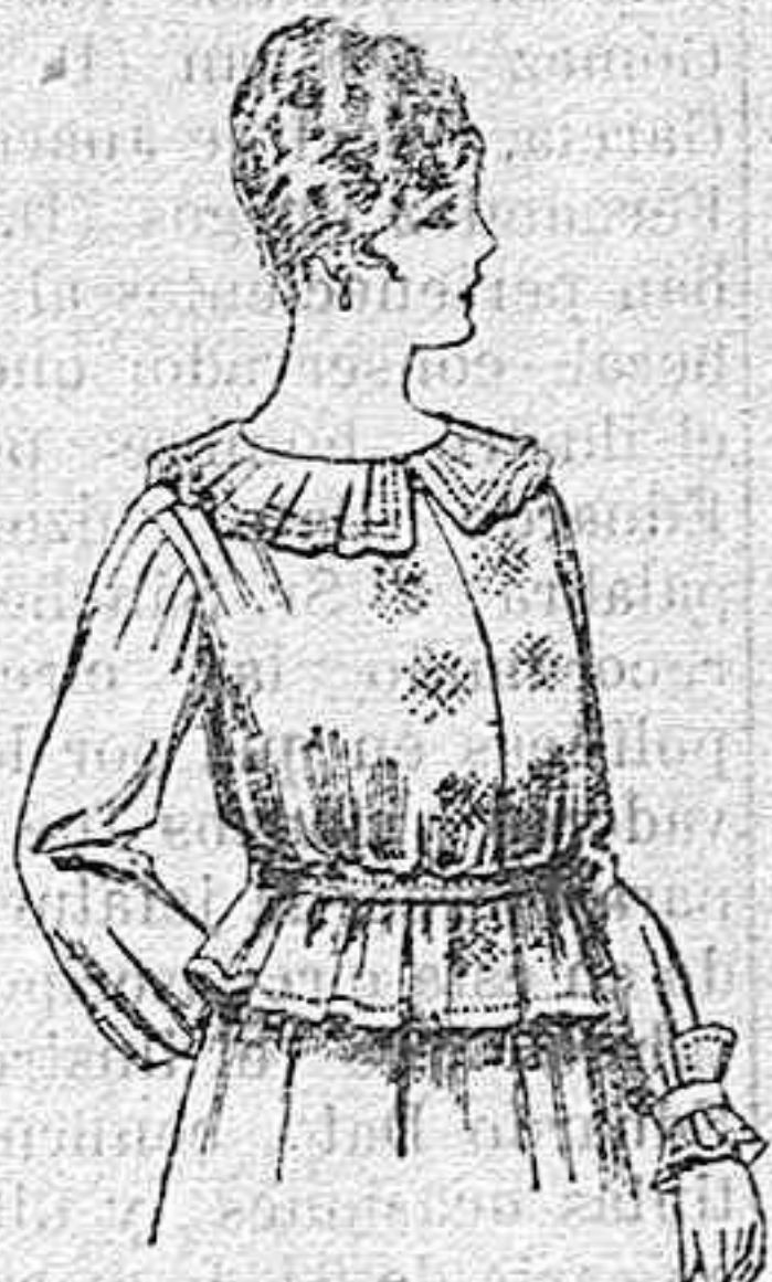
Blusa de crespón ó seda, en negro, azul y color. A ptas. 33.