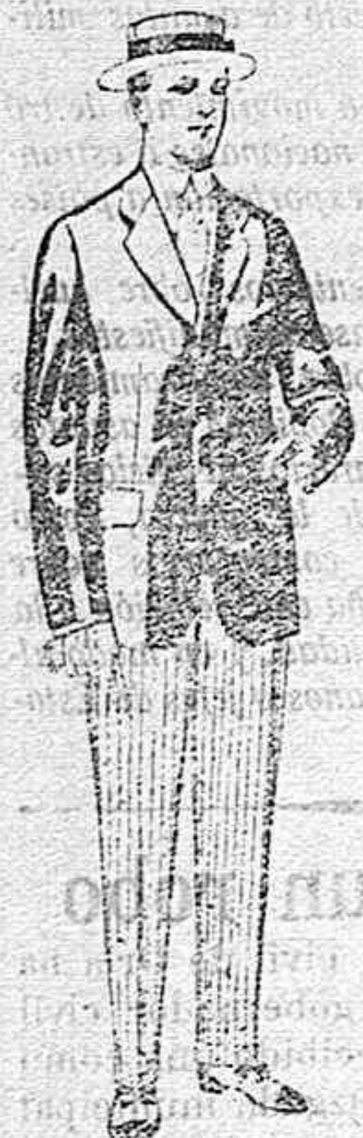
Trajes de lanilla, vicuña, etc., para jovencitos de 10 á 16 años. De pesetas 10 á 56