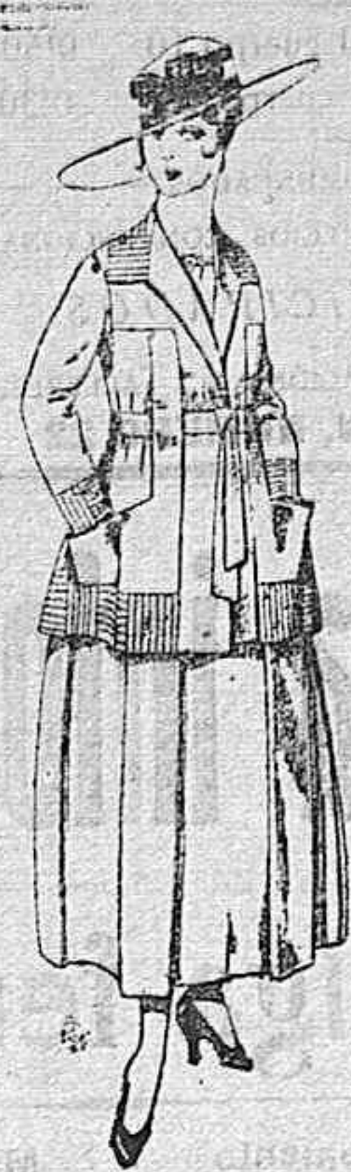
Trajes de lanilla negro, azul, y color, bordado, á pesetas 90.