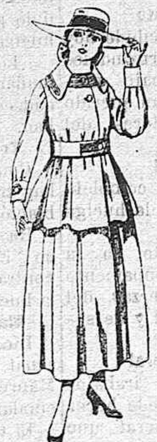
Trajes de lanilla negra, azul y color, para jovencitas de 13 á 16 años.