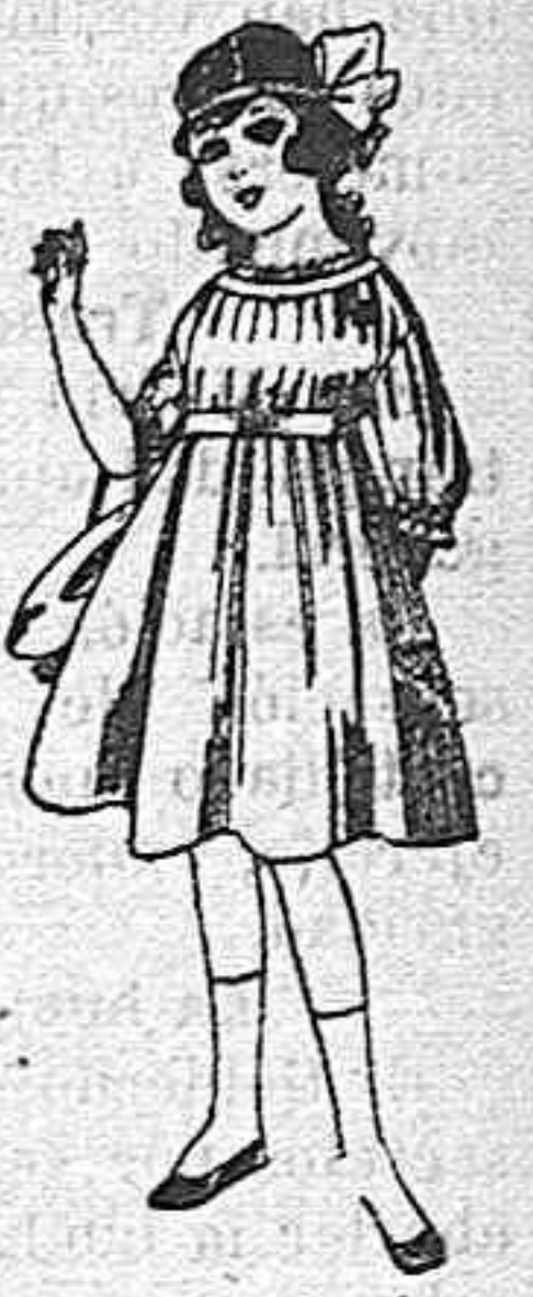
Vestidos de lana, azul, para niñas de 4 á 9 años De pesetas 22 á 25 Los mismos en voile. De pesetas 10 á 17