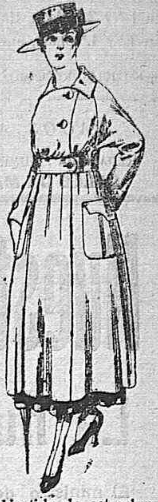
Vestido de estambre negro, azul y colores bordado De peseta 64 á 75