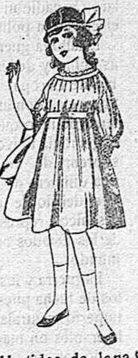
Vestidos de lana, azul, para niñas de 4 á 9 años. De pesetas 22 á 25. Los mismos en voile. De pesetas 10 á 17