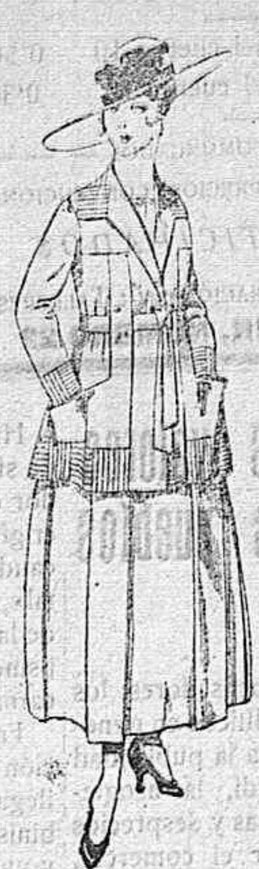
Trajes de lanilla negro, azul, y color, bordado, á pesetas 90.