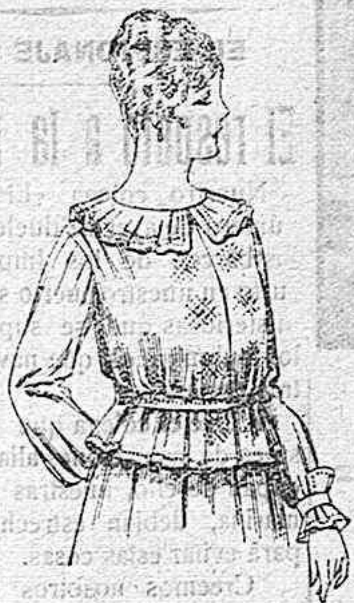
Blusa de crespón ó seda, en negro, azul y color. A ptas. 33.