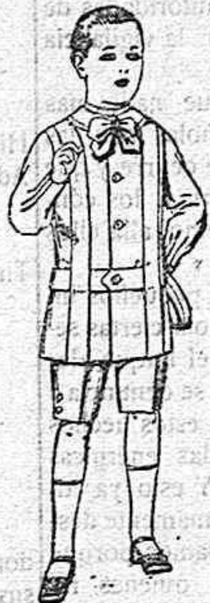
Trajes de lanilla, melton, etc. para niños de 4 á 7 años. De ptas. 16 á 33.