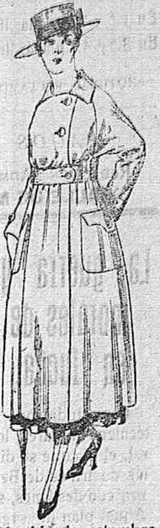
Vestido de estambre negro, azul y colores bordado. De peseta 64 á 75