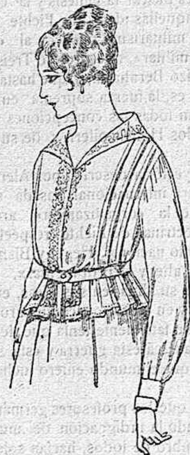
Blusa de voile blanco, bordados blancos, rosa ó azul. A ptas. 9