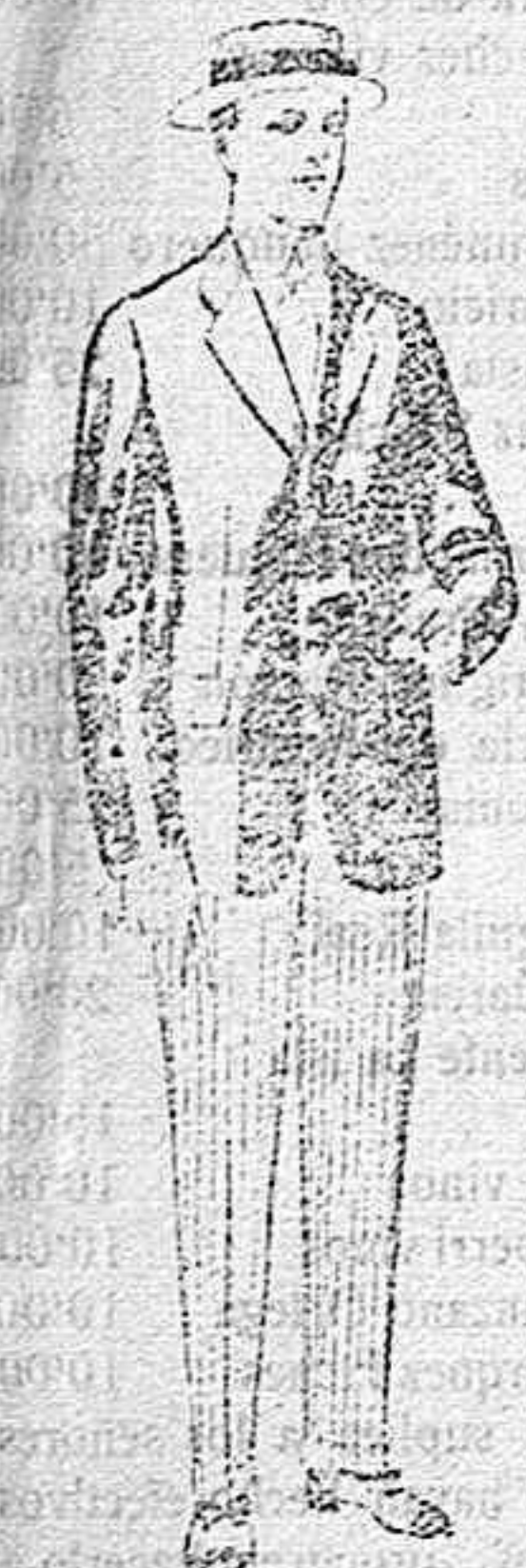
Trajes de lanilla, vicuña, etc., para jovencitos de 10 á 16 años. De pesetas 10 á 56