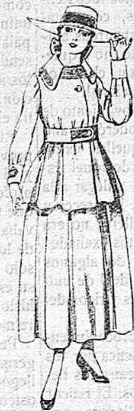
Trajes de lanilla negra, azul y color, para jovencitas de 13 á 16 años.