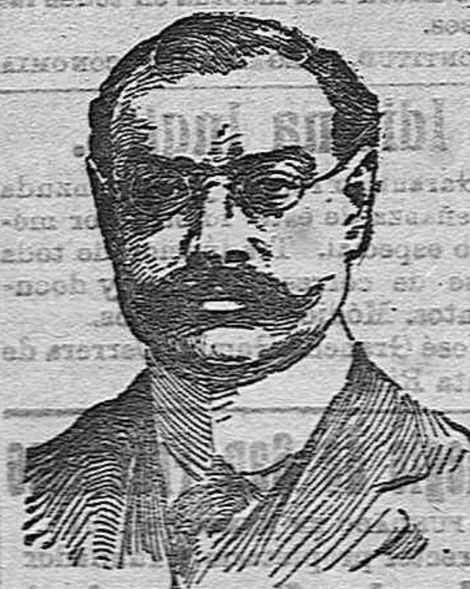
El éxito que con él obtuvo, que una vez asegurada la vida de su primera publicación, fundó otros, llegando al poco tiempo á verse

El hombre suprimió aquellas cubierta protectora, arrancó aquellos clavos, convirtió aquel suelo firme y mollido en roca viva, por la que resbalan hoy velozmente las aguas, ó en ligera capa de tierra, fácilmente arrastrable, y las corrientes que en otro tiempo bajaban limpias y suaves, produciendo beneficios por campos y poblados, hoy llegan cansadas, esparciendo por ellos la destrucción y la muerte.