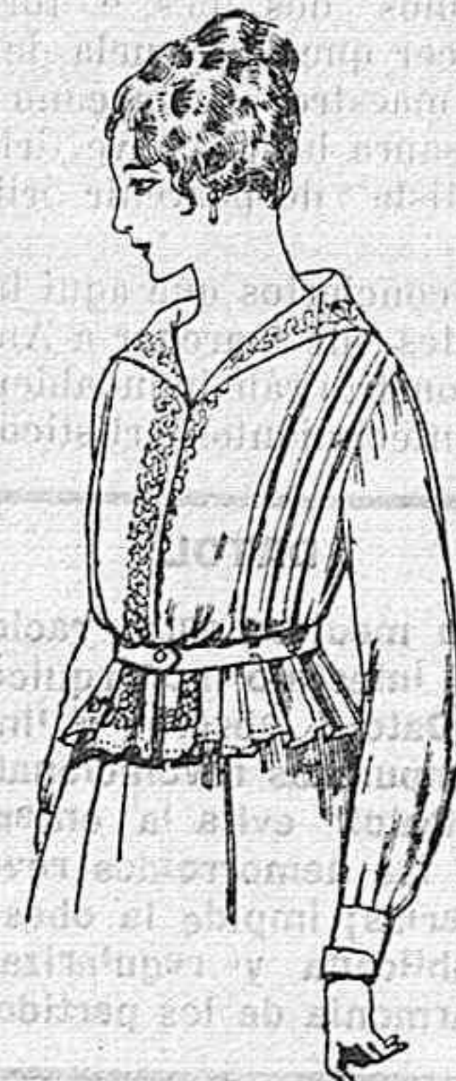
Blusa de voile blanco, bordados blancos, rosa ó azul. A ptas. 9.