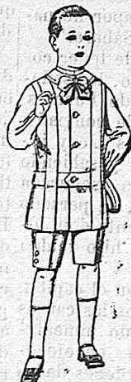
Trajes de lanilla, melton, etc. para niños de 4 á 7 años. De ptas. 16 á 33.