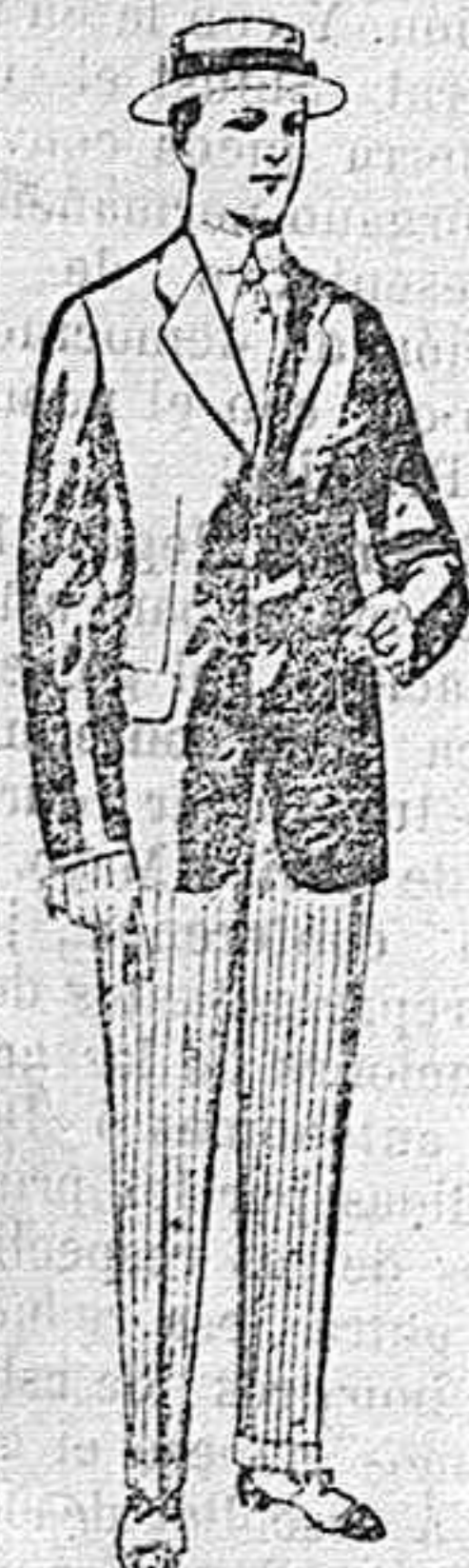
Trajes de lanilla, vicuña, etc., para jovencitos de 10 á 16 años. De pesetas 10 á 56