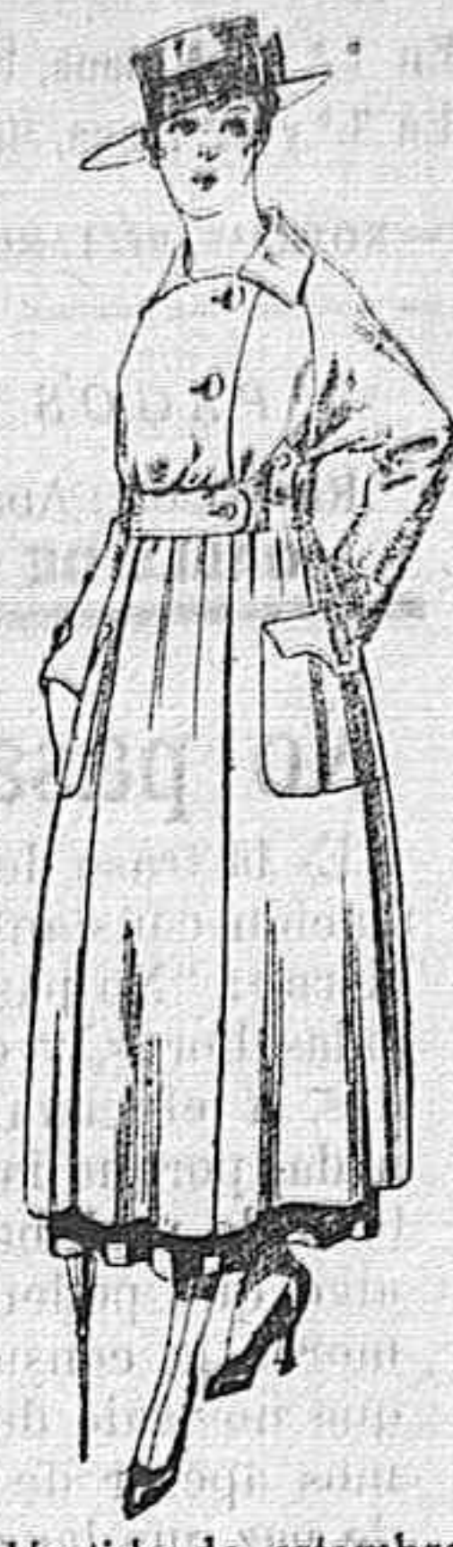
Vestido de estambre negro, azul y colores bordado. De peseta 64 á 75