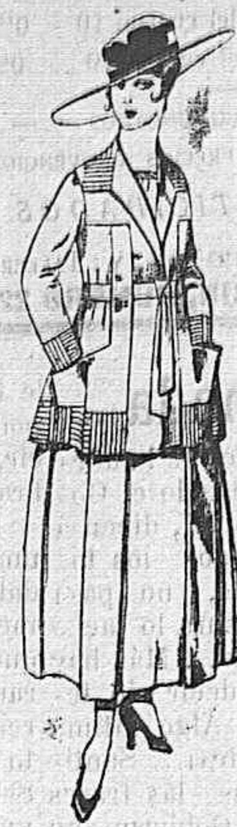
Trajes de lanilla negro, azul, y color, bordado, á pesetas 90.