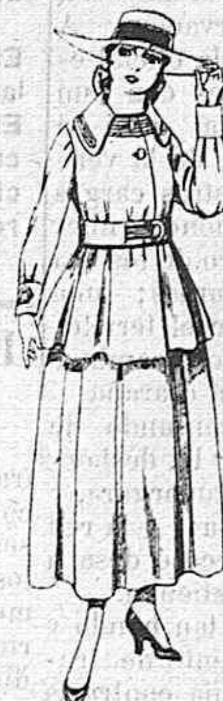
Trajes de lanilla negra, azul y color, para jovencitas de 13 á 16 años.