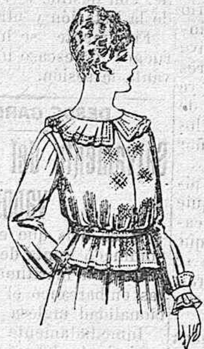
Blusa de crespón ó seda, en negro, azul y color. A ptas. 33.