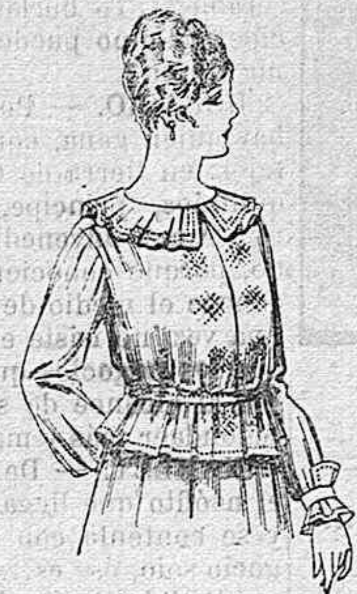
Blusa de crepón ó seda, en negro, azul y color. A ptas. 33.