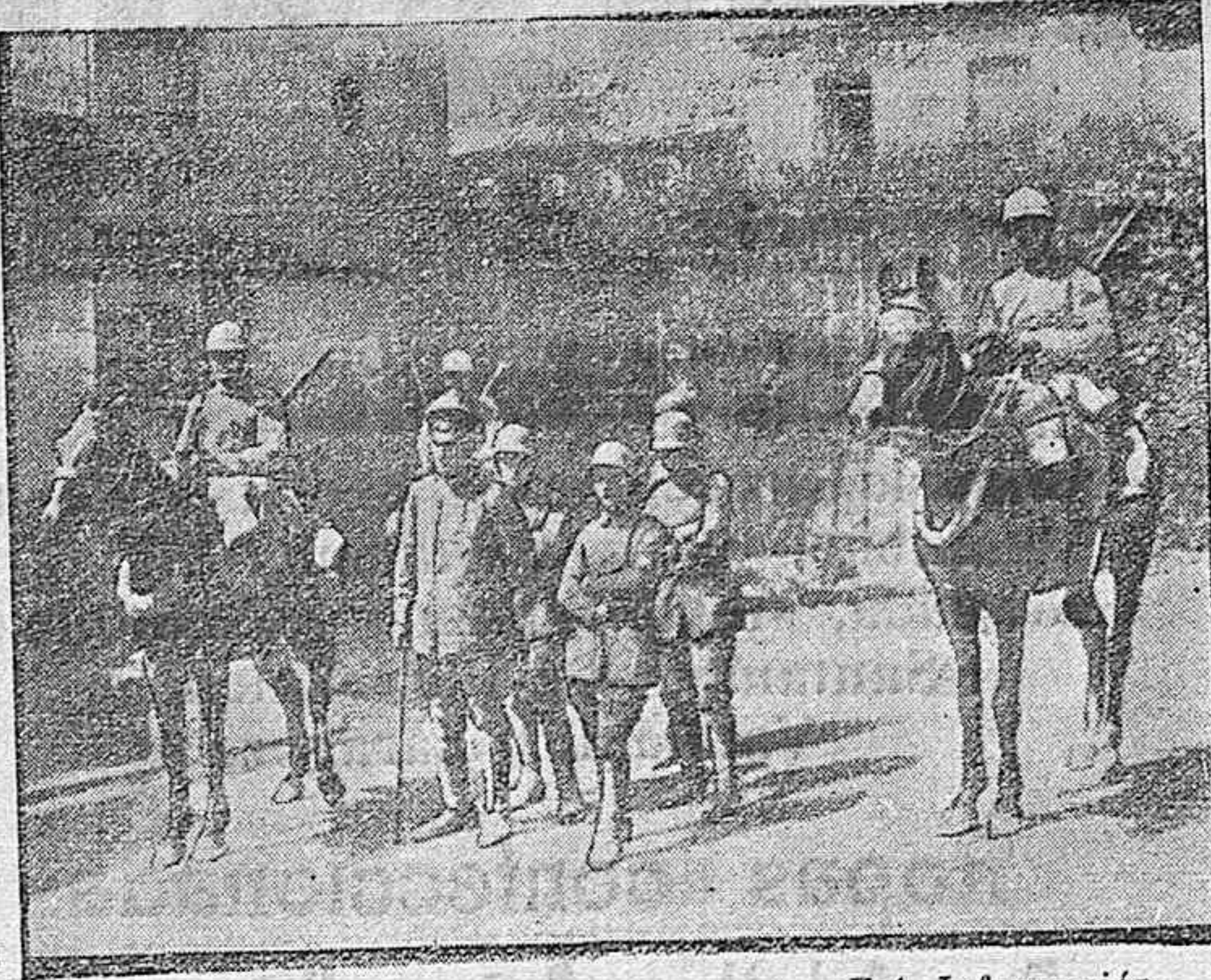
Oficiales alemanes prisioneros