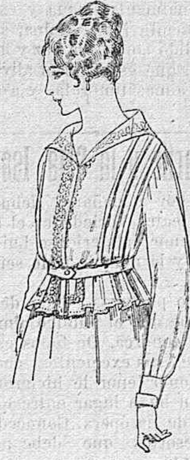
Blusa de voile blanco, bordados blancos, rosa ó azul. A ptas. 9