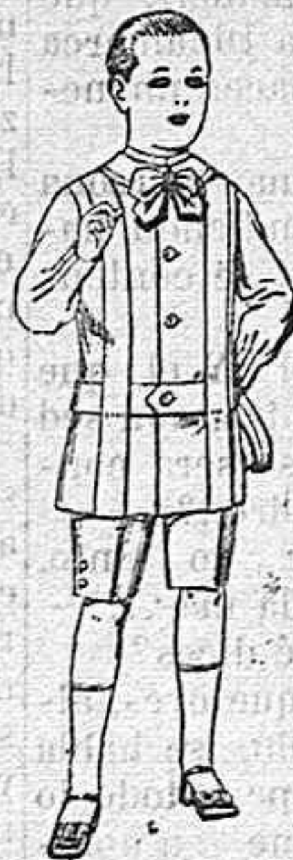
Trajes de lanilla, melton, etc. para niños de 4 á 8 años. De ptas. 16 á 33.