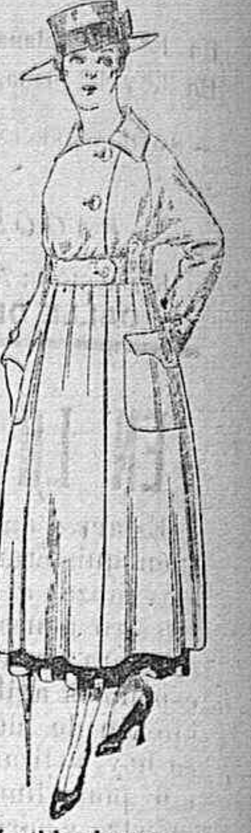
Vestido de estambre negro, azul y colores bordado. De peseta 64 á 75