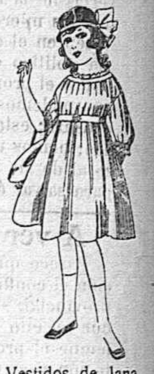
Vestidos de lana, azul, para niñas de 4 á 9 años. De pesetas 22 á 25. Los mismos en voile. De pesetas 10 á 17