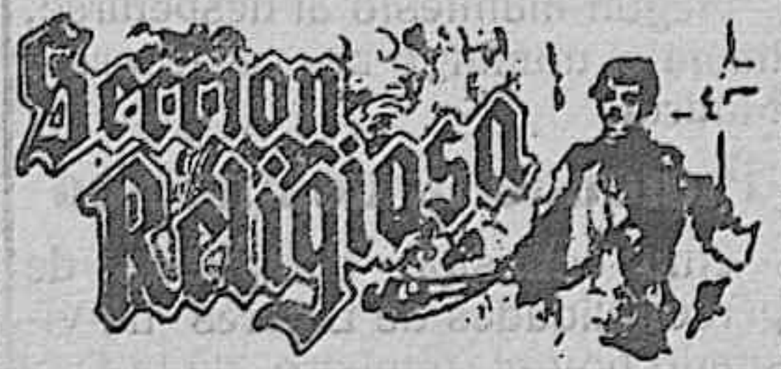
SANTOS PAPA HOY.—Sts. Cami-

Solución a la charada de ayer: ACOMETEDOR.