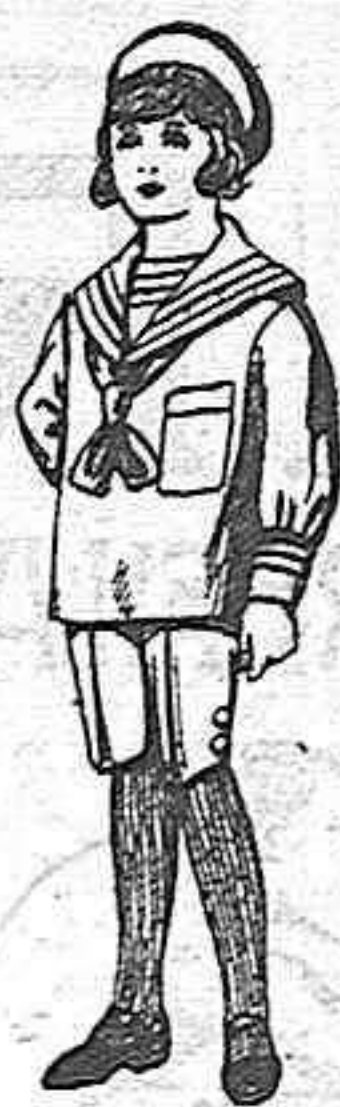
Traje jerga azul, bordado oro en la manga para niños de 4 a 9 años. De ptas 20 a 22,