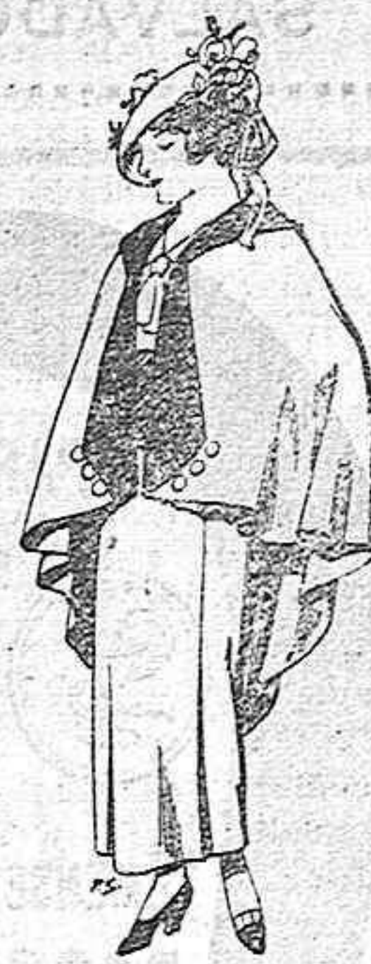
Capas de lana para jovencitas de 13 a 16 años Ptas. 25