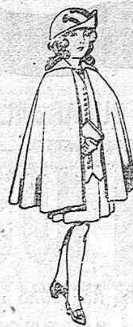
Capas de lana para niñas de 4 a 12 años De ptas. 20 a 22