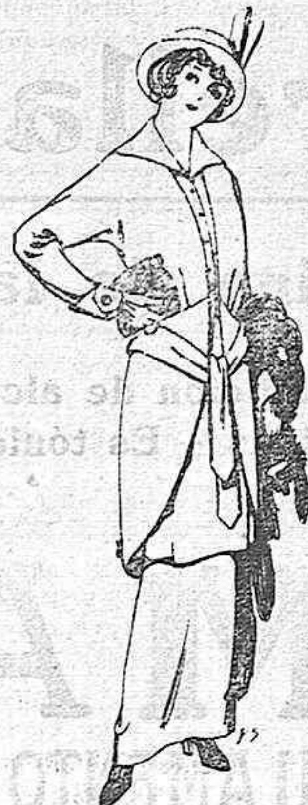
Traje de jerga negra y azul para señora Ptas. 85.