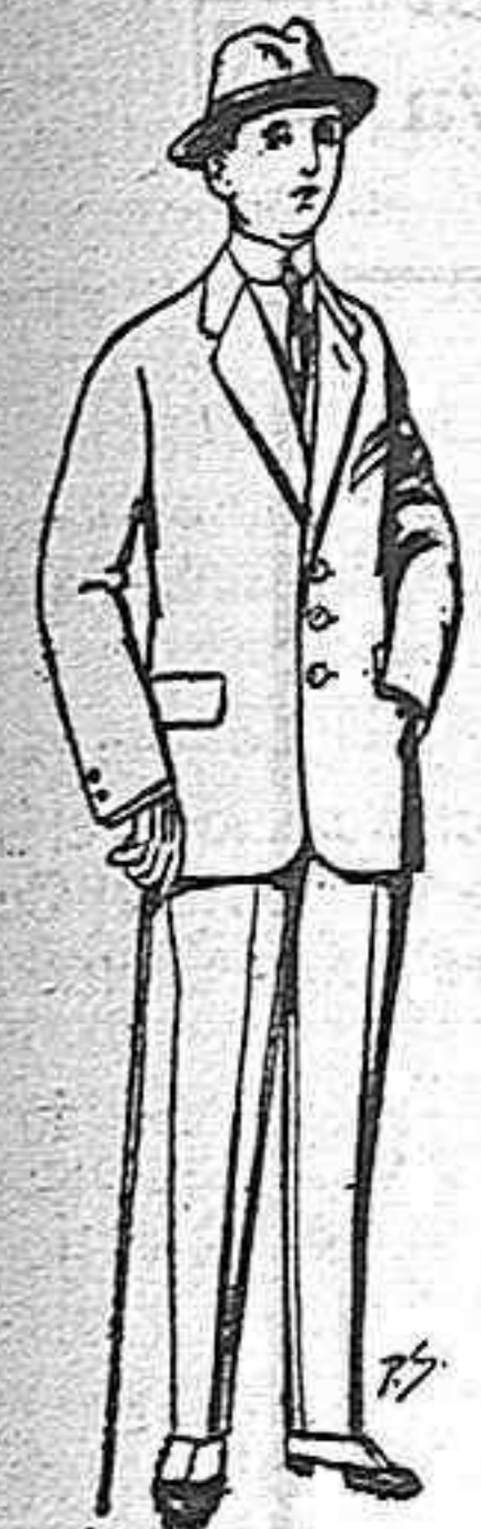
Trajes de patén, vicuña o jerga, para niños de 10 a 16 años De ptas. 10 a 48