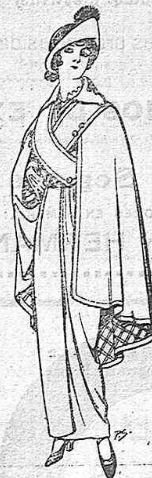
Capas de lana negra para señora Ptas. 16.