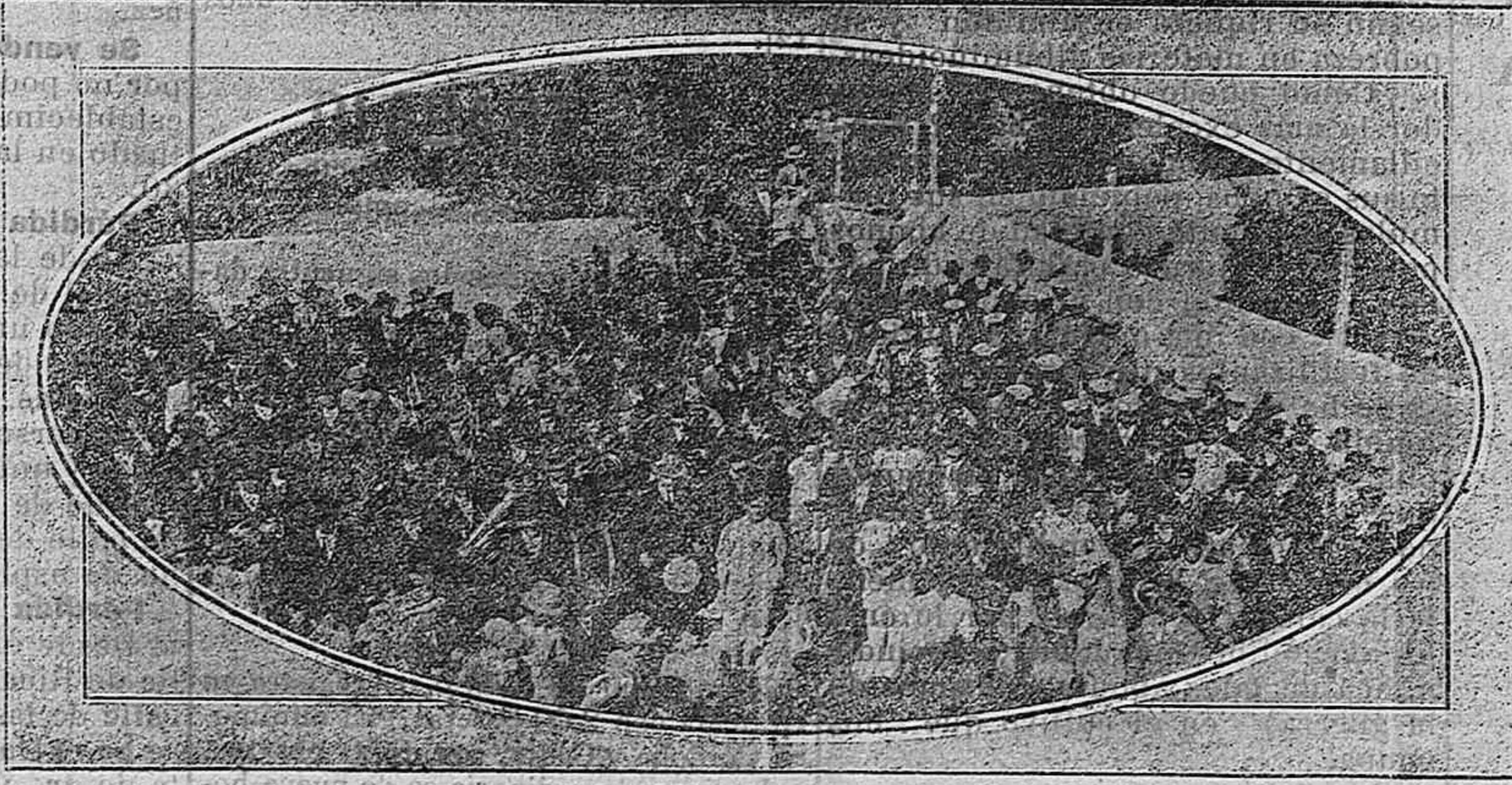
Patio del Colegio

Instincion está situado a 350 metros sobre el nivel del mar, 32 de Lat. N. y O.; 33 Longitud oriental según el meridiano de Madrid, en la ladera septentrional de la Sierra de Gádor, fecundando su término el río Andarax y numerosas fuentes de aguas de variada composición mineralógica. Tiene pequeños montes y depresiones que dan ocasión a una variedad de paisajes pintorescos. La temperatura media invernal es de unos 10° y la estival de 20. Las observaciones de mortalidad acusan un clima muy sano. Dista de Almería próximamente dos horas, el cual tiempo se reducirá considerablemente con el servicio de autos-resultado educativos y de enseñanza. El edificio se ha levantado de planta. Está situado de tal modo que los alumnos hacen vida de campo. Se surte el Colegio de aguas traídas directamente de la sierra. Cuenta con magníficos gabinetes de Geometría, Fisiología, Historia Natural, Agricultura aplicada, Física, Química y con todo el material docente que exige la Pedagogía moderna. La educación moral es la correspondiente a un colegio cuya fundación está inspirada en principios católico-sociales como lo prueban las pensiones establecidas en el mismo.