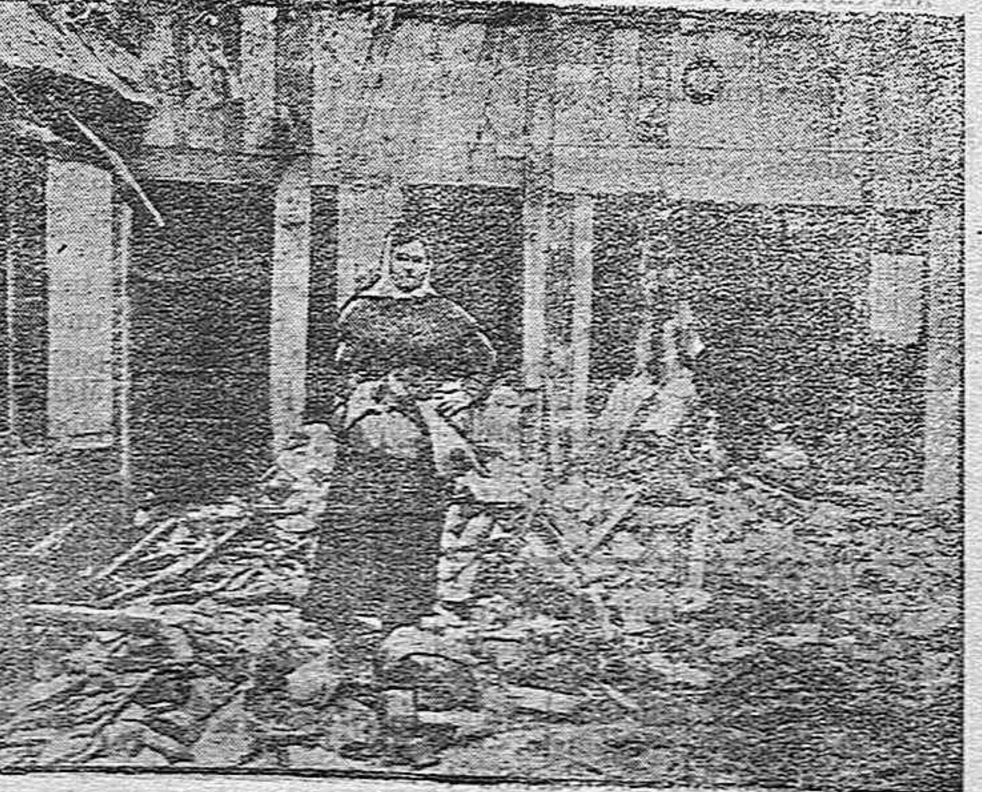
En una casa arruinada en Noyon