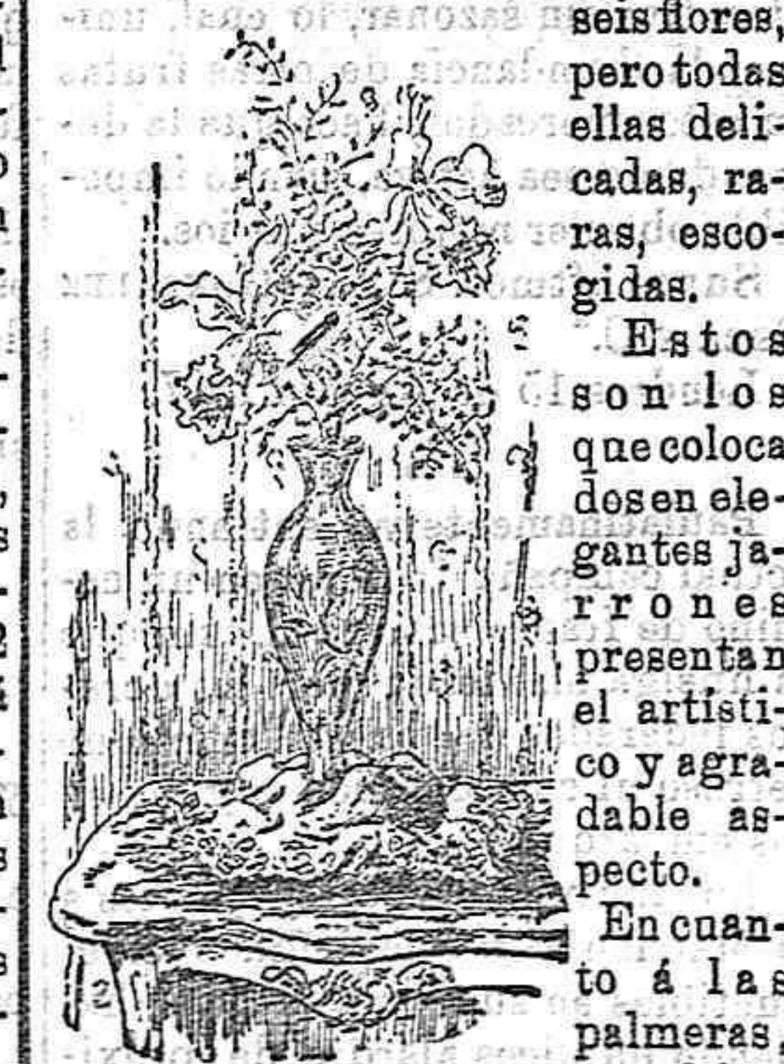
JARRÓN CON FLORES.

Pero no se busca en ellas la profusión, sino lo escogido de su clase; á la cantidad se sobrepone la calidad y así al gran «bouquet», de muchas rosas y flores vulgares, se prefiere un ramo negligente-mente formado, natural, sencillo, en el que no hay más que cinco ó seis flores.