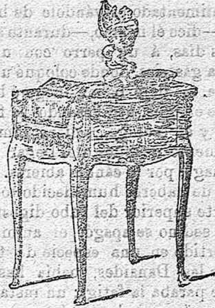
LA MESA FAVORITA.

Sobre una de ellas, deposita siempre sus objetos preferidos y usuales, su libro, su flor, su cesti-