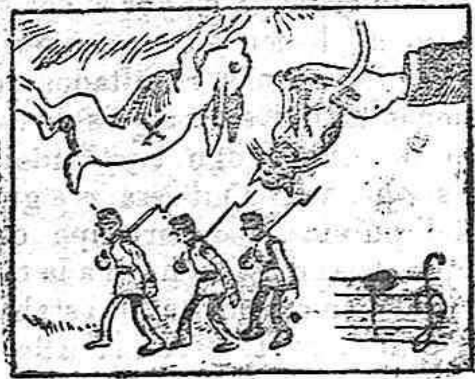
(La solución mañana).