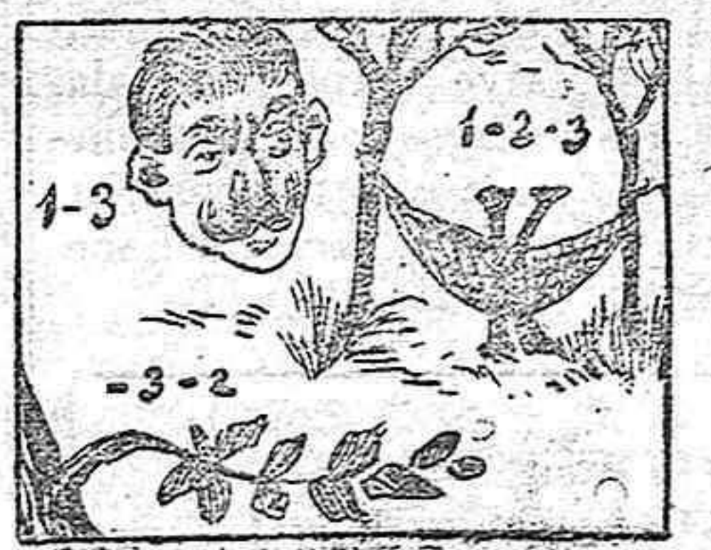
(La solución mañana).