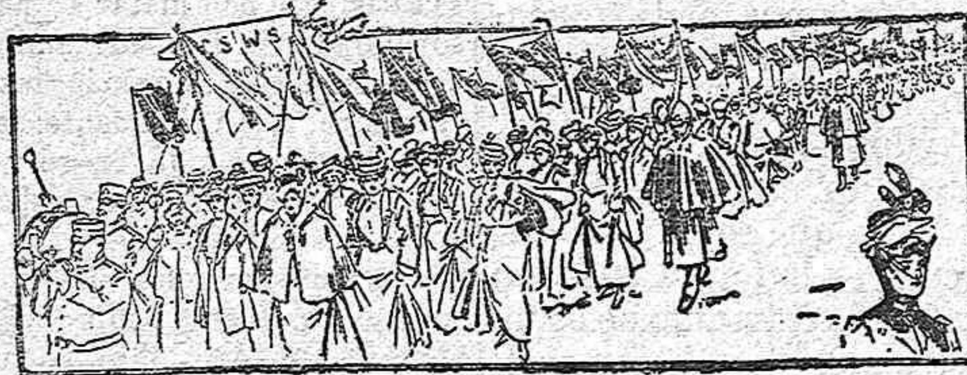
Una manifestación de sufraguitas.

Bien puede asegurarse que la fiebre feminista que hoy se deja sentir con más ó menos intensidad en la mayor parte de los pueblos de Europa, en ninguno se manifiesta con tanta fuerza ni tan tumultuosamente como Inglaterra, donde ya son tan frecuentes los mítines, las manifestaciones y los escándalos promovidos por las partidarias del derecho de sufragio para las mujeres, que hoy se tiene en Londres como la cosa más natural del mundo encontrarse con una manifestación de sufraguitas, ó ver á un grupo de estas en los alrededores del Parlamento pidiendo á gritos el voto para las mujeres.