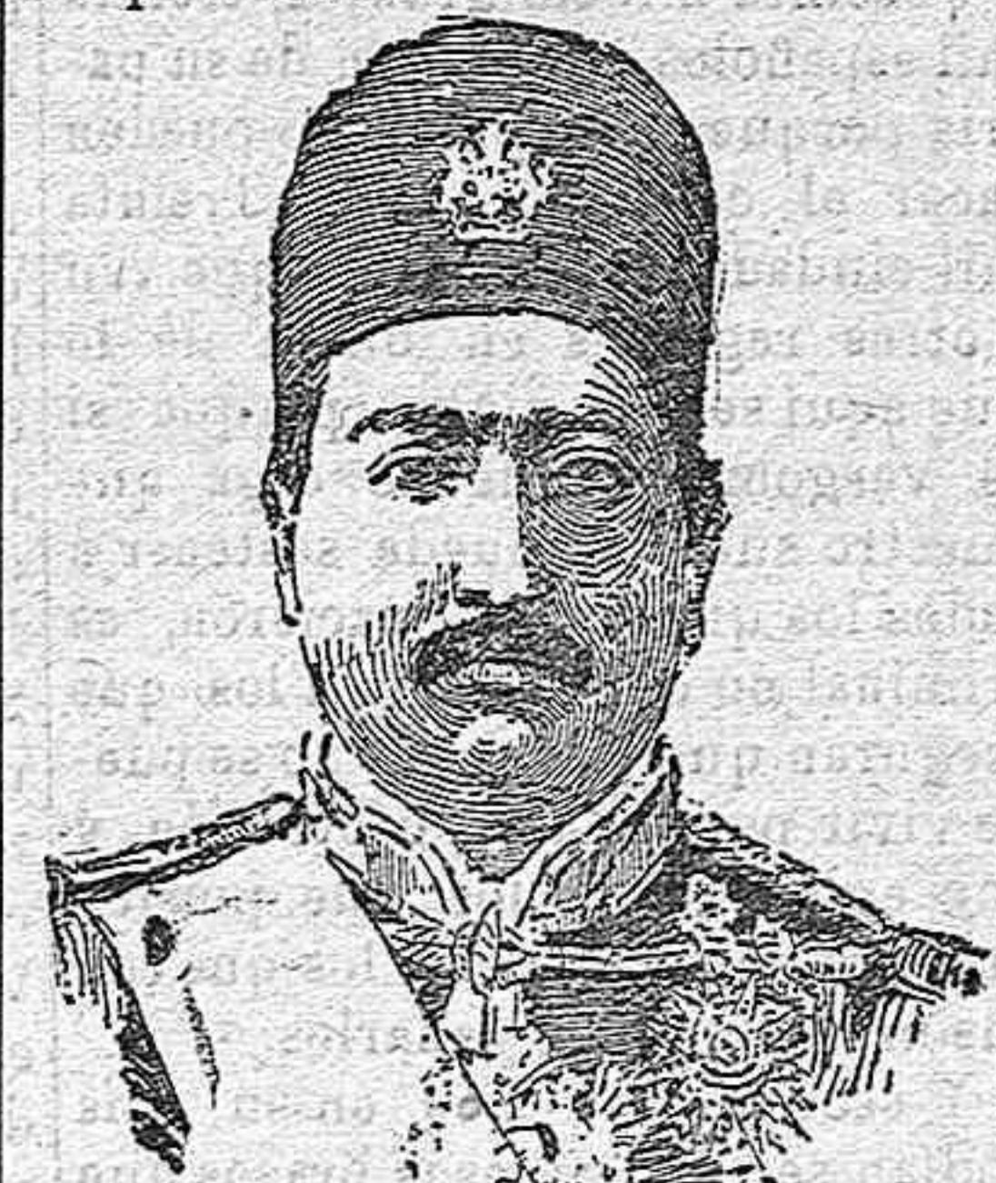
MOHAMMED ALI MIRZA, NUEVO SHA DE PERSIA.

Ahora, al fallecimiento de éste, es de creer que no se repetirán aquellas lamentables escenas y que el sucesor de Mozaffer, su hijo Mohammed-Ali-Mirza, pase á ocupar el trono de Persia tan solemne como pacíficamente.