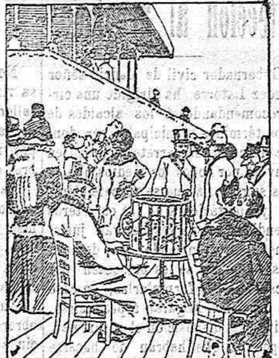
ORIGINAL ASPECTO DE UNA DE LAS PLANCHES, EN LA ÚLTIMA CARRERA DE OTOÑO.

Estos días atrás se han celebrado en el hipódromo de Auteuil, de París, las últimas carreras de caballos de la temporada de Otoño. Como es de suponer dados los temporales de lluvias y vientos que reinan desde hace más de quince días en toda Francia, esas carreras se celebraron bajo un cielo anublado y con una temperatura bajo cero.