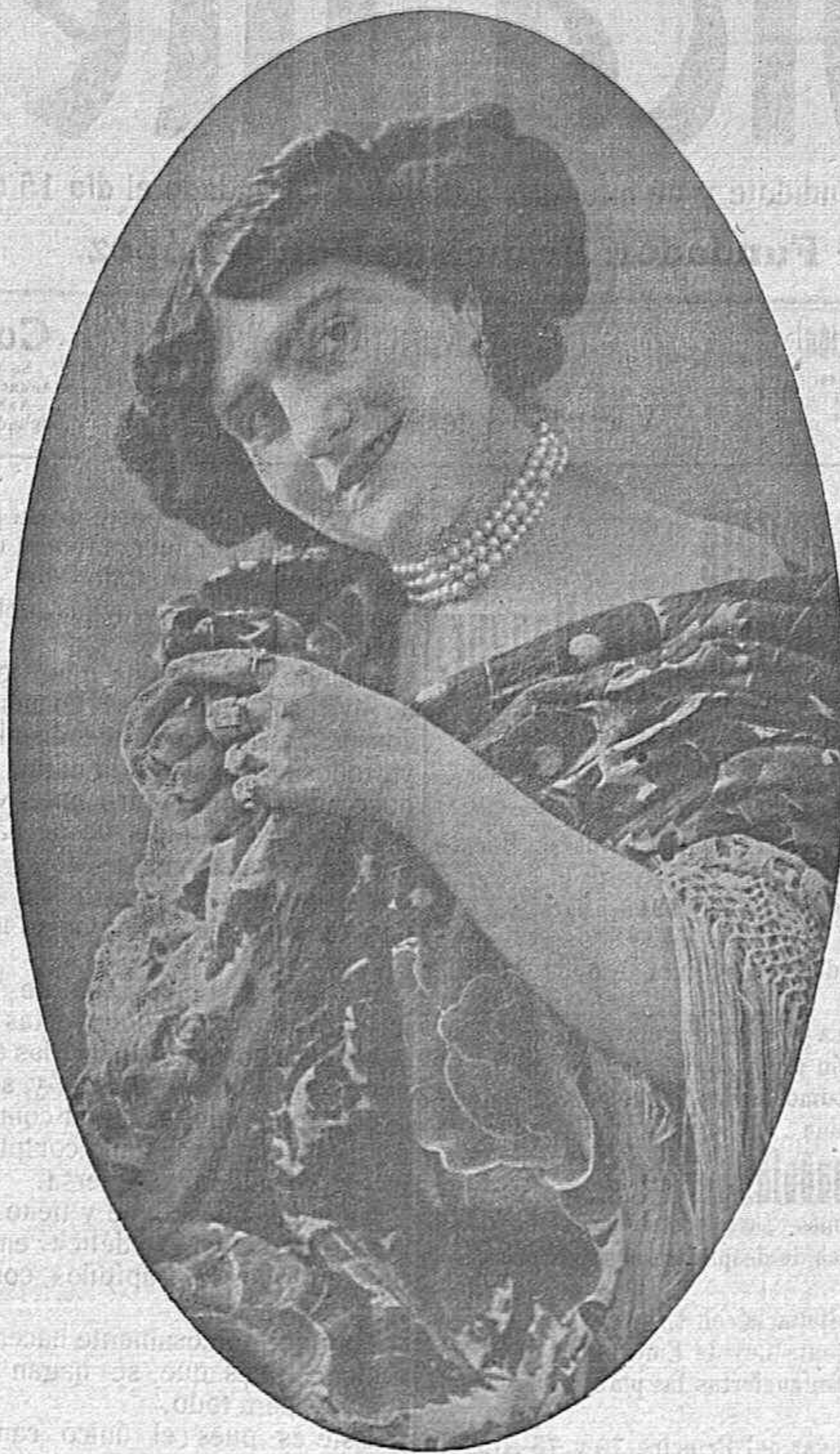
Distinguida artista de variedades que actúa en Variedades con extraordinario éxito.