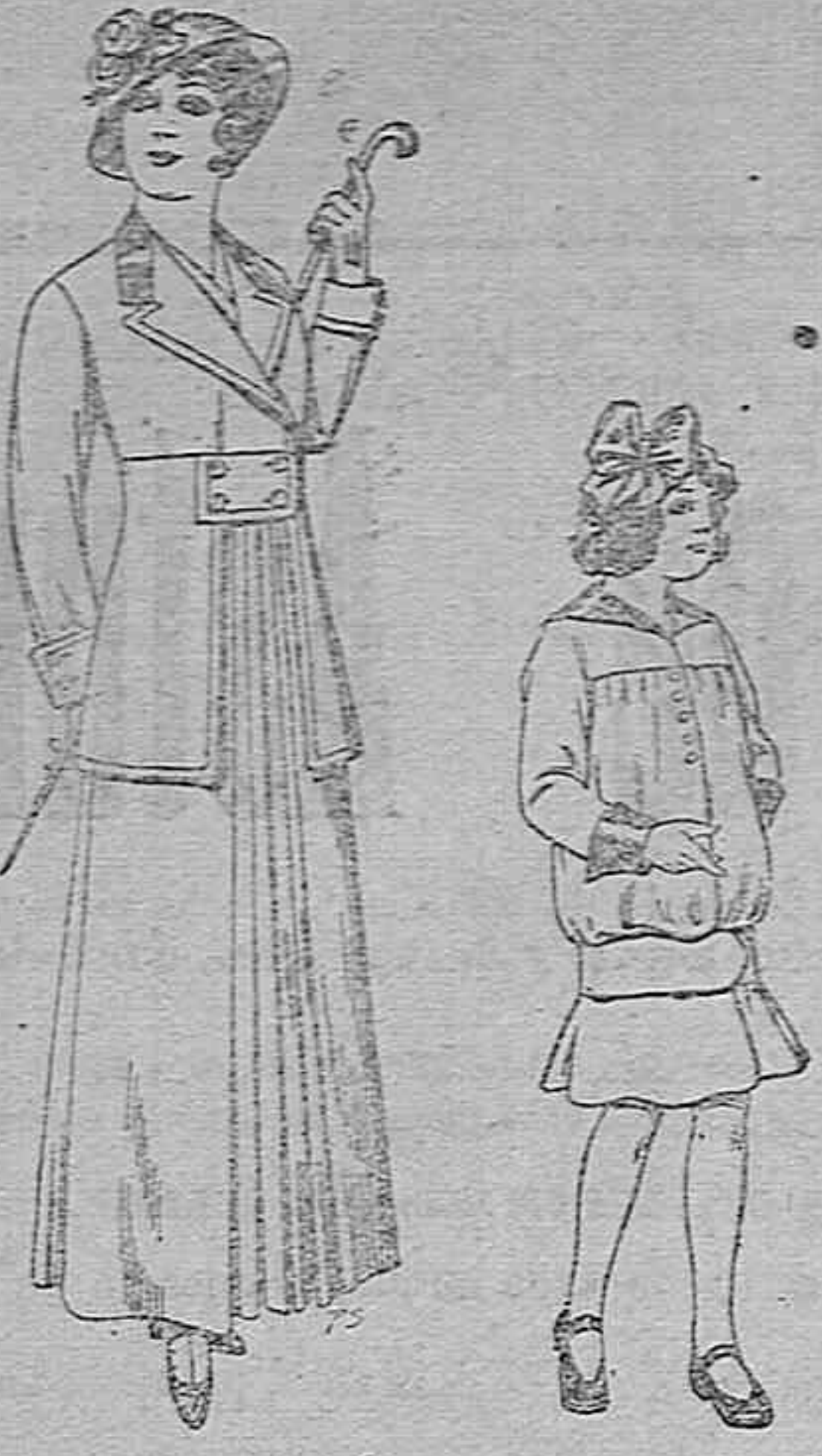
Tras seje ne-enal a gra azul y color pa- ra señora. A pis. 70 Vesidos dela- nilla para ni- ños de 4 a 12 años. De pese- tas 12 a 20