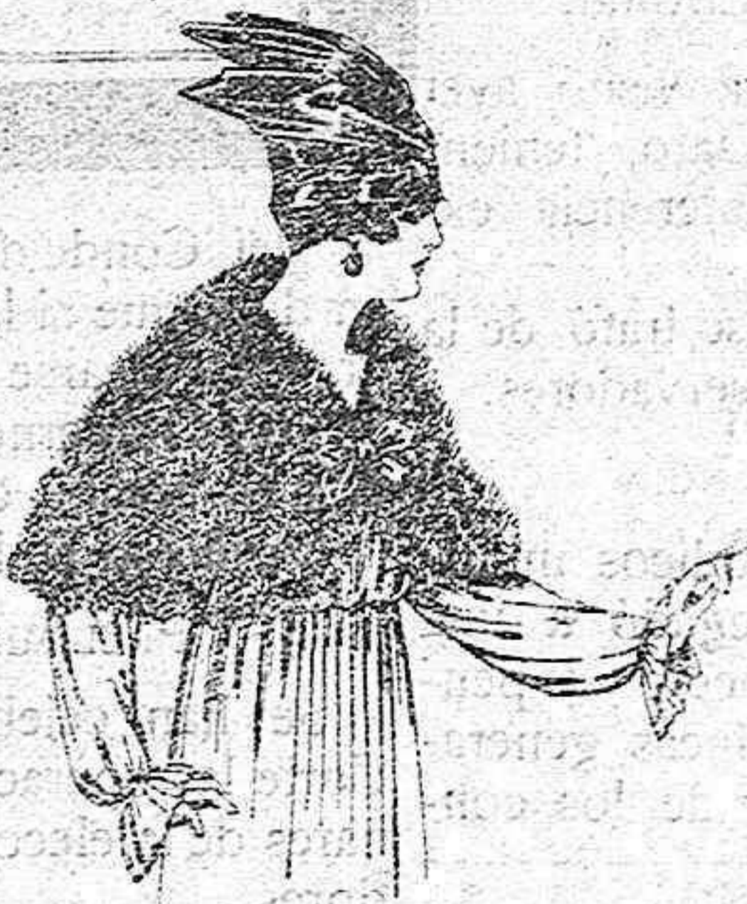
Capelinas de marabú adornadas, con cinta y forro de seda. de ptas. 32 a 40