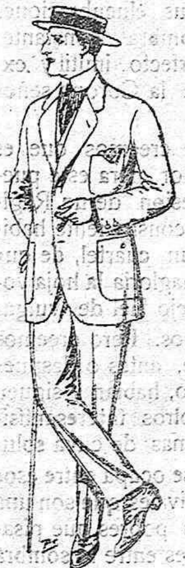
Trajes de drill crudo, kaki o listado. de ptas 17 a 48 El mismo modelo en estambre «Fresco». de ptas. 40 a 80