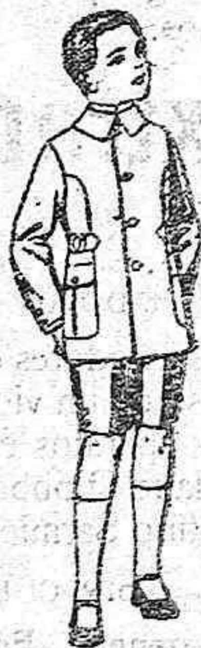
Trajes Sport, de lanilla, estambre, melton, etc. para niños de 4 a 9 años de ptas. 25 a 40

Ropas confeccionadas para Caballero, Señora, Niño y Niña