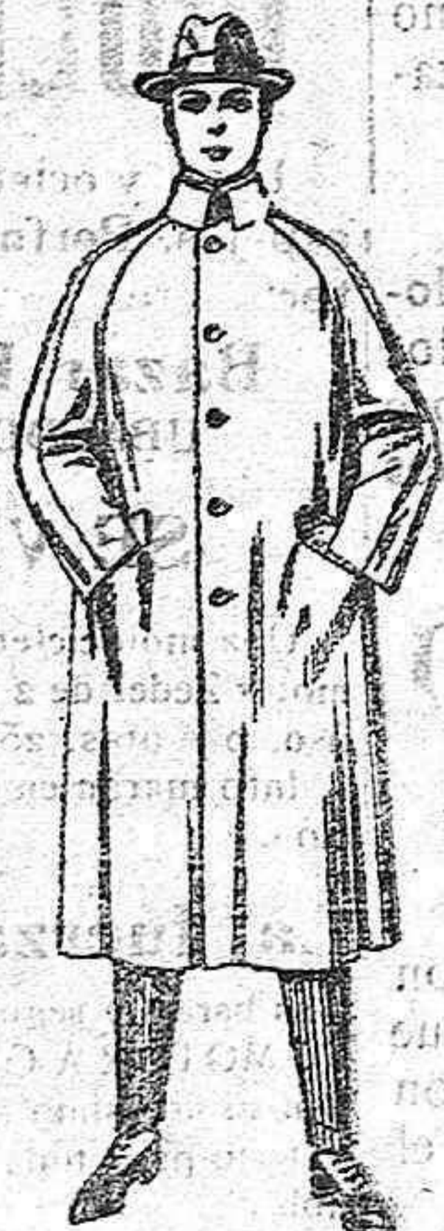
Cabanes de patén, cheviot o cover. de ptas. 103 a 115