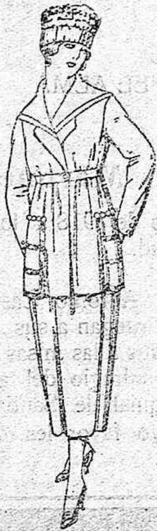
Trajes de sarga inglesa, lanilla, etc., en negro, azul y color. de ptas. 110 a 135

SUCURSALES: Madrid, Barcelona, Alicante, Bilbao, Cádiz, Cartagena, Gijón, Granada, Málaga, Palma de Mallorca, Santander, Sevilla, Valencia, Valladolid, Zaragoza.