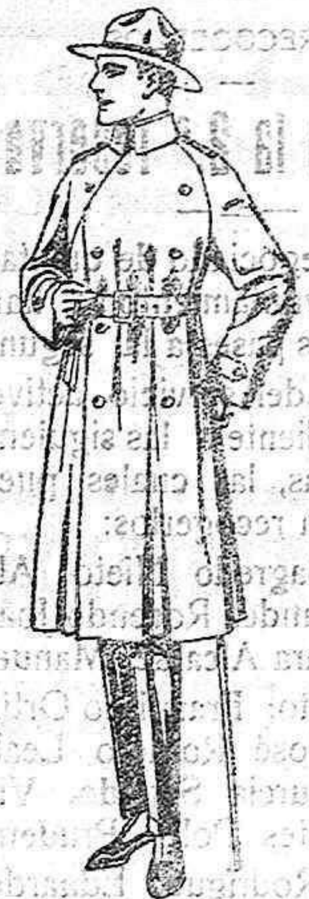
Gabanes impermeabilizados con cuminó American trench coat de ptas. 180 a 360