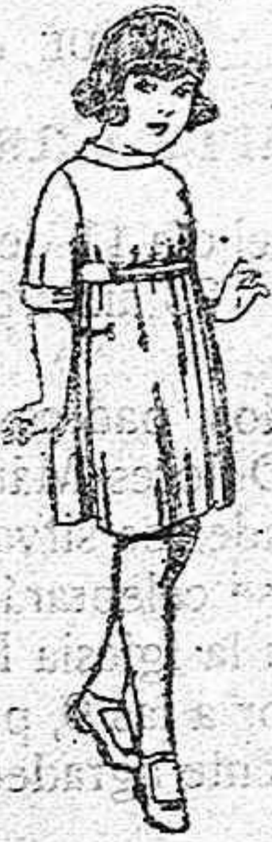
Vestidos de sarga inglesa azul, adornos sarga blanca, para niñas de 4 a nueve años, de pesetas 36 a 40