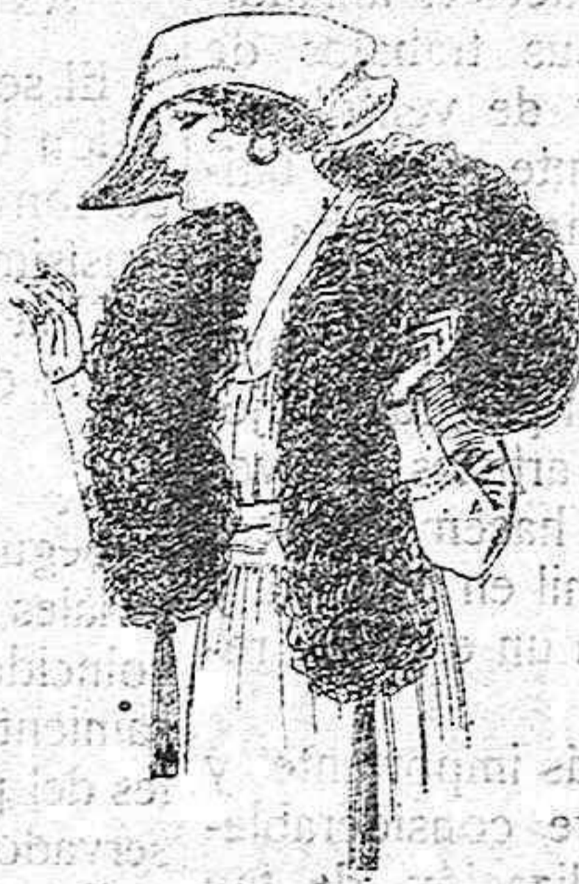
Bca de pluma de avestruz, en negro, blanco, café y gris, etc. de ptas. 32 a 70