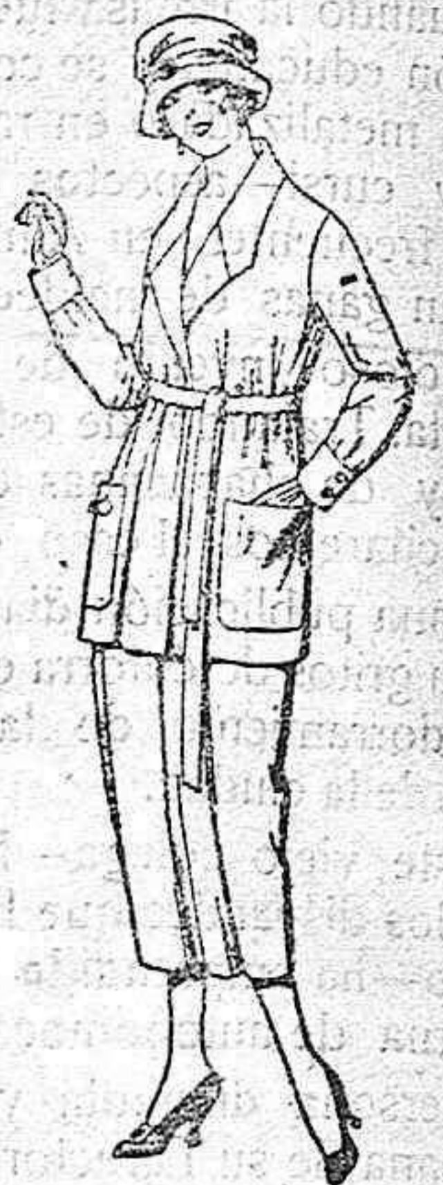
Trajes de g. bardina, es tanabr, lanilla, etc., en negro, azul y color, de ptas. 103 a 115.