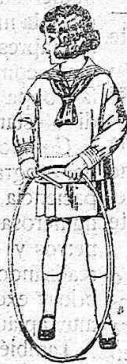
Trajes modelo «Marinera inglesa» de estambre o jerga azul para niños de 4 a 9 años de pesetas 30 a 42