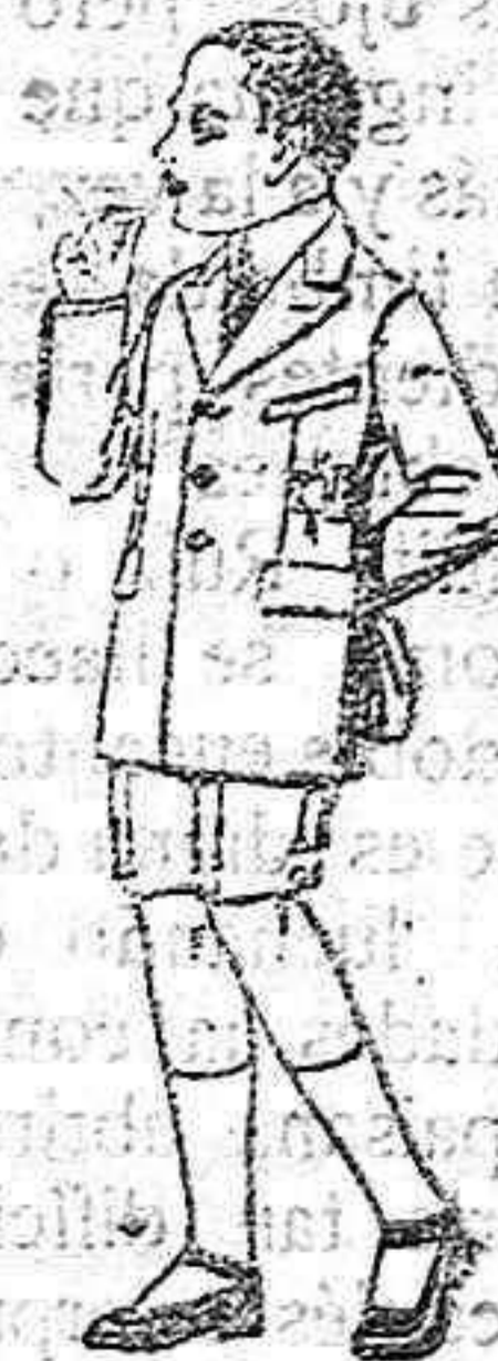
Trajes modelos Sport, de lanilla, estambre, melton, etc., para niños de 7 a 12 años. de ptas 28 a 50.

Ventas al contado Pídase el catálogo general.