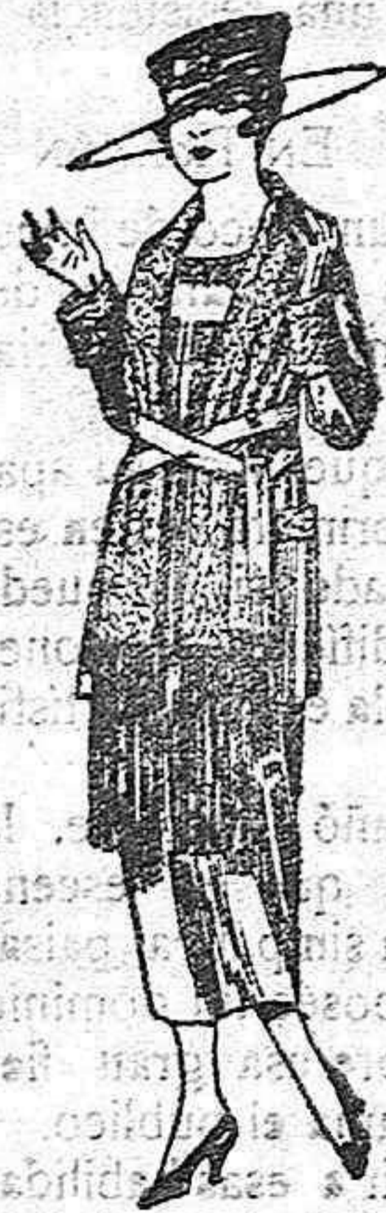
Paletots de punto de lana-cuello bufanda. de ptas. 50 a 58

Camisería, Géneros de punto, Corbatería Zapatería, Guantería, Sombrerería, Paraguas, Bastones, Pelotería y Artículos de Viaje.