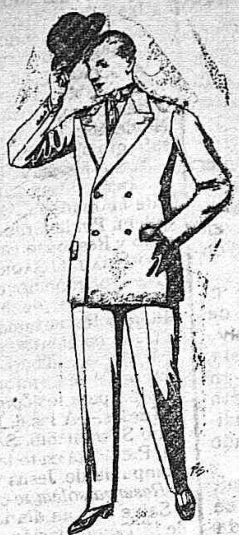
Trajes de chevot, patén, et- cetera. De pesetas 27 a 80. Trajes de vicuña o jerga. De pesetas 30 a 85. Los mismos, a med. da. De ptas. 65 a 135.