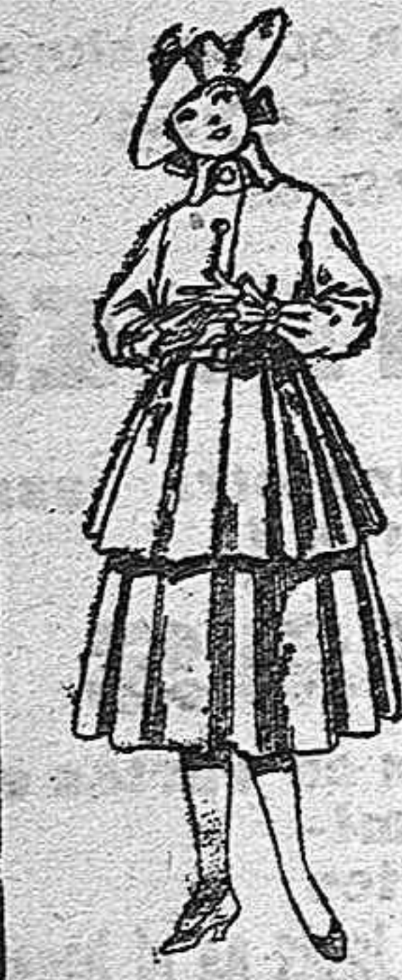
Trajes de lana, pa- ra jovencitas de 12 a 15 años, de pesetas, 45 a 55