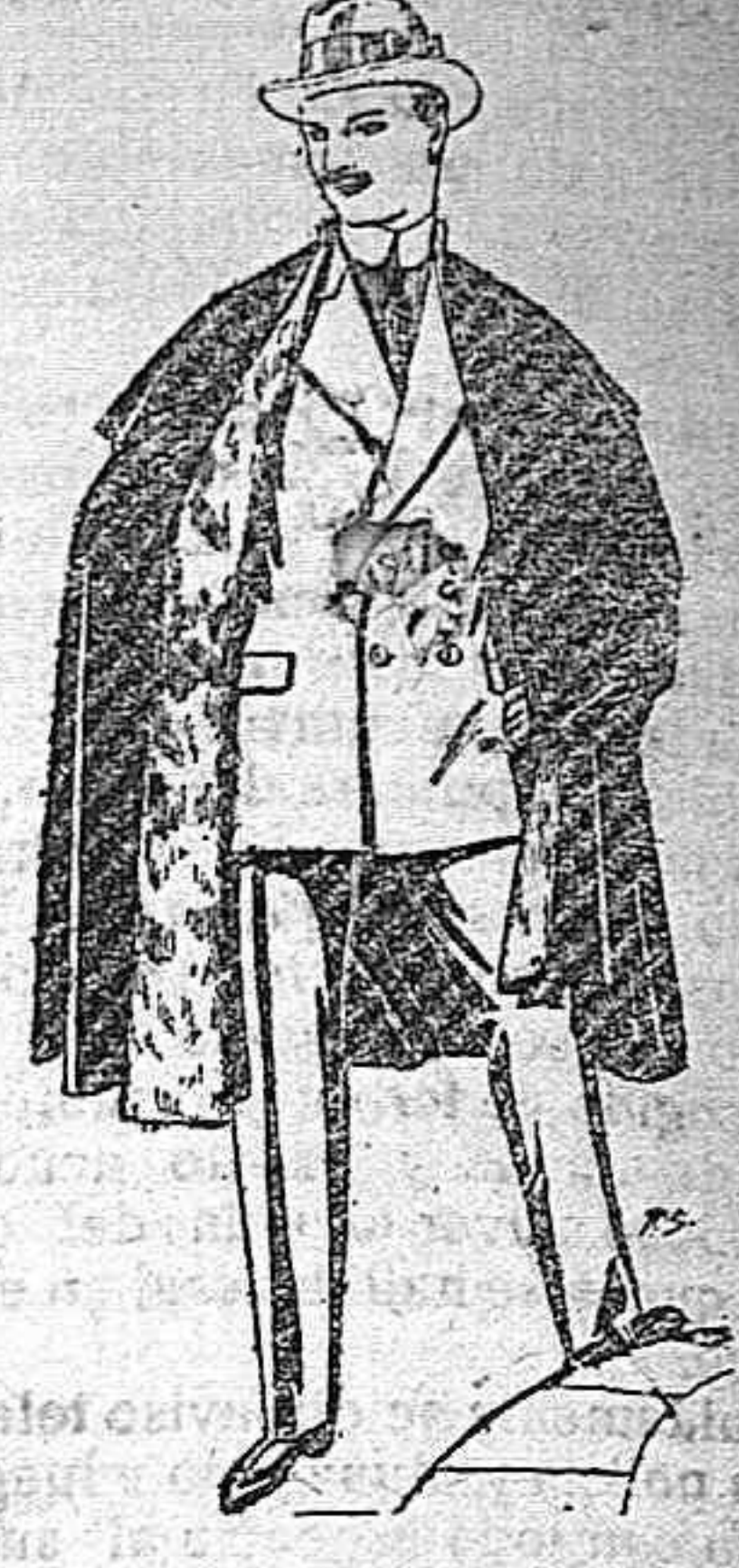
Capas (enteras) de paños de Béjar y Tarasa, embozos de peluche, terciopelo, astrakán a escocés. De pesetas 35 a 115