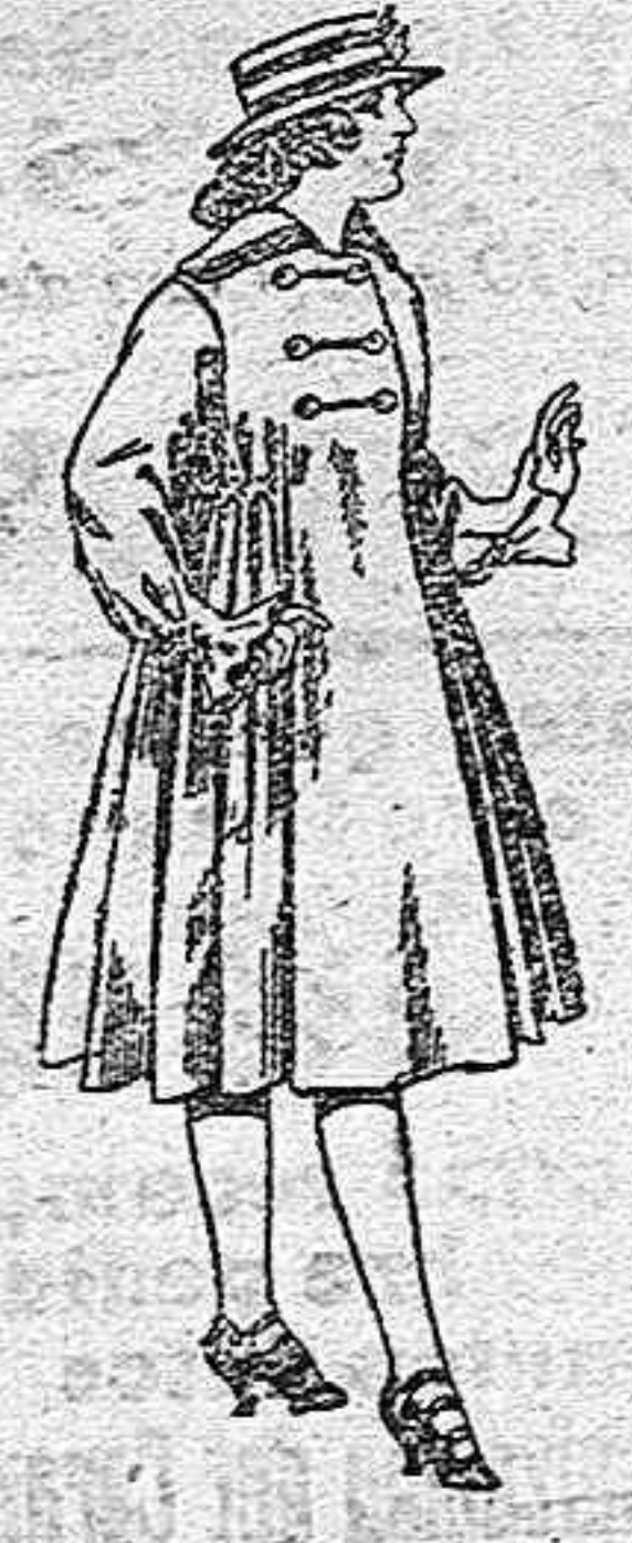
Abrigos de patén para jovencitas de 11 a 15 años, de pesetas, 35 a 50