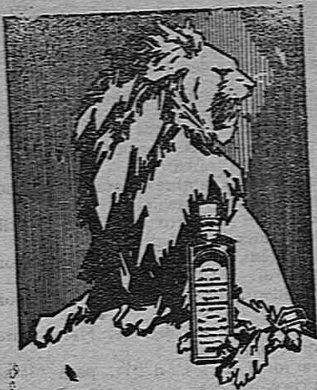
TETRADINAMO. MEDICO RECONSTITUYENTE EN SU DOZ FORMAS: ELUIR E INYECTABLE: VIGORIZA A LOS DEBILES, REAJUSTA A LOS VIEJOS

labor que hay que realizar en España. En efecto, la obra de un Mapa de la composición mecánica de los suelos españoles sería una de las más útiles que se podrían realizar para el progreso de la agricultura, y por ella deberían interesarse tanto el Estado como las entidades particulares cuya actividad se relaciona con la explotación del suelo.