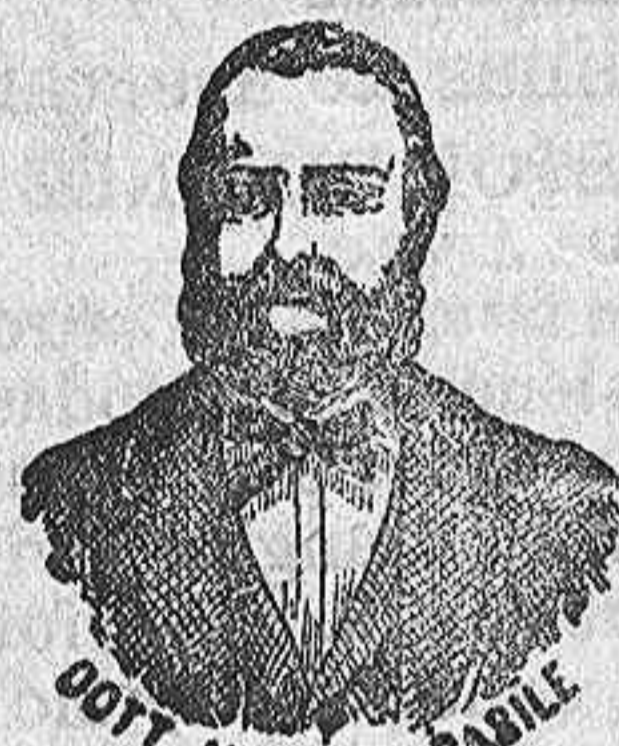
DR. NICOLA CASILE

han logrado que el Dr. Casile de Nápoles descubriera los milagrosos medicamentos que curan infaliblemente la tisis en cualquiera de sus periodos y todas las enfermedades del estómago. A la más pequeña manifestación de un resfriado, tos, catarro, bronquitis, gripe, asma (sufocacion), expectoracion y de cualquier enfermedad del pecho, tomar inmediatamente las PERLAS CASILE, que no solo curan infaliblemente estas enfermedades, sino que se tendrá la completa seguridad de no encontrar otras mucho más graves. Siguiendo este método se podrá decir no mas tisis. Si por desgracia no se hubiera seguido este tratamiento y por desgracia cualquier persona se encontrara atacada de tisis, no tiene que apurararse porque gracias á los constantes estudios hemos podido encontrar los renombrados Confitos Casile que asociados á las Perlas con basen con eficacia la tisis en cualquiera de sus periodos.