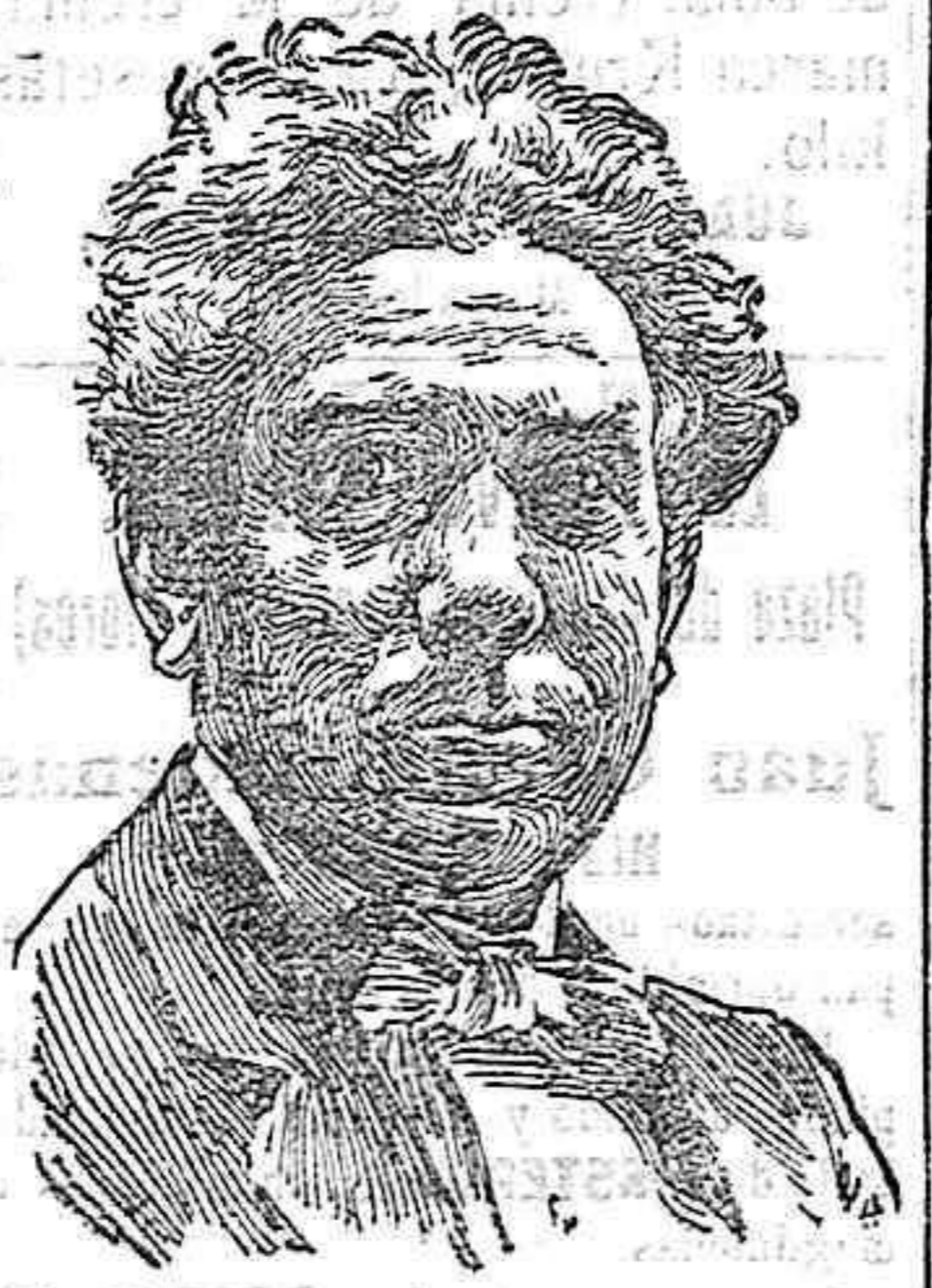
El maestro Vives.

El éxito obtenido por Chapí y Vives en la alta cumbre del coliseo de la plaza de Oriente, y la acogida que público y empresario han dispensado á sus obras, deben servir de acicate á los compositores que tienen bien probado que para su inspiración, rica y lozana, no ofrece dificultades la empresa de dotar al arte musical español de producciones que al par que eviten se escapen al extranjero torrentes de oro, en pago de derechos de representación, lleven á cabo la creación sólida y eterna de la ópera española. La prueba está hecha, y sus resultados son por demás halagüeños.