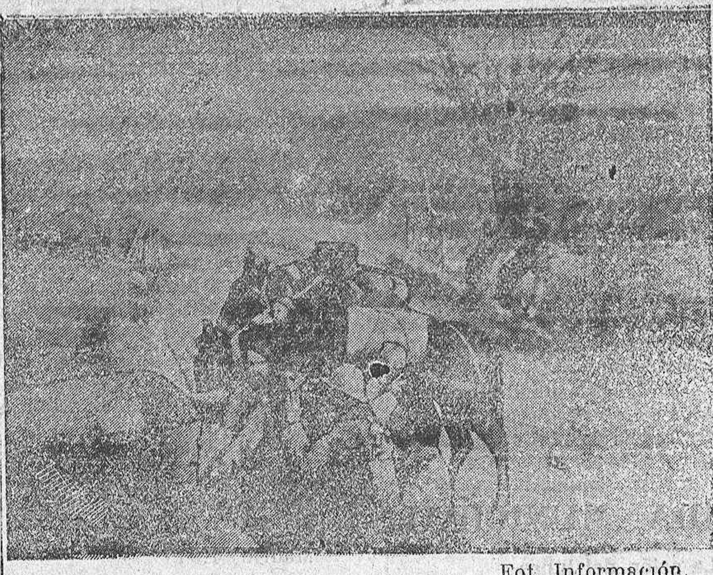
En el frente francés.—Haciendo aguadas