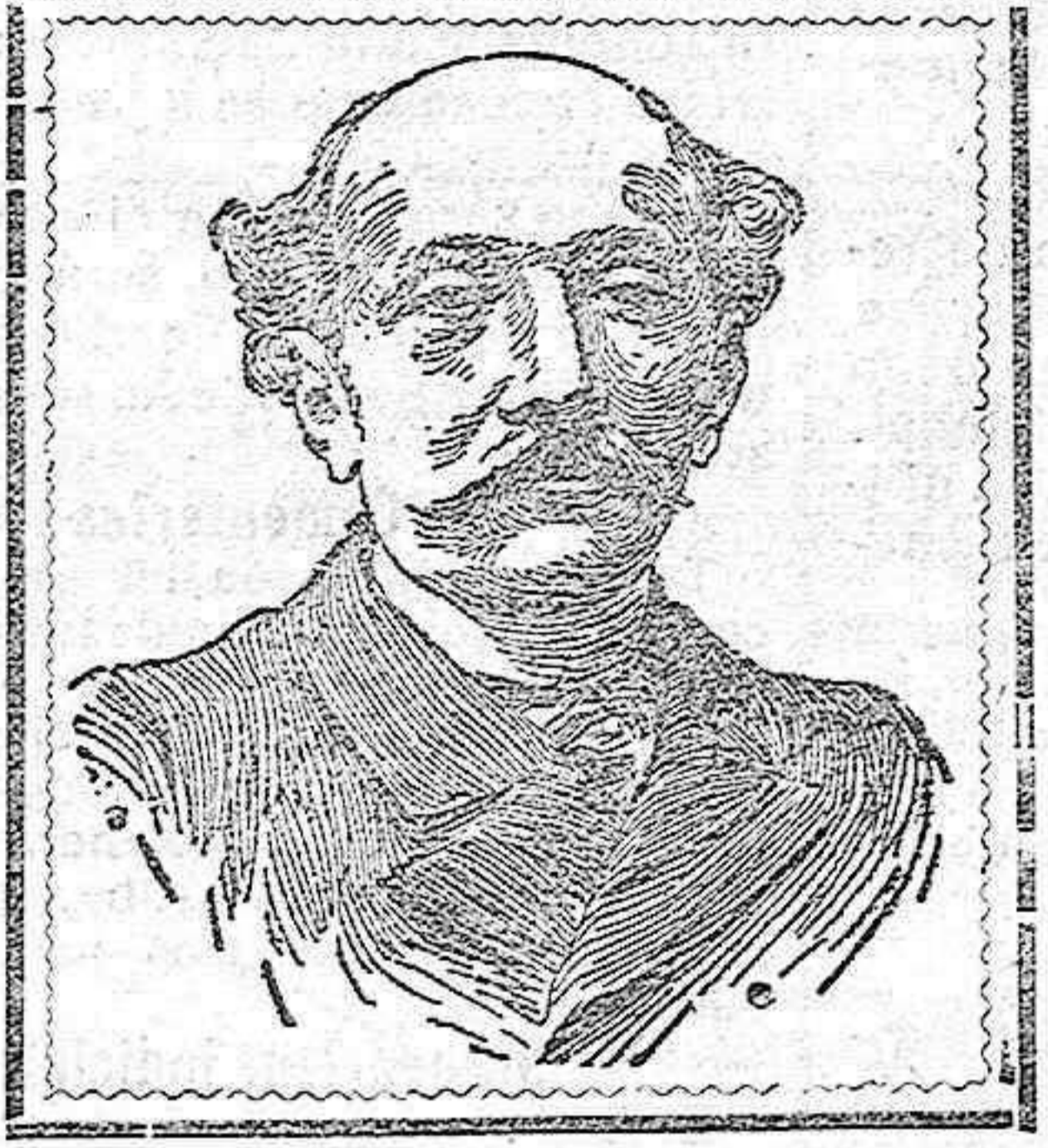
Excelentísimo Señor Don Eduardo Dato Irujo, muerto en Madrid el martes último, víctima de traidora agresión.

Después del atentado. Madrid, 8.—1'33 madrugada (Re-