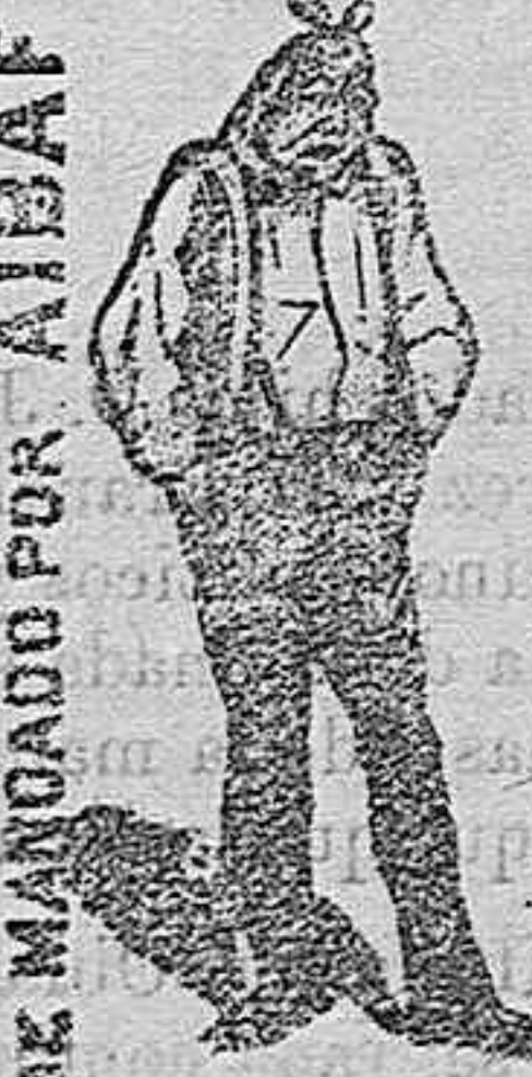
SE MENCIONA POR AIBAF