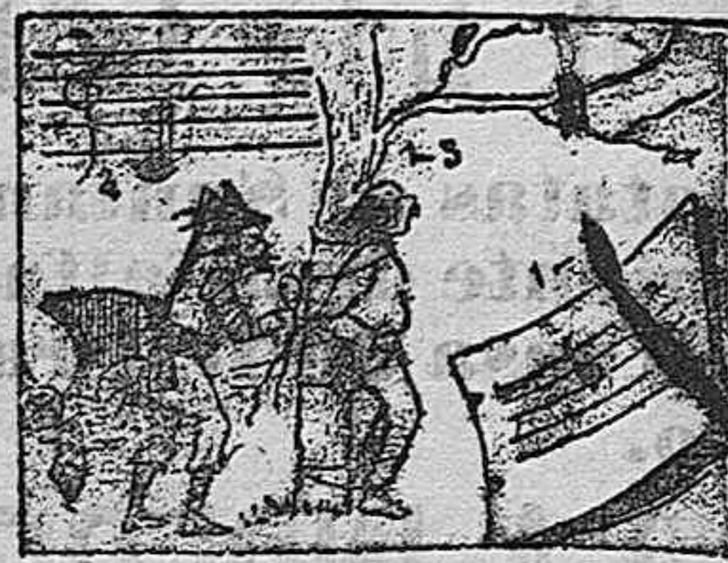
(La solución mañana).