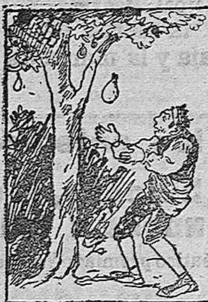
(La solución mañana.)