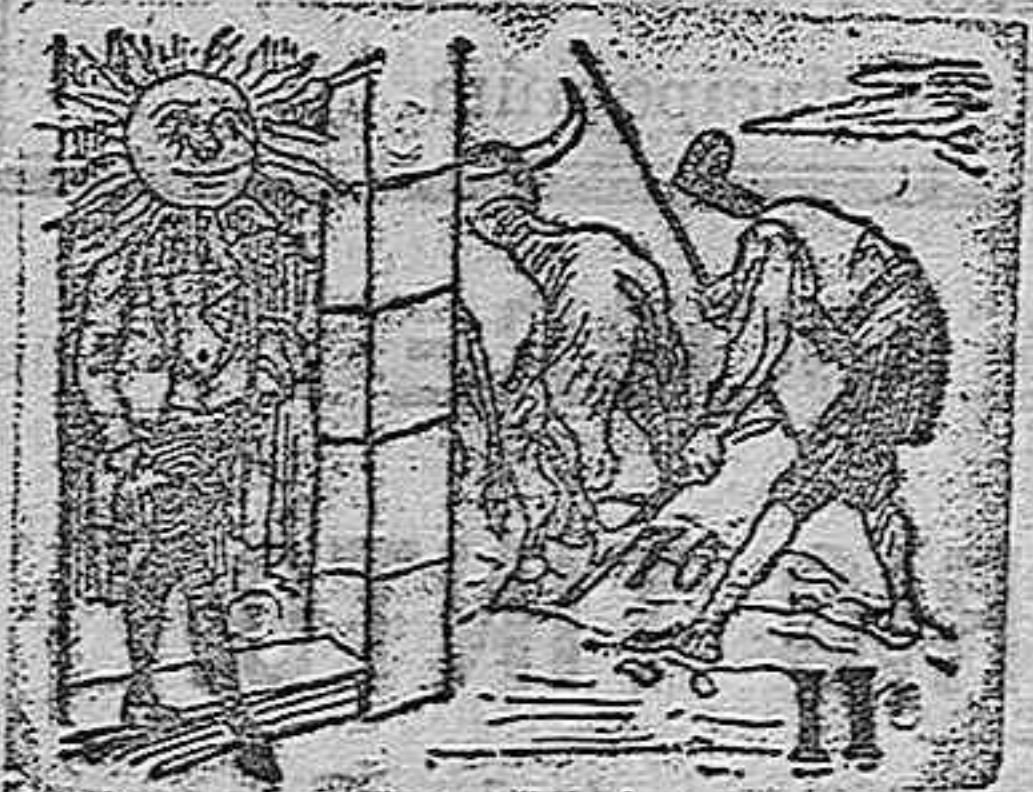
(La solución mañana).