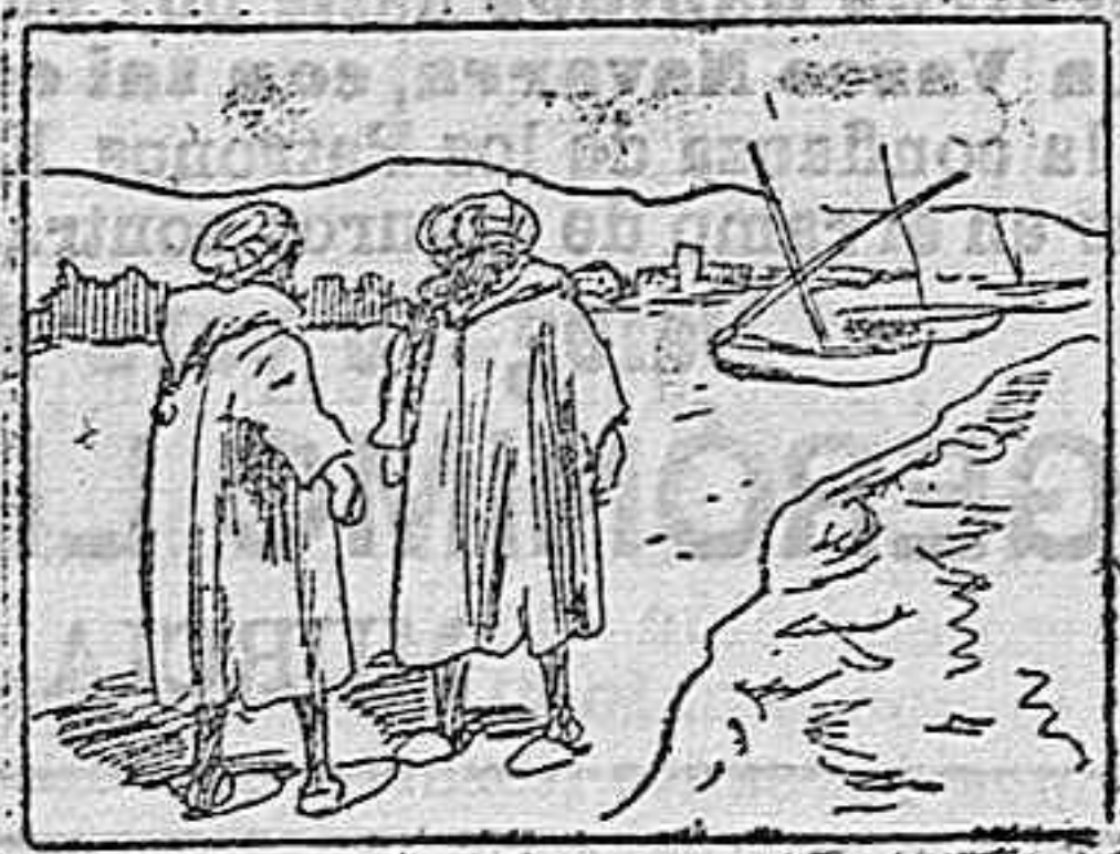
(La solución mañana).