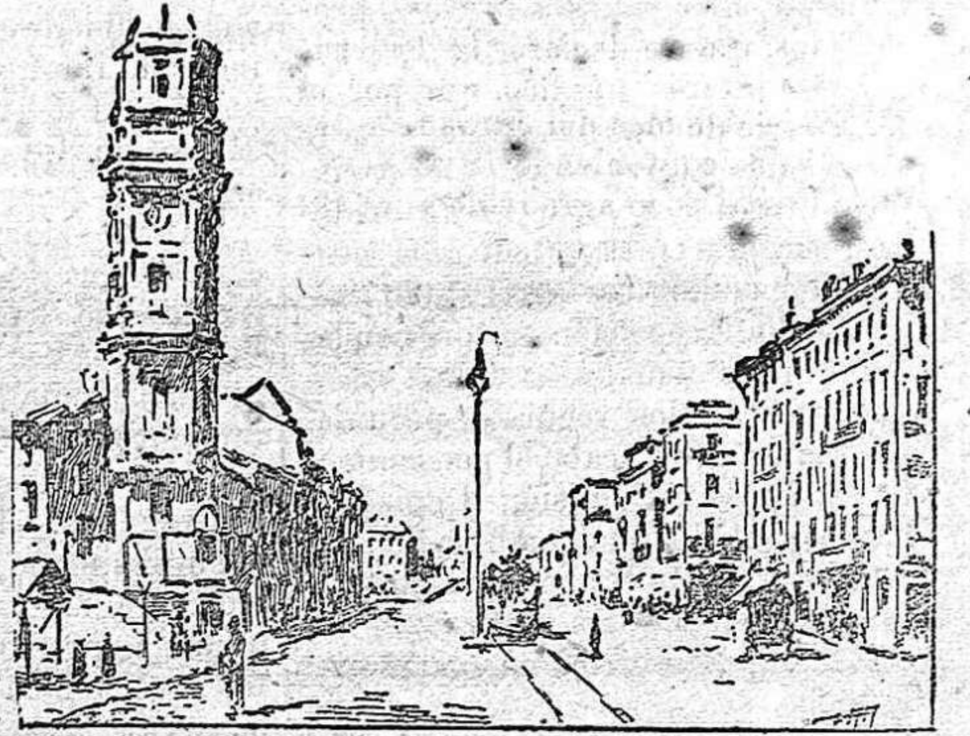
LA PERSPECTIVA NEWSKY. A LA IZQUIERDA LA CASA DE LA MUNICIPALIDAD.

Al igual de Venecia, San Petersburgo está dividido por diversos canales, deslizándose sobre cuatro