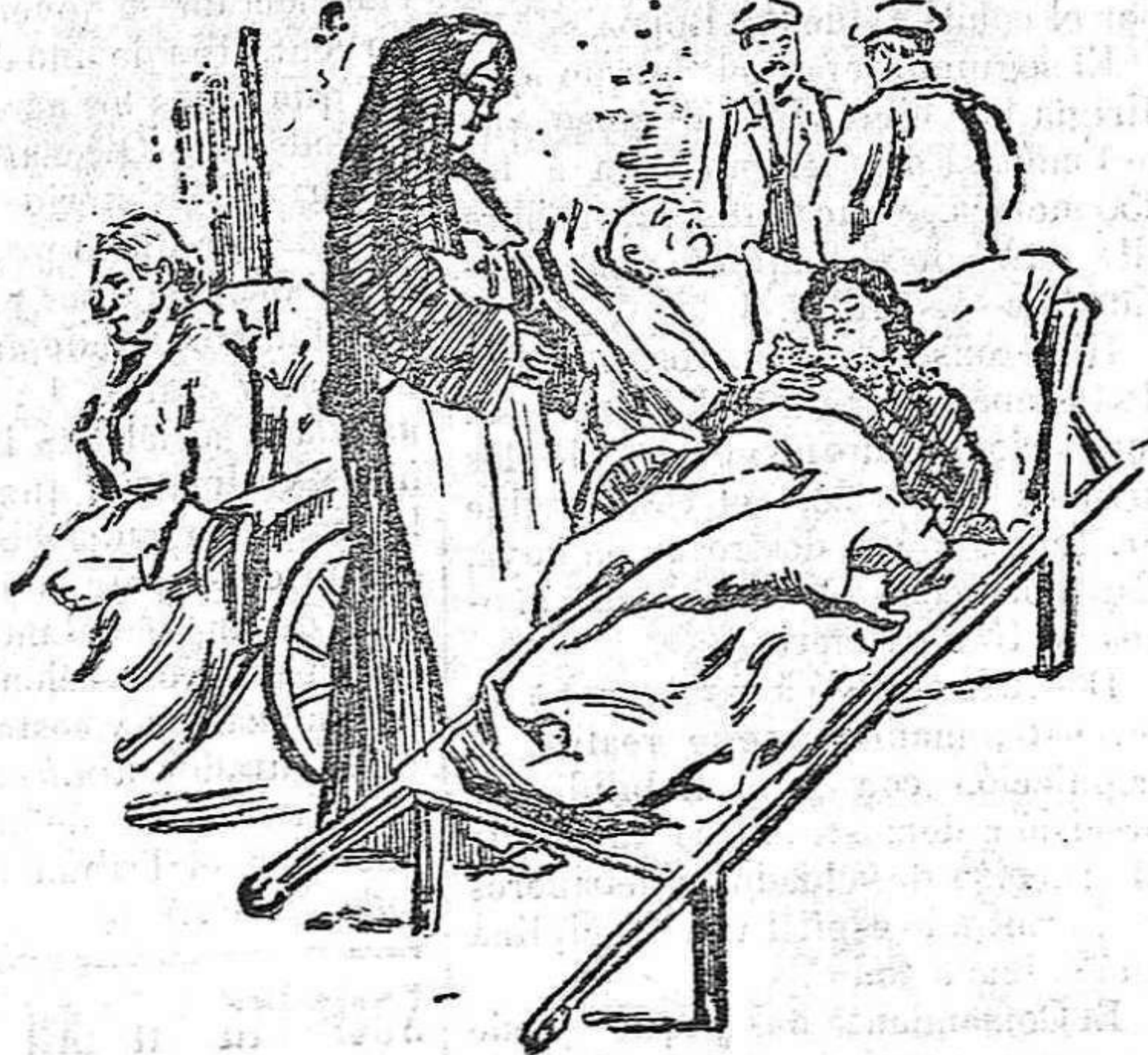
A la piscina.

en la Basílica se celebran solemnes cultos, lo mismo que en la iglesia del Rosario, terminando con admirables procesiones verificadas al resplandor de millares de antorchas.