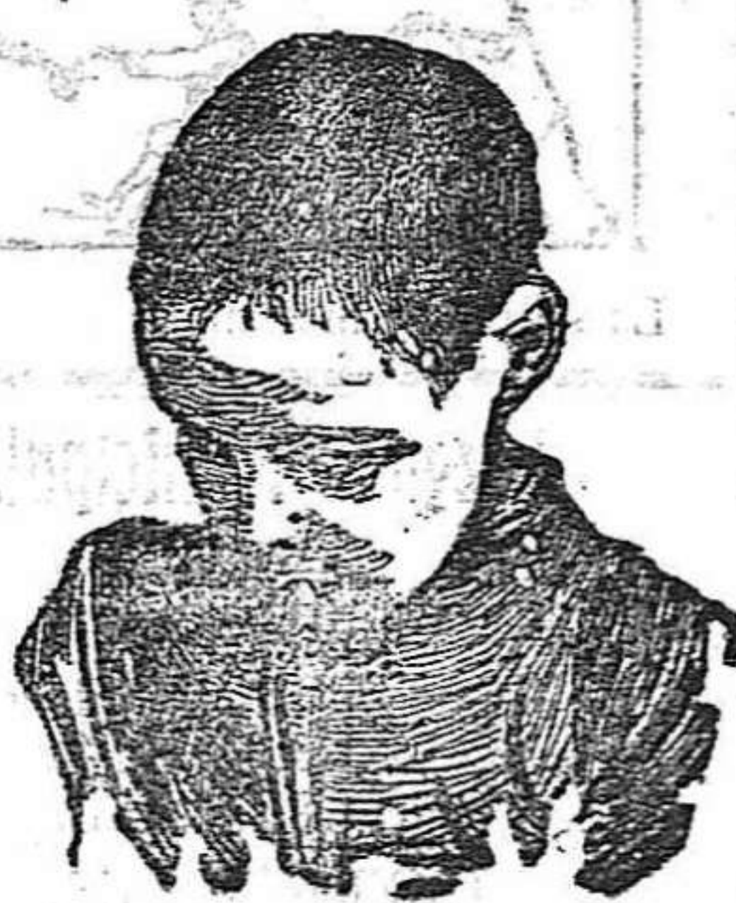
Después de usar el Capilhol.