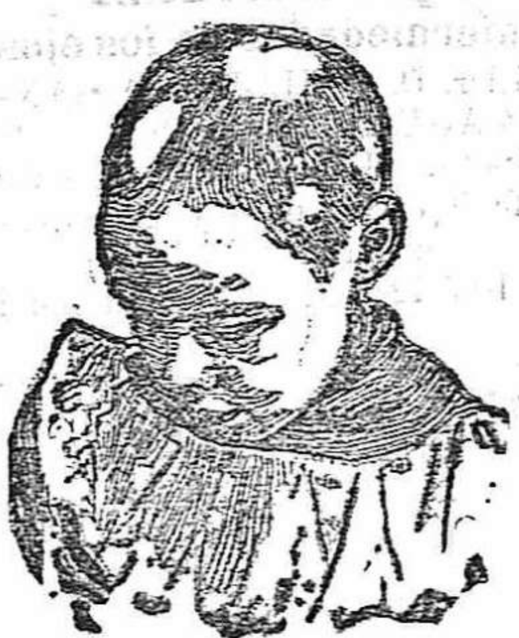
Antes de usar el Capilhol.

Frascos á 2 y 4 pesetas. Depósito central: Farmacia de Calveche, plaza del Progreso, 21, Madrid En Almería, Droguería de Area de Noé.