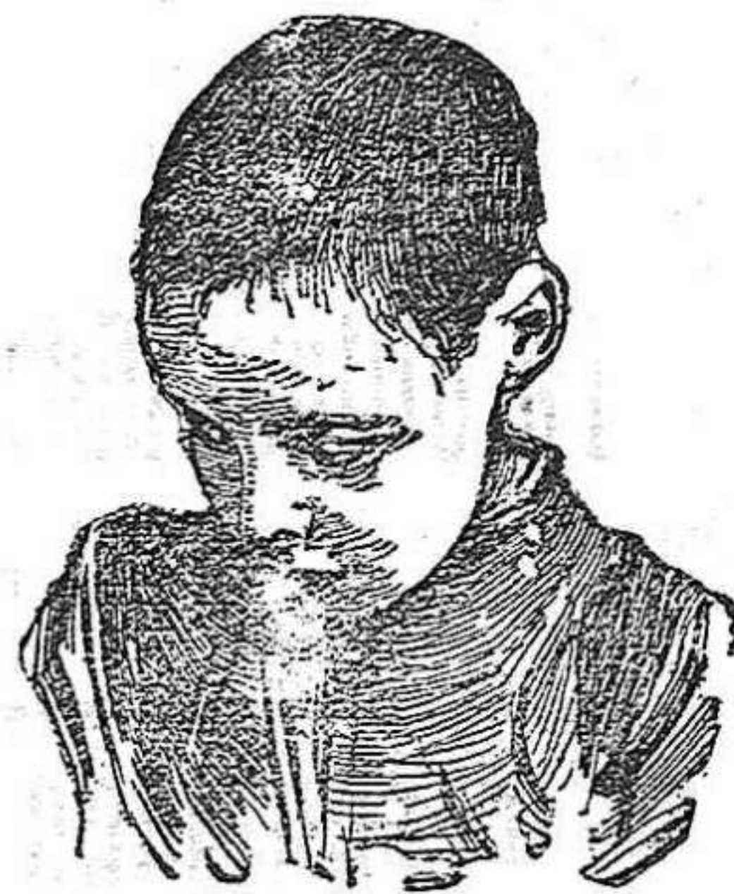
Después de usar el Capilho