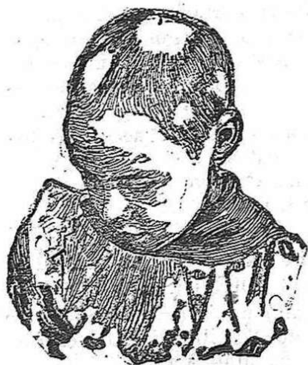
Antes de usar el Capilhol.