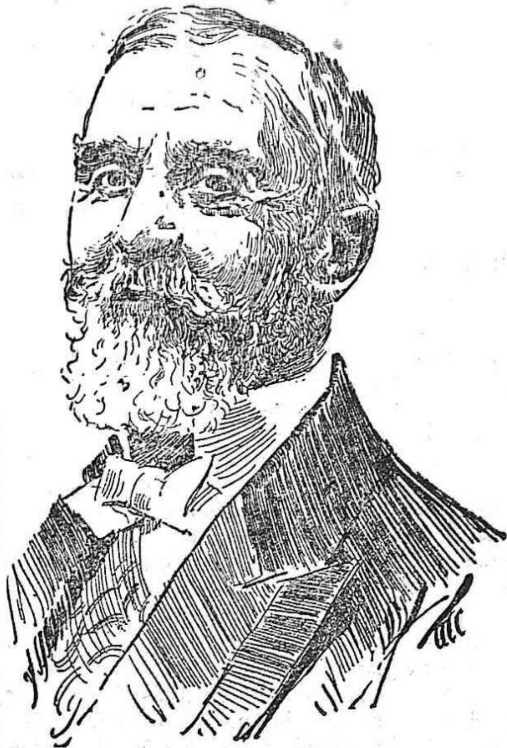
Mr. LOUBET, Presidente de la República de Francia