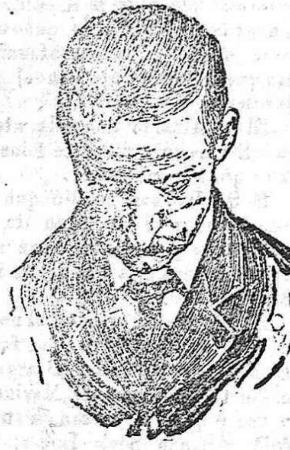
Después de usar el Capilho