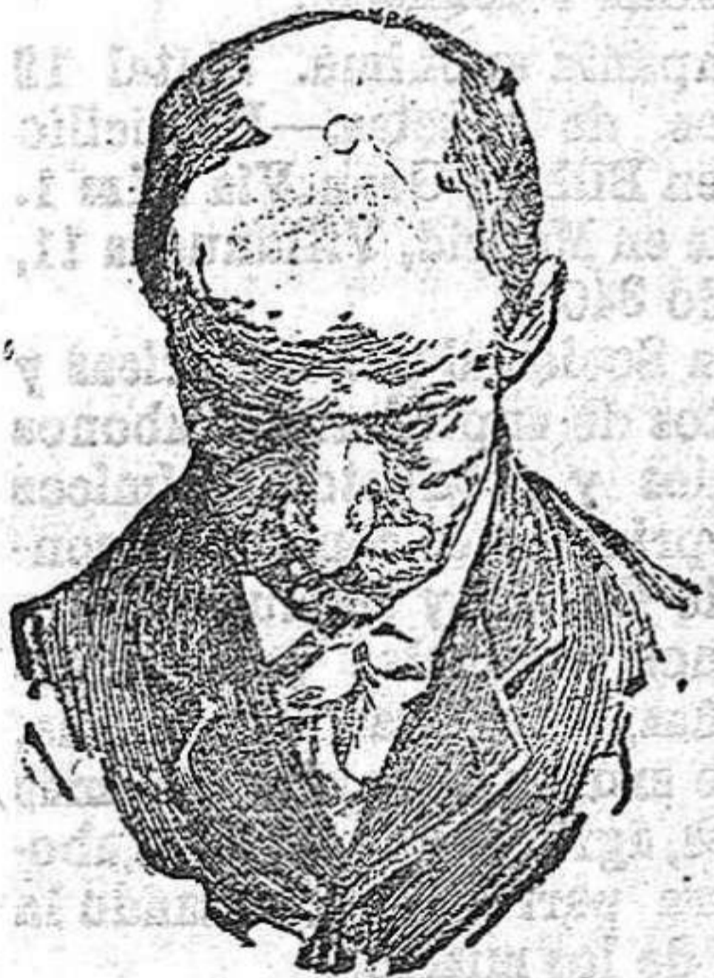
Antes de usar el Capilhol.