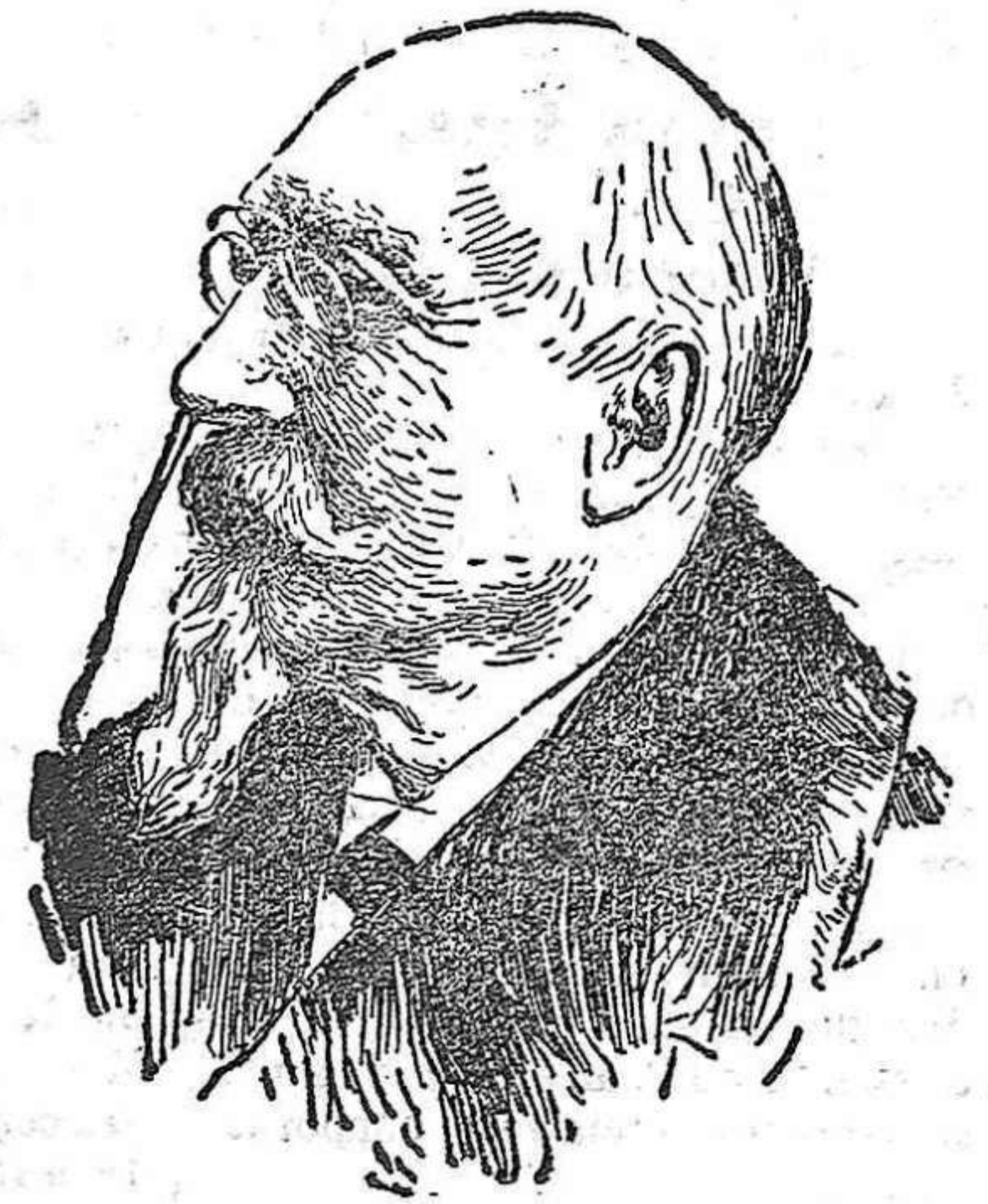
Último retrato de D. José Echegaray

leto y a fuerza de arrastrarse; ha vulgarizado las ciencias físicas y matemáticas; ha sido Ministro, desarrollando en la etapa de su mando un buen plan de Hacienda; ha sido orador brillante y ha laborado, en fin, en honra propia y bien de España, en todas las más nobles manifestaciones del espíritu.