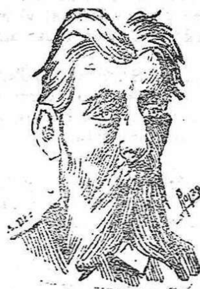
Individuo de la Comisión organizadora de los festejos a Echegaray.

política afiliándose a la escuela libre cambiata. En unión del Sr. Moret, asistió en representación del Gobierno al Congreso de economistas de Bruselas. A fuerza de laboriosidad y de constancia, los partidarios del libre cambio, entre los que se hallaba él, llegaron a establecer en 25 de abril de 1859 la Asociación para la Reforma de los Aranceles.