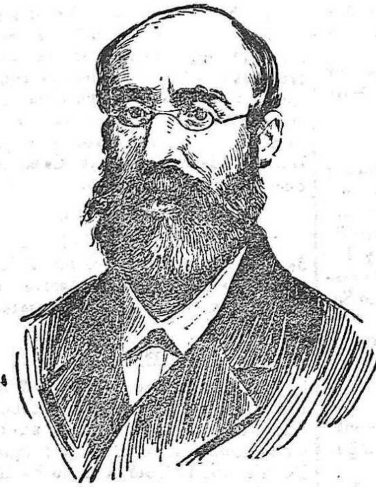
D. José Echegaray en 1874, cuando estrenó su primera obra dramática.