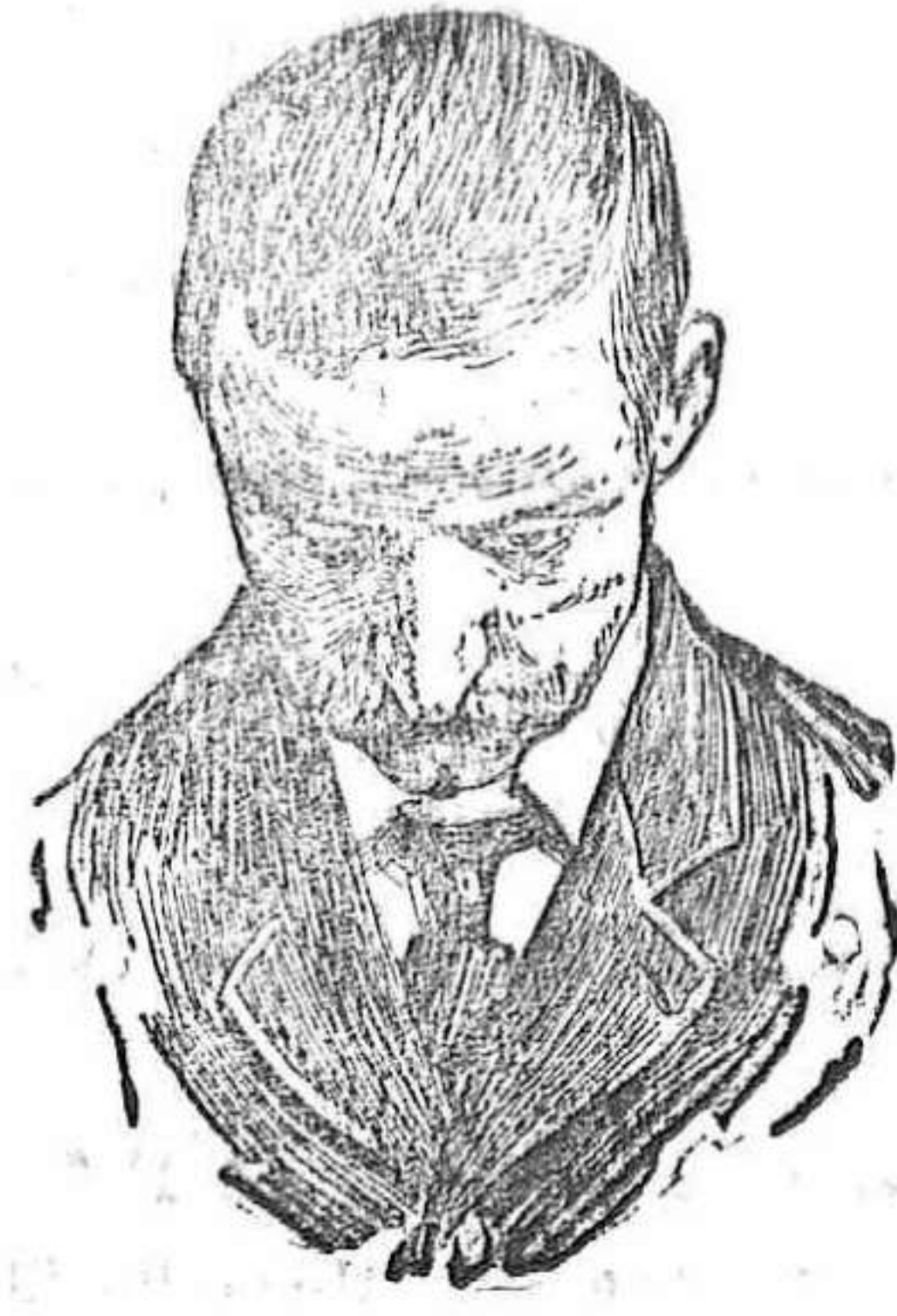
Después de usar el Capilho

Nuevas máquinas tricotas para medias, calcetines y todos los artículos de punto sin costura conocidos hasta el día. Especialidad para hacer el talón de las calcetas, automáticamente sin complicaciones, y con una producción no aventajada por ningún otro sistema. Las mejores para familias, talleres y fábricas. Se venden desde 300 pesetas con un libro especial para la enseñanza. Casa Agustí, fundada en 1888. Calle de Gerona 120, Barcelona.