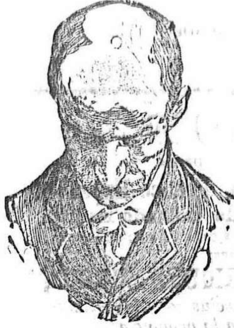
Antes de usar el Capilhol.