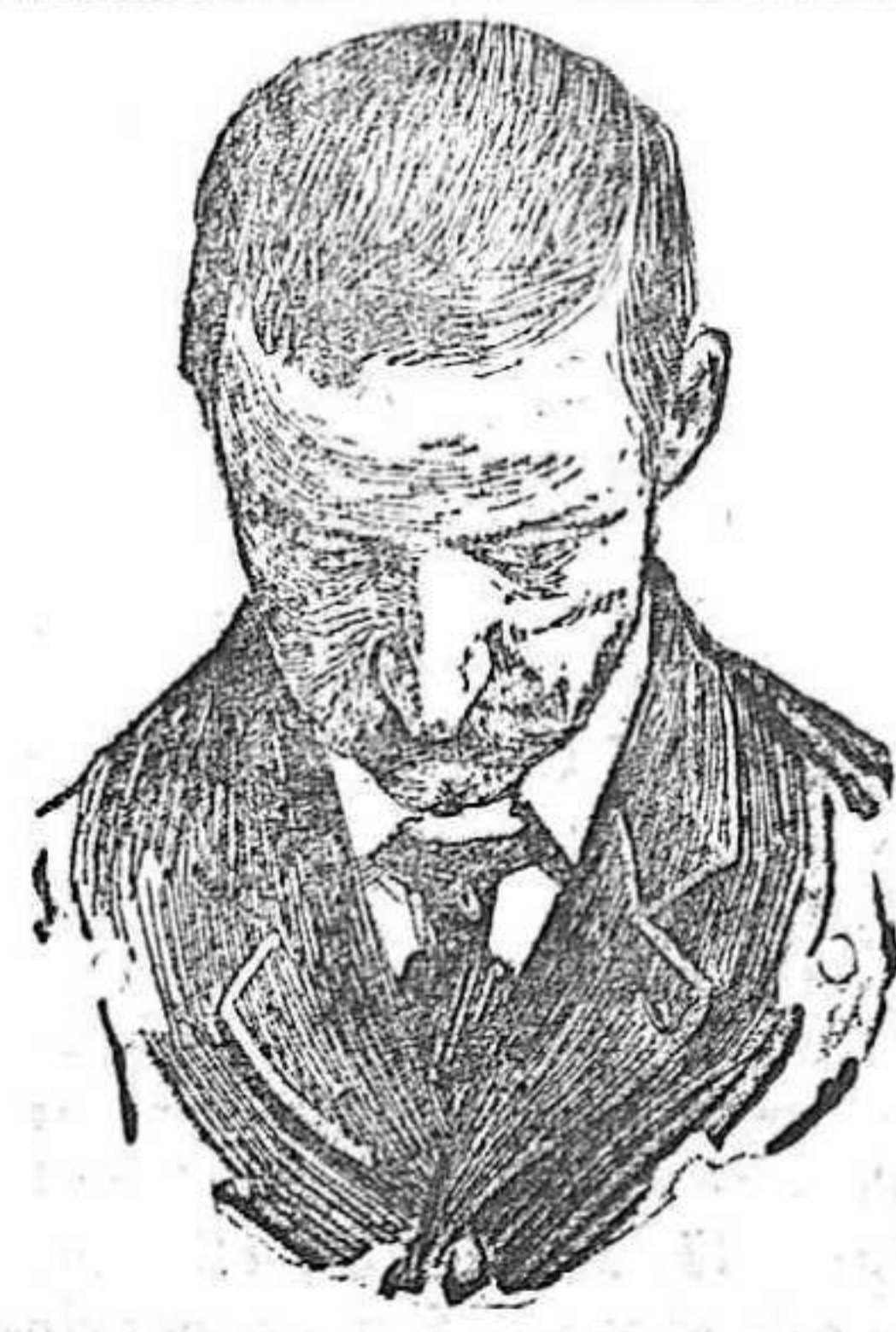
Después de usar el Capilhol.