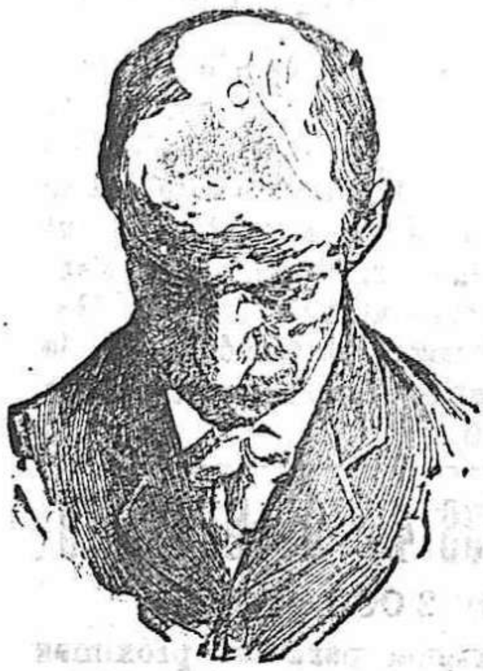
Antes de usar el Capilhol.

es de mesa. Es de éxito seguro en los esteros intestinales de los niños. No solo cura, sino que obra como preventivo, impidiendo con su uso las enfermedades del tubo digestivo. Ojos años de éxitos constantes. Exíjase en las etiquetas de las botellas la palabra ESTOMACAL, marca de fábrica registrada. De venta, Serrano 30, farmacia, Madrid, y principales de Europa y América.