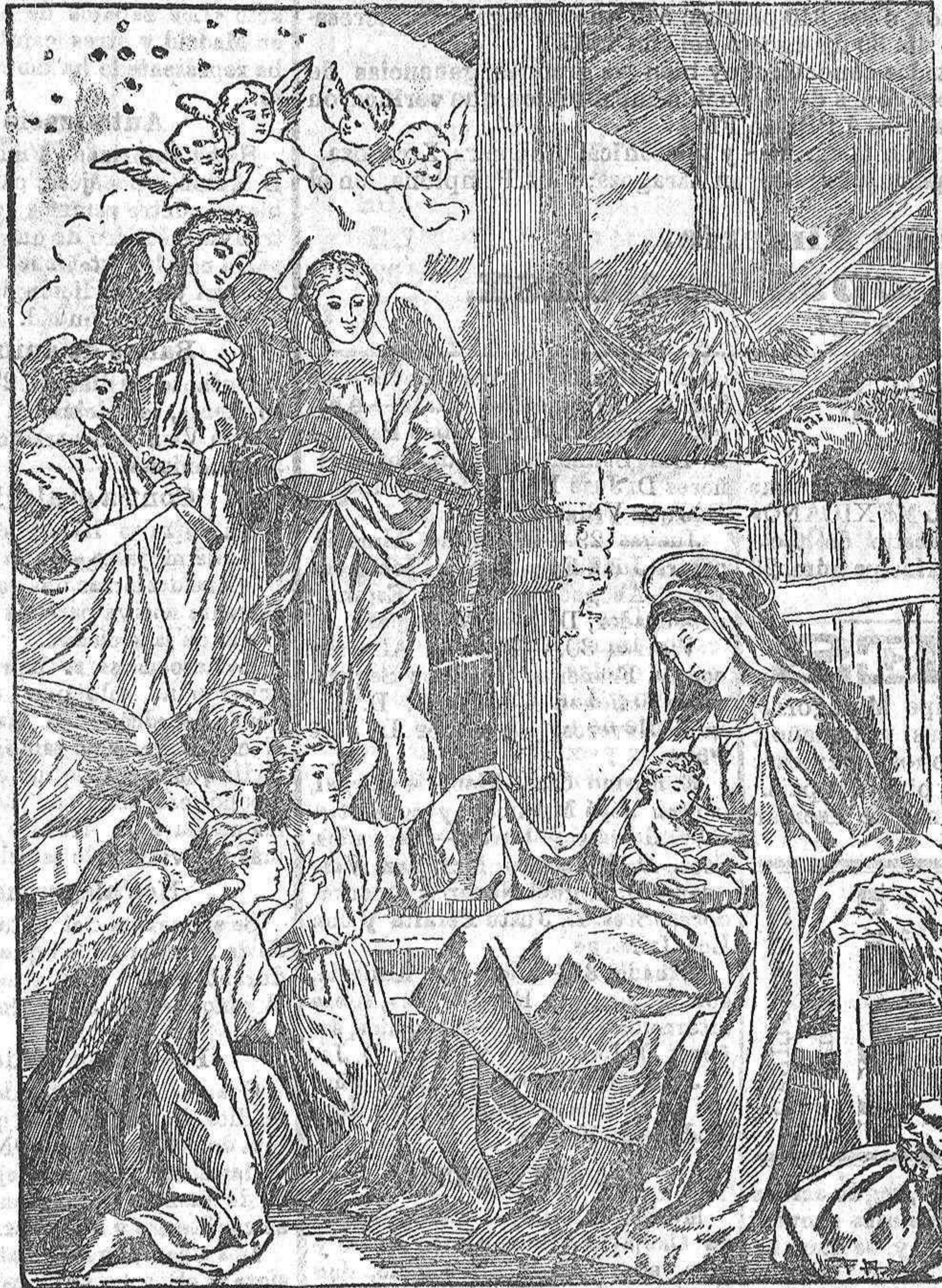
El nacimiento del hijo de Dios.

luciones y mudanzas, el Cristianismo se yergue airoso conservándose puro y grande en el alma de los hombres, las hermosas tradiciones del catolicismo, sin que sean bastantes á entibiarlas esas corrientes modernas, mezcla de excepcionalismo y desprecupacion que hoy imperan de un modo descarado.