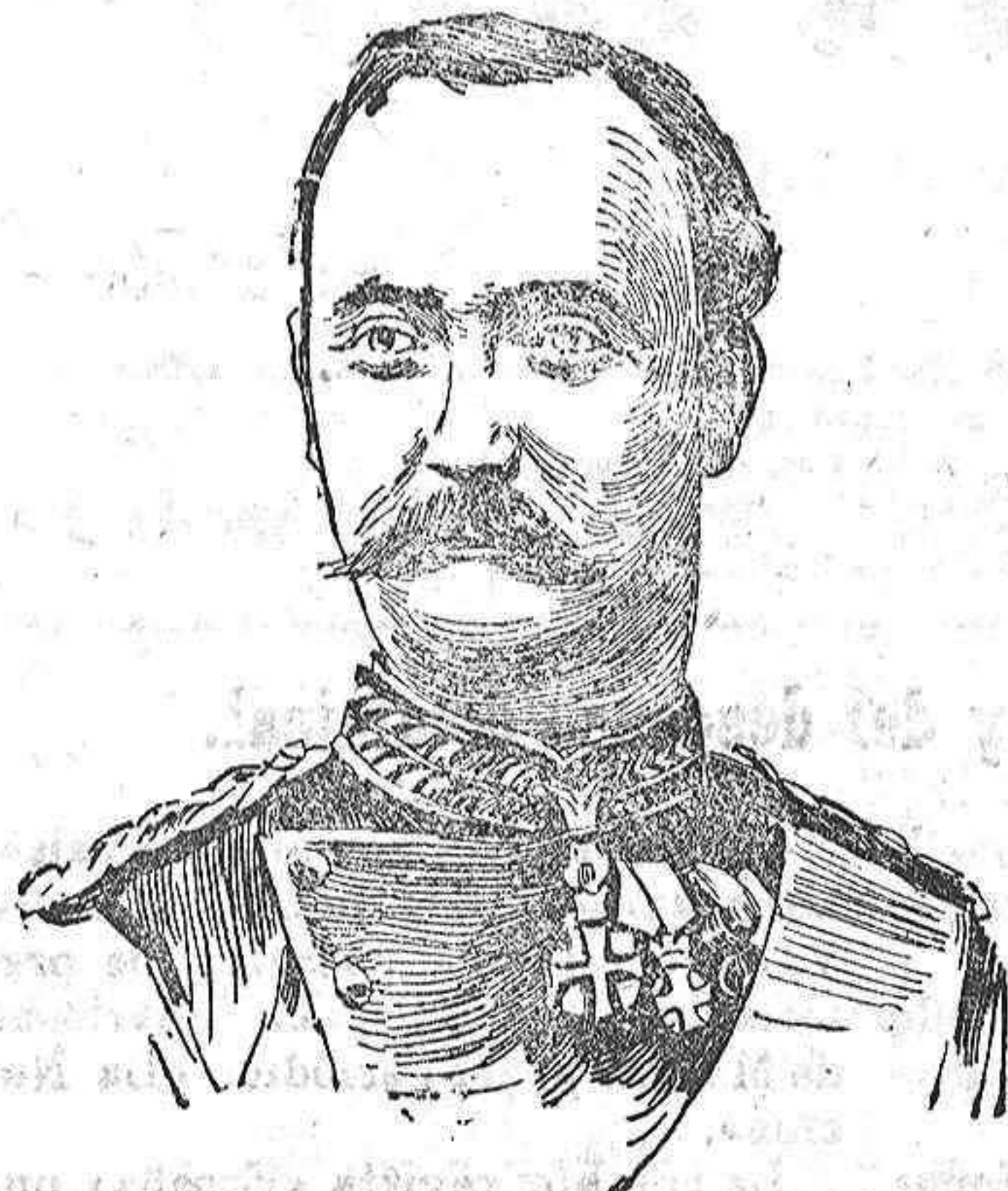
Hereditario del trono de Dinamarca, que está recorriendo los puertos de España á bordo del crucero «Hejmdal».

dió pueda conseguirse algo útil en el aumento del intercambio de productos entre España y la República Argentina.>