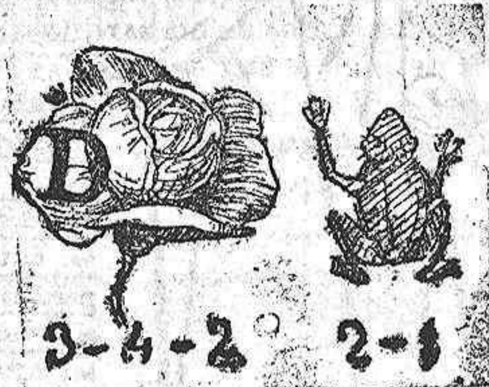
La solución mañana.