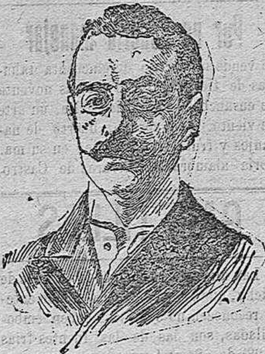
Don Eugenio Montero Villegas, Subsecretario de Instrucción Pública.

Y así este período de transición, puede ser no funesto, como se prevee, sino favorable á los intereses patrios.