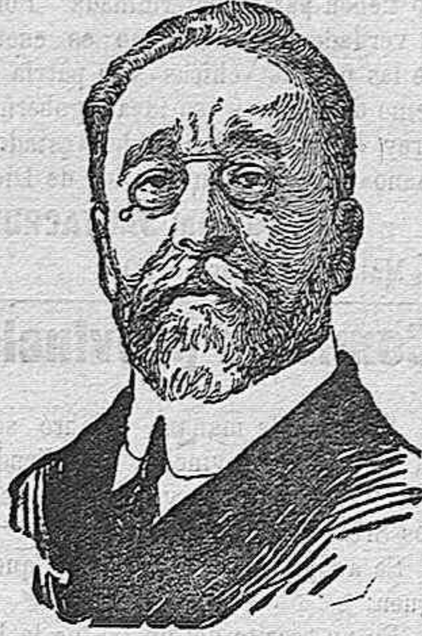
El maestro Chapí.

Es un intento más para implantar la ópera española. Será «Margarita la Tornera» la base, el punto de partida para que las grandes producciones de los músicos españoles alcancen el puesto á que tienen derecho por sus altos méritos. Acaso sí. Lo que desde luego puede afirmarse, es que la partitura de «Margarita la Tornera» es tan rica de inspiración, tan original en sus motivos melódicos y en sus procedimientos, que no es posible poner en duda la superioridad de sus méritos sobre los de algunas obras, de géneros consagrados—acaso más que por el público por los editores—que andan por los teatros de todo el mundo, obteniendo centenares de representaciones al cabo del año.