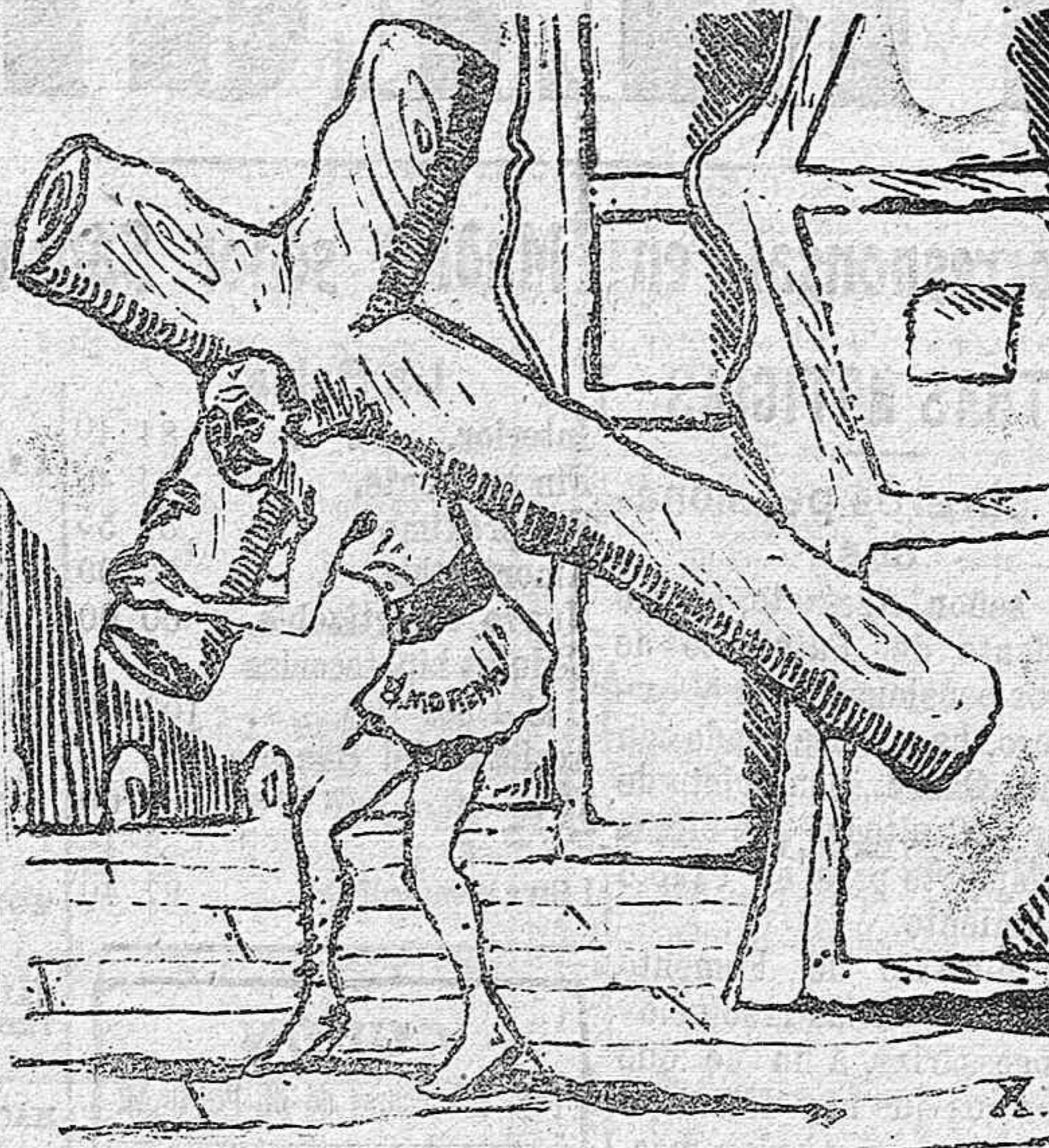
Con la cruz a cuestas.